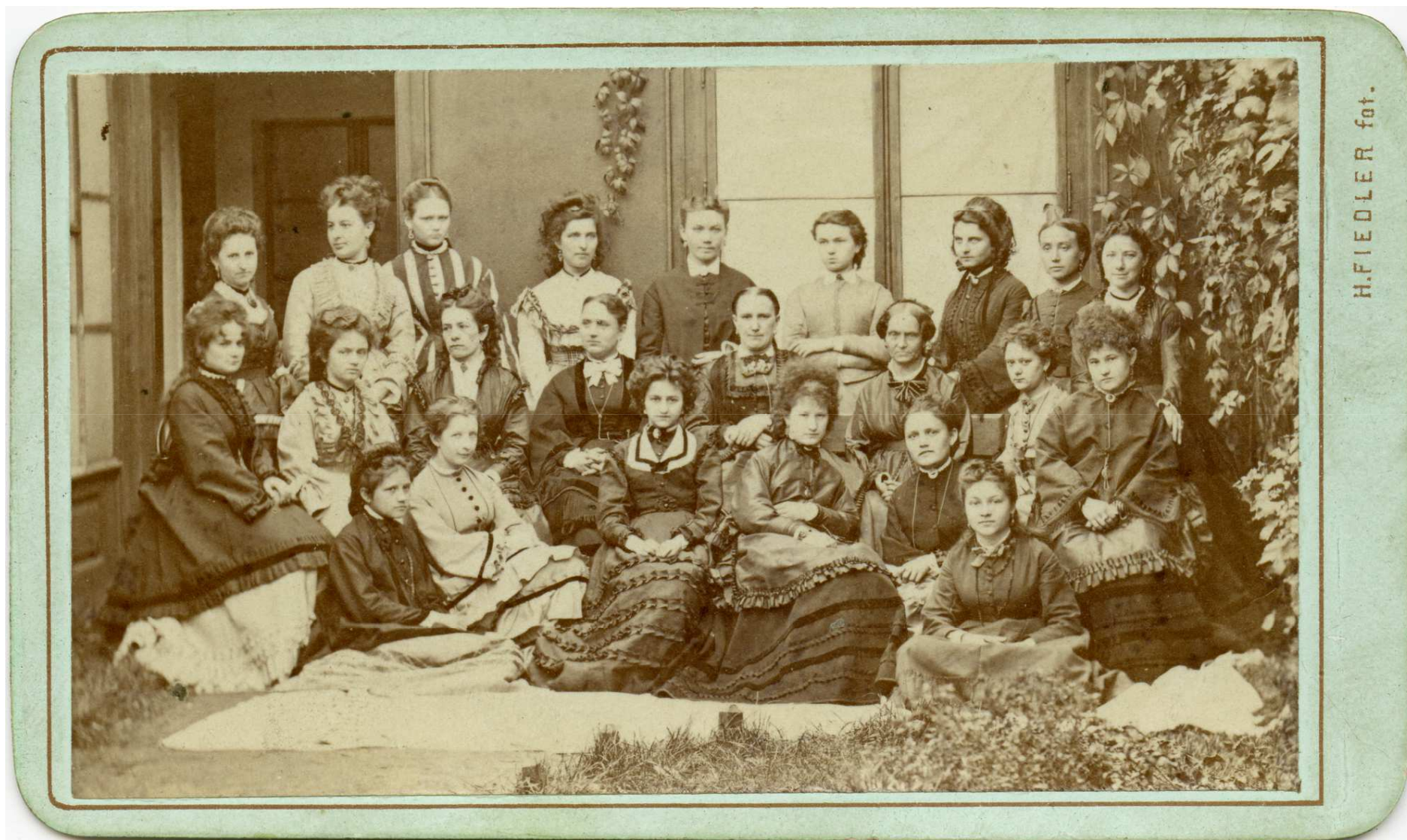
Obr. 3 Podobizna skupinová: Americký klub dam v Praze