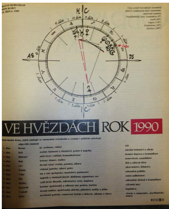
Obrázek 2: Republika ve hvězdách 122

„Já jsem pro ně psal asi... no, ještě v roce 1993, nějak jsem končil potom, jo? Asi tři roky jsem psal. Ale ono to pak šlo k čertu“... Takže pak jsem přispíval do Regeny, pak do Regenerace, ale to už nebylo ono. ... Tam ty náklady byly nízký a navíc tam ty lidi začali blbnout, hrozně. Oni se vždycky rozhádali mezi sebou, takže vždycky jako utekla část redakce...“ 121