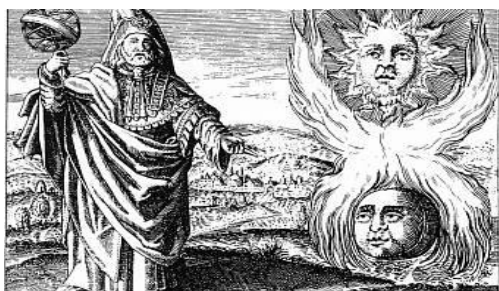
Obrázek 1: Hermes Trismegistos

Za nejvyspělejší formu ezoterismu je mnohými badateli chápán staroegyptský hermetismus, jehož myšlenkový základ je odvozen ze Smaragdové desky obsahující 3 zásadní hermetické nauky. 16 Autorství tohoto základního textu o ezoterismu se připisuje Hermésu Trismegistosovi, který je spojován s egyptským bohem Thovtem (na základě identifikace Thovta s řeckým bohem Hermem). Později byl ztotožňován i s biblickým Henochem. 17