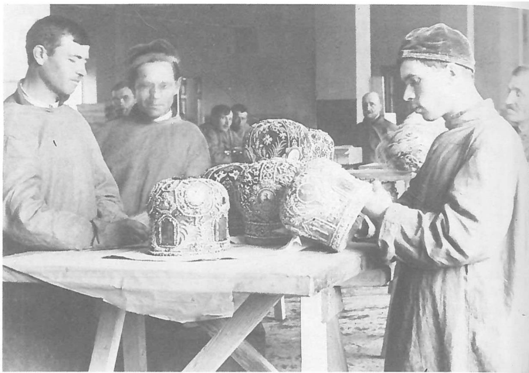
Взвешивание и составление списков изъятых церковных ценностей. 1922 г.

Evidence a vytváření soupisu zabraných církevních cenností v roce 1922.