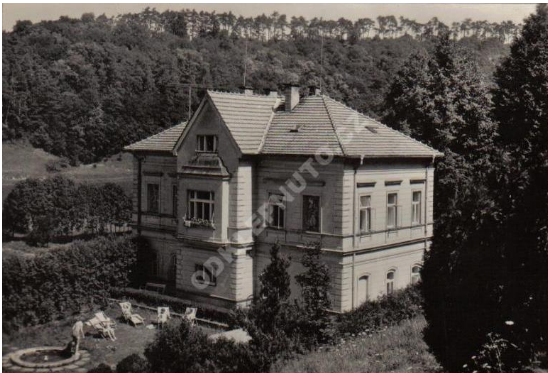
Obrázek 1. Fotografie vily v Tupadlech (okres Mělník), kde se 21. a 22. 1. 1954 konala konference, na níž bylo stanoveno definitivní znění ortoepických pravidel 1. vydání VŠČ I (1955). V tomto objektu č. p. 88 se donedávna nacházel hotel, snímek pochází pravděpodobně z 50. let 20. století.