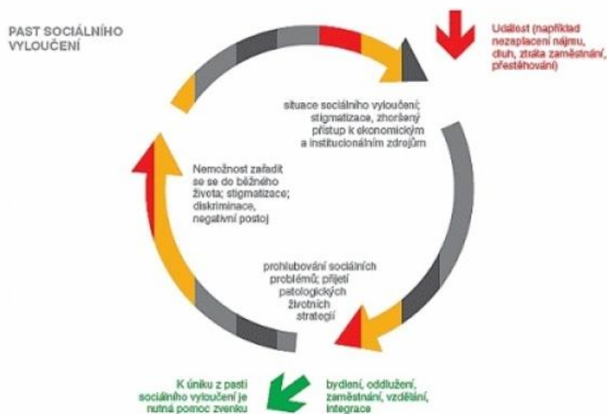
Obrázek 1 Past sociálního vyloučení