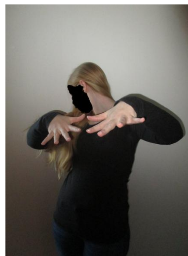
Obrázek 6: Příklad „pohybového gesta“ BĚŽ ODE MĚ PRYČ