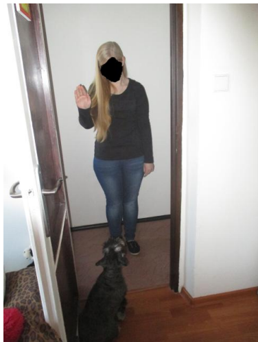
Obrázek 3: Posunkový povel používaný ve sportovní kynologii Sedni!