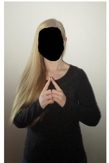
Obrázek 4: Znak z českého znakového jazyka VEN