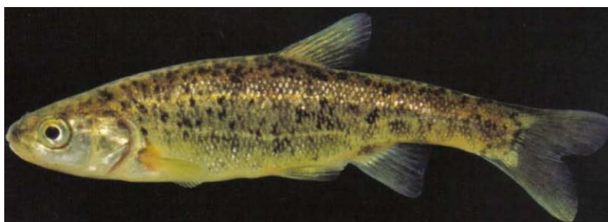
2. Delminichthys adspersus , řeka Matica, Chorvatsko, 65 mm (převzato z Kottelat & Freyhof)