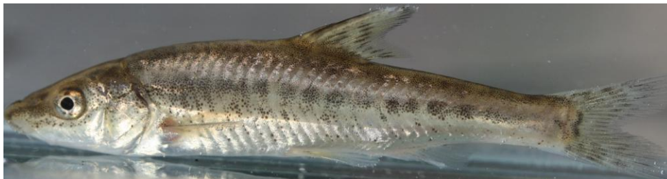
1. Aulopyge huegelii