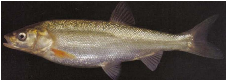
7. Rozdíl ve velikosti šupin druhu Squalius tenellus , jezero Buško, Bosna a Hercegovina, 260 mm a druhu Squalius zrmanjae , řeka Zrmanja, Chorvatsko, 150 mm (převzato z Kottelat & Freyhof, 2007)