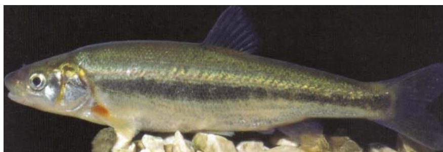
5. Telestes turskyi , Čikola, Chorvatsko, 120 mm (převzato z Kottelat & Freyhof, 2007)