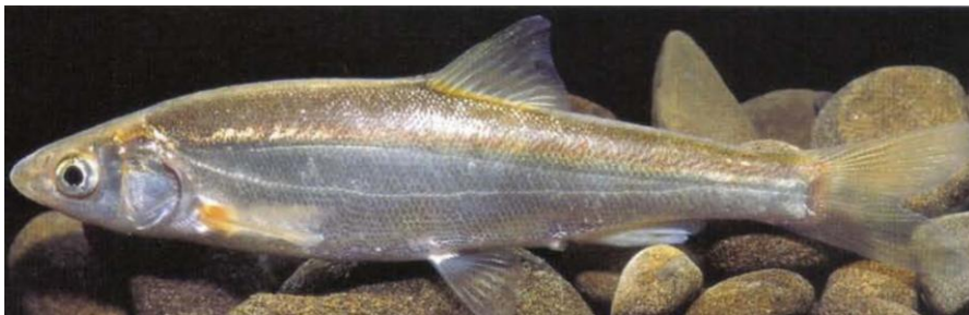
6. Chondrostoma phoxinus , jezero Buško, Bosna a Hercegovina, 90 mm (převzato z Kottelat & Freyhof, 2007)