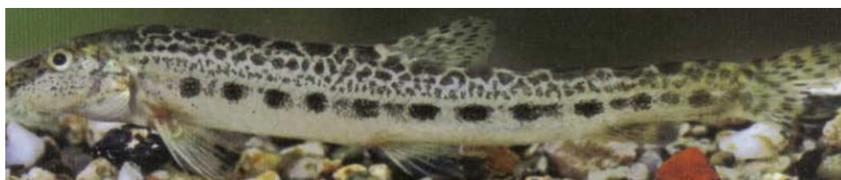
8. Cobitis illyrica , polje Imotski, Chorvatsko, 65 mm (převzato z Kottelat & Freyhof, 2007)