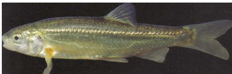
3. Phoxinellus pseudalepidotus , Mostarsko Blato, Bosna a Hercegovina, 60 mm (převzato z Kottelat & Freyhof, 2007)