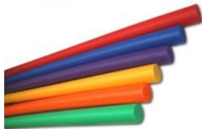
Obrázek č. 15