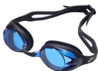
Obrázek č. 3