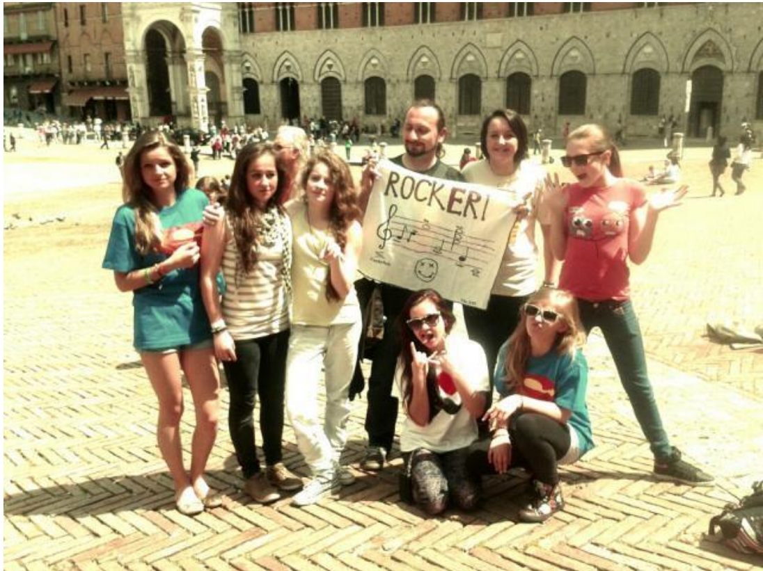
Obrázek 19 – Žáci v Itálii