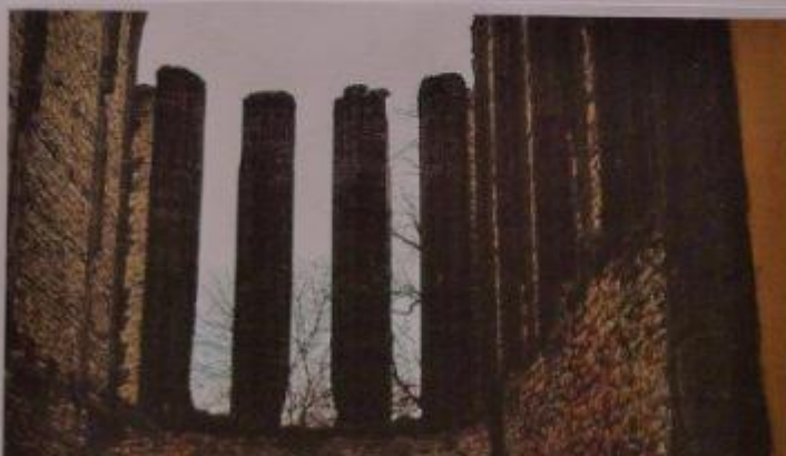
Obrázek 21 – Práce dětí