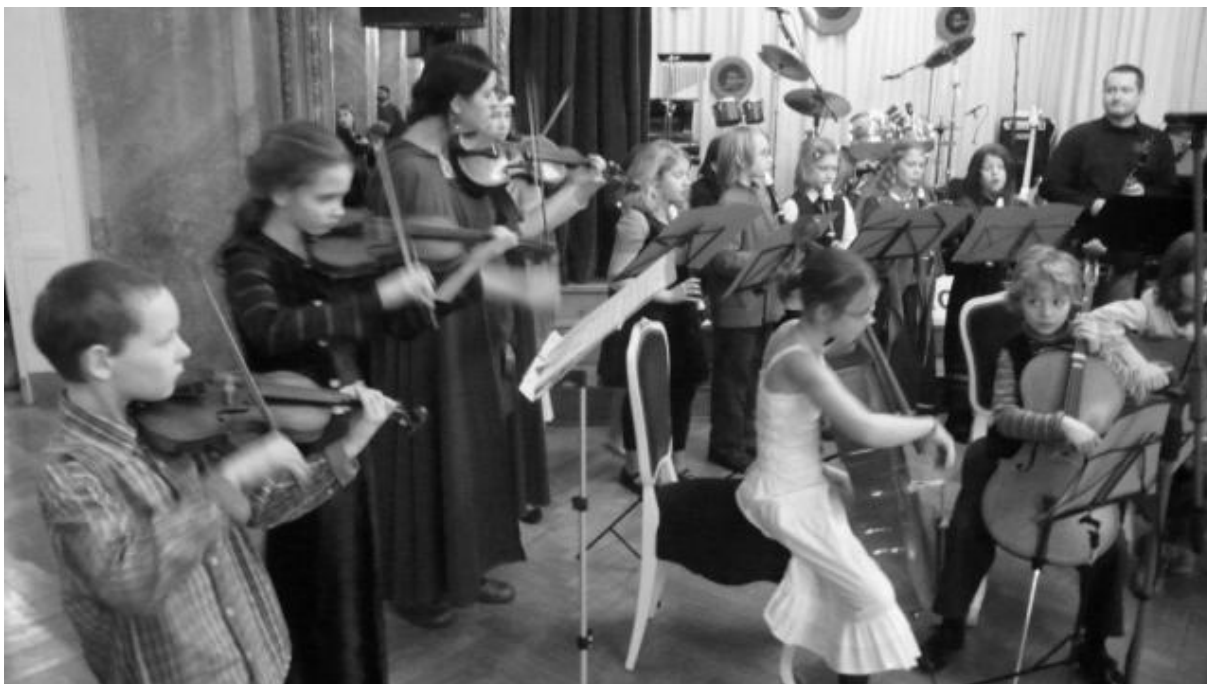
Obrázek 16 – Veselo-školský ples