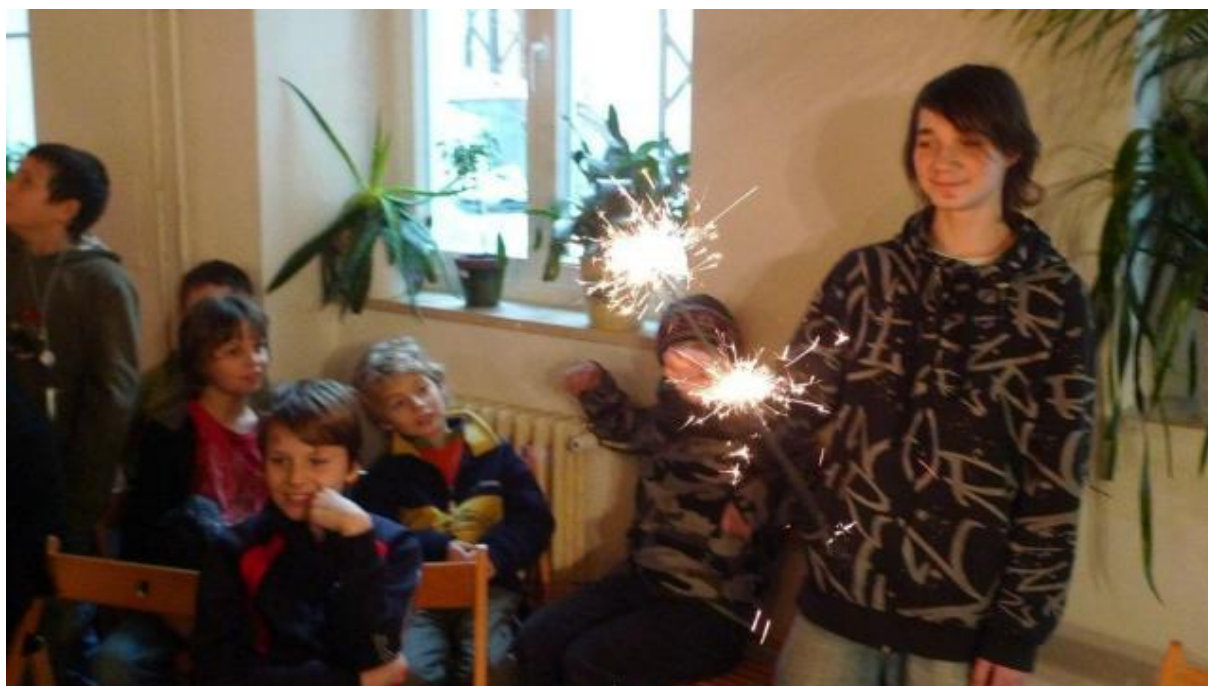
Obrázek 13 – Vánoční slavnosti