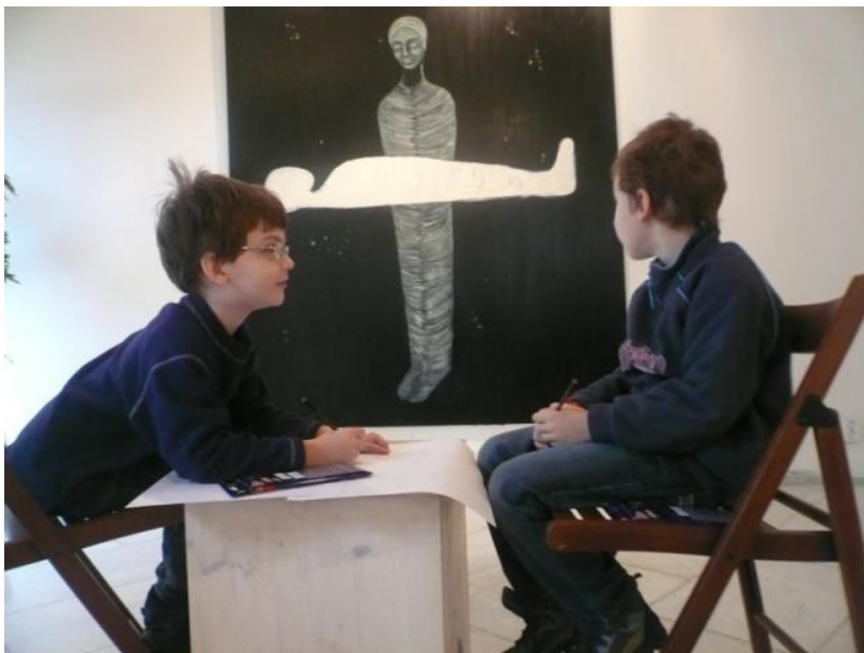
Obrázek 22 – Žáci hodnotí dílo v galerii