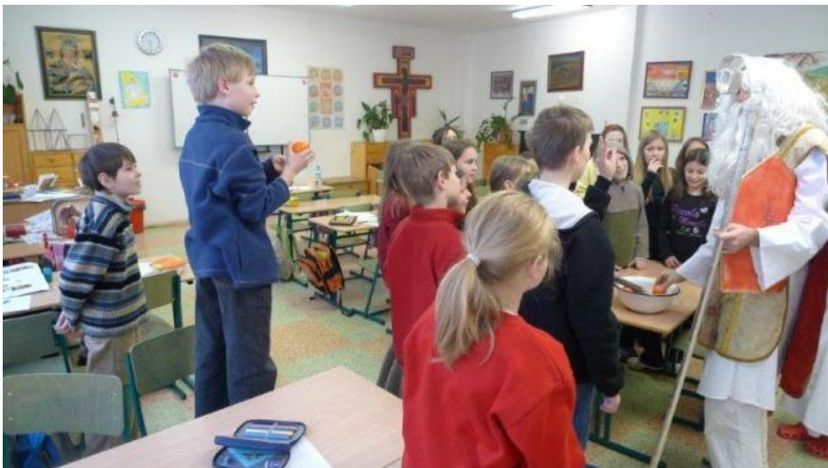
Obrázek 15 – Sv. Mikuláš