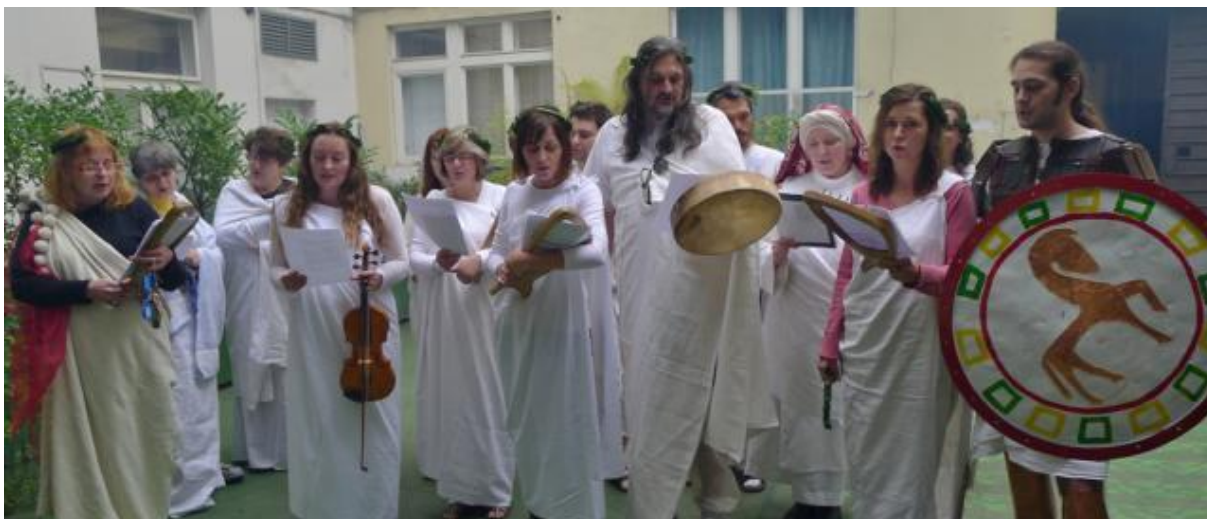
Obrázek 14 – Olympijské slavnosti