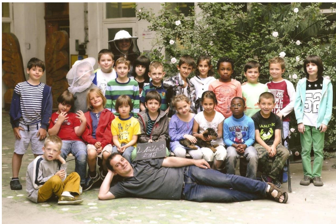
Obrázek 3 – Žáci chovají včely.