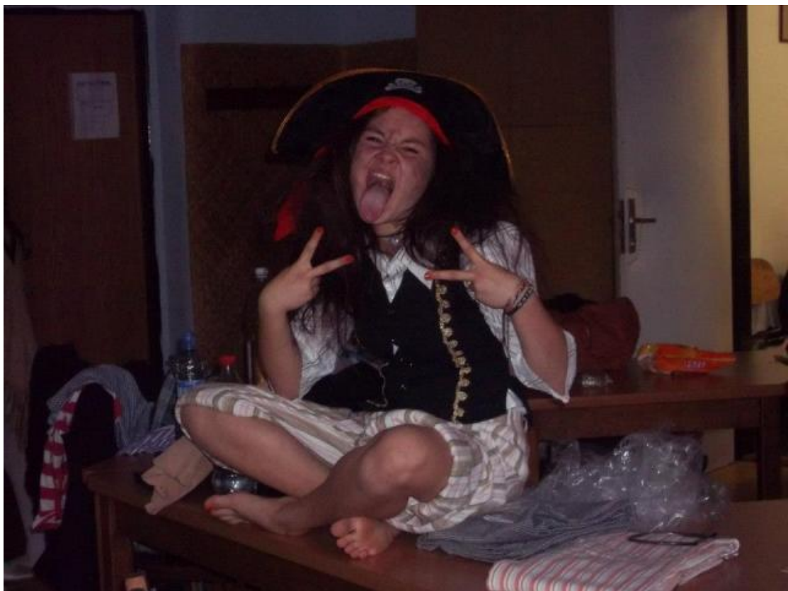
Obrázek 20 – I děti s ADHD slaví úspěchy