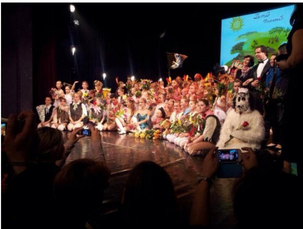
Obrázek 17 – Divadlo