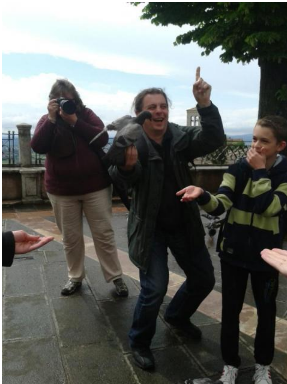
Obrázek 18 – učitel jako Sv. František v Assisi