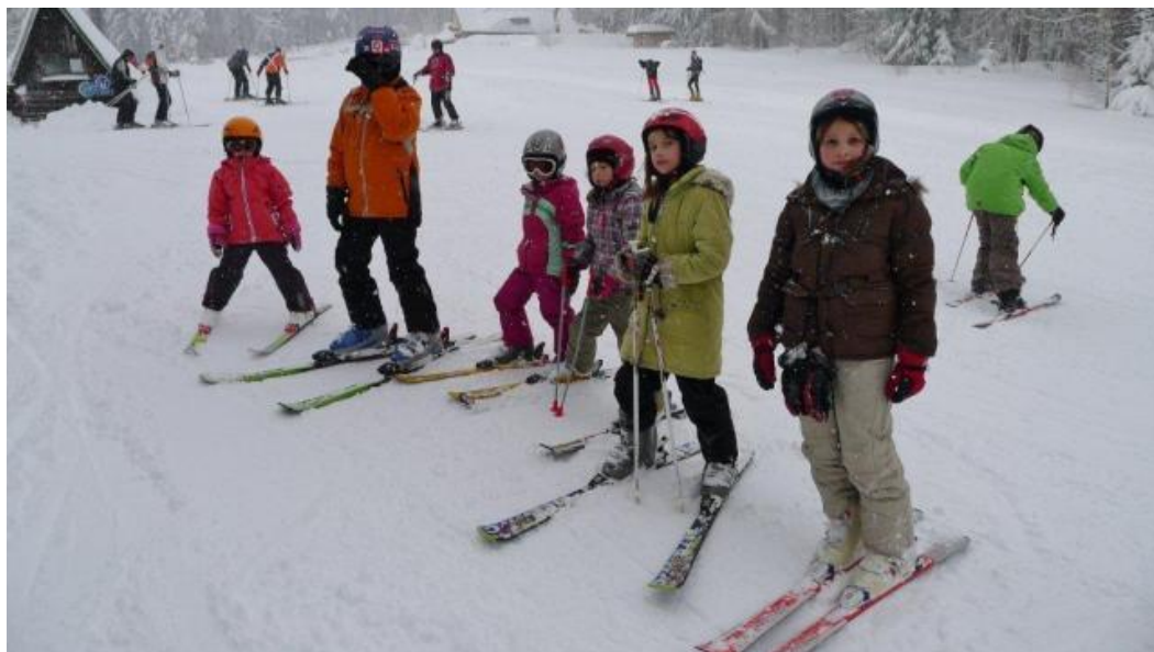
Obrázek 12 –Lyžařský pobyt