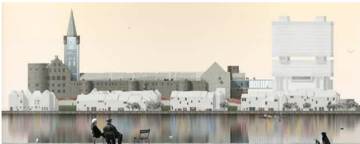
7. Pohled na komplex z ostrovu Kant

a ideologickým ohniskem města. Projekt je rozdělen na čtyři etapy realizace.