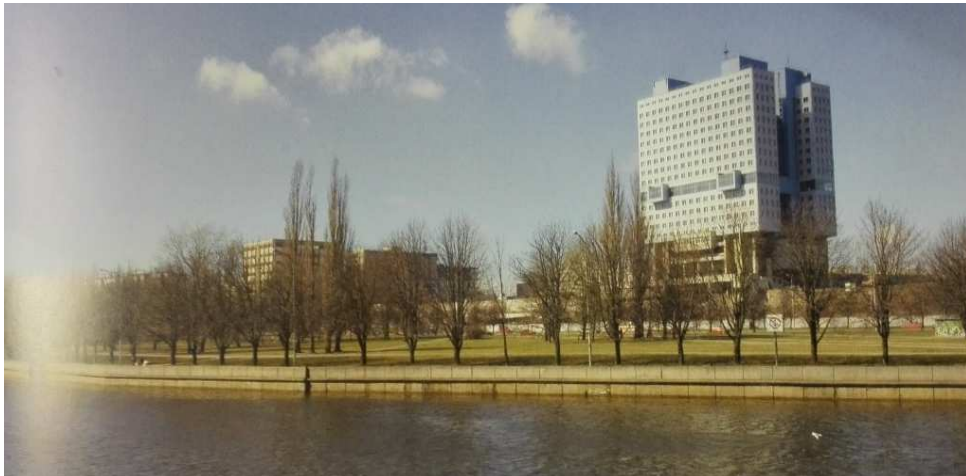
2. Řeka Pregolya. Nábřeží podél Moskevské třídy. Vpravo je Dům Sovětu. Kaliningrad. 2010.

Následující kulturní vývoj v pobaltském regionu měl úplně jiný scénář. Nové významné ideologické a politické faktory navždy změnilu podobu společnosti.