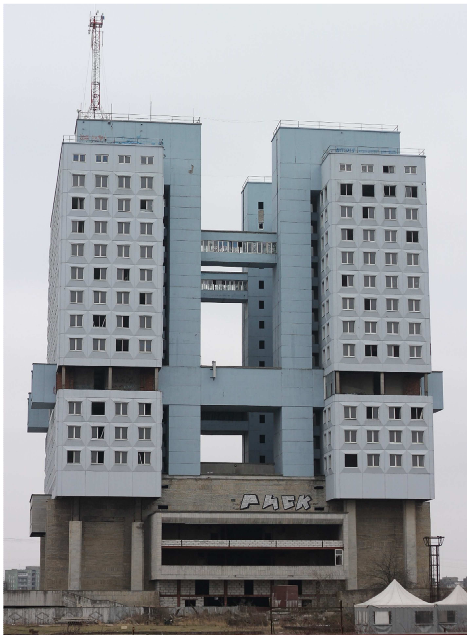
5. Dům Sovětů. Kaliningrad. Březen 2016

Dnešní Dům Sovětů je nebezpečný v pravém slova smyslu – z oken padá sklo, budova se nachází v takzvané „zóně s hlídacími psy“ a vypadá jako skutečný nepřítel tyčící se nad prázdným náměstím.