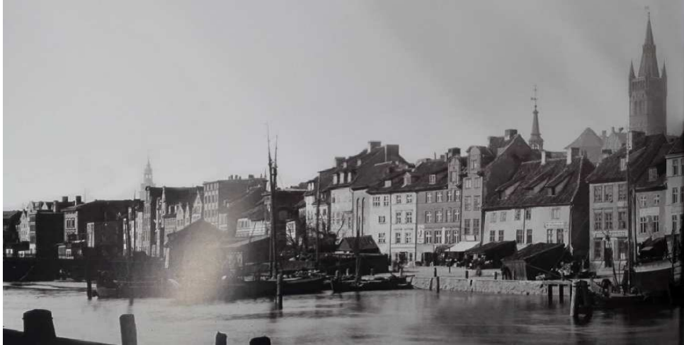
1. Řeka Pregel. Nábřeží Alstadta. Vpravo je vidět Zámek. Königsberg na počátku XX. století.