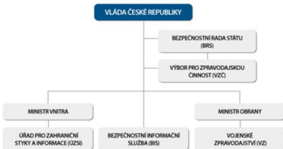
Příloha č. 1: Schéma zpravodajského systému České republiky