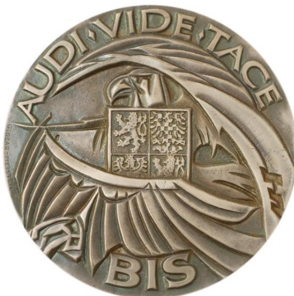
Příloha č. 2: Znak Bezpečnostní informační služby