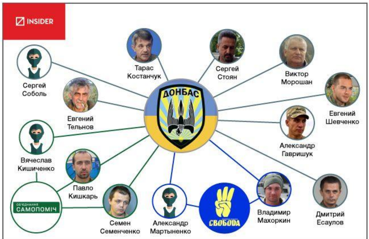
Пříloha č. 6: Graf napojení dobrovolníků na politické strany 2