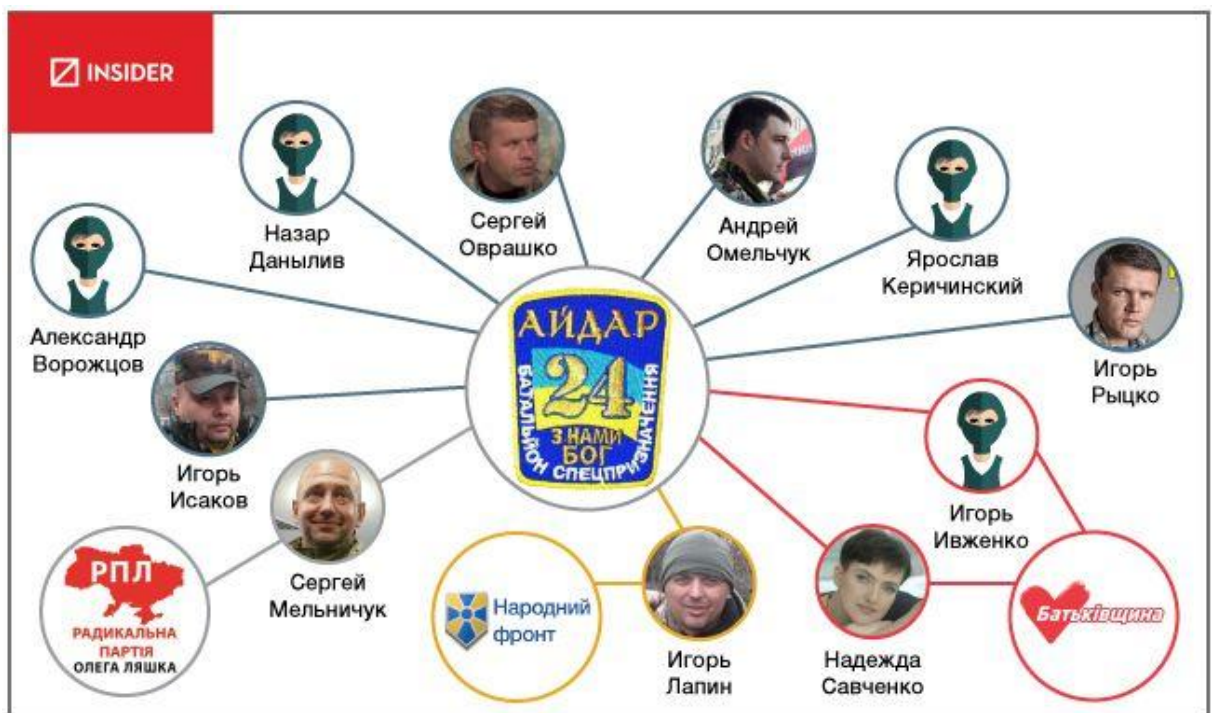
Пříloha č. 7: Graf napojení dobrovolníků на политические strany 3