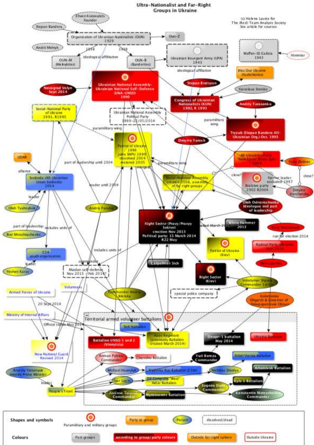
Příloha č. 10: Graf napojení pravicových radikálů na politické strany a dobrovolnické prapory.