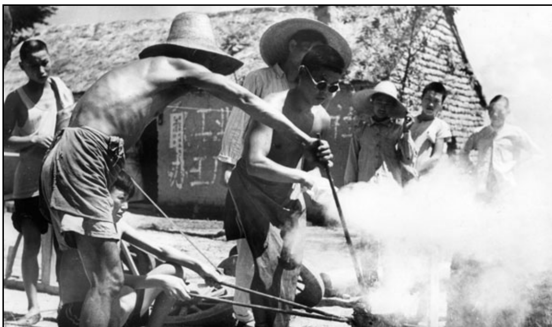
Členové komuny taví ocel. Čína, období Velkého skoku vpřed 158

Velký skok vpřed byl odstartován na počátku léta 1958. Straníci začali postupně rušit zbytky soukromého vlastnictví a ty byly začleněny do prvních větších komun. 156 Když v létě strana vyhlásila výsledky sklizně jako výborné, bylo oficiálně rozhodnuto zřídit komuny na celém území země. Tisíce malých a separovaných družstev bylo pospojováno ve větší celky. Lidé byli řízeni takřka podle vojenských regulí, pracovali s maximálním zápalem, vedli kolektivní život a stravovali se ve společných jídelnách. 157