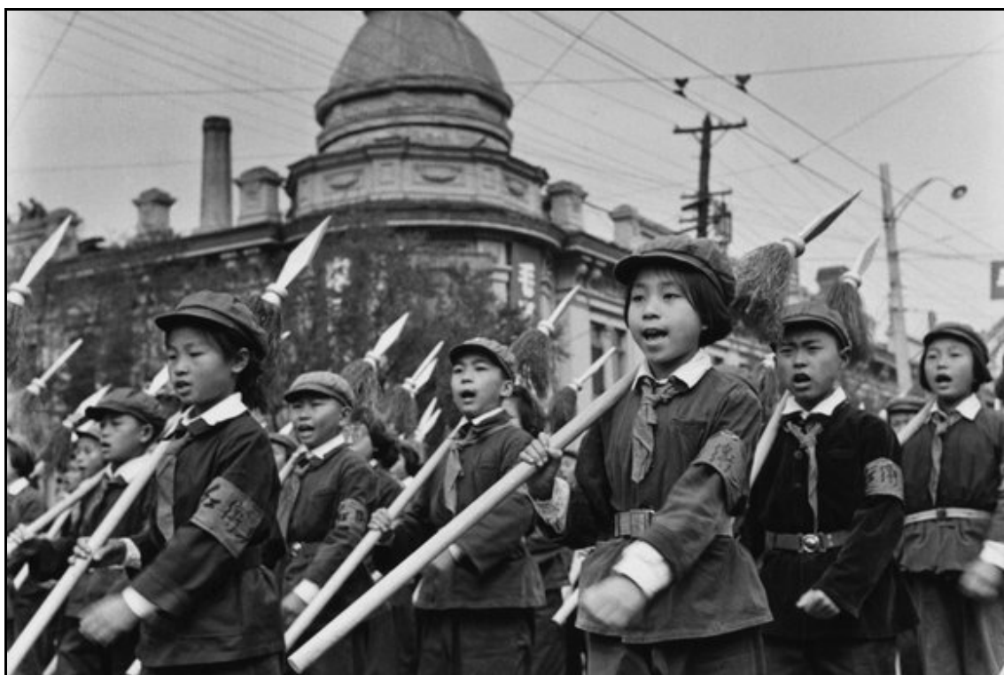
Pochodující Rudé gardy. Čína, období Velké kulturní proletářské revoluce 281

V květnu 1966 byli Pcheng Čen a další v rámci čistek odstaveni od moci a byla oficiálně spuštěna Velká proletářská kulturní revoluce. 279 Toto masivní politické hnutí, osobně iniciované, kontrolované a manipulované Maem, bylo cíleno na odstranění kritiků od moci a autority, zničení jejich ideologického vlivu a revizionistické politiky. Ne pouze domácí, ale i zahraniční politika byla značně radikalizována. Mnoho vazeb bylo vážně narušeno, včetně vztahů Pekingů se zeměmi tzv. třetího světa. Až plný dopad Velké kulturní revoluce znovu probudil sovětský zájem o Čínu. Byly to právě sovětsko-čínské vztahy, které byly chaosem poznamenány nejvíc. Poprvé byl oficiálně deklarován odklon od Sovětského svazu. 280