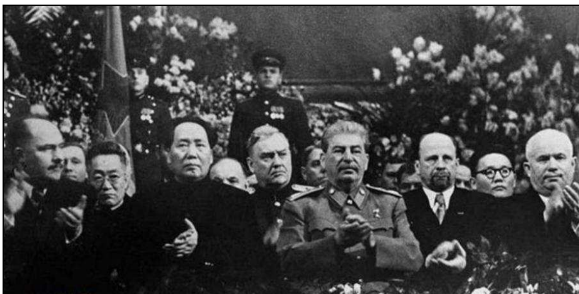
Oslava 70. narozenin Josifa Vissarionoviče Stalina. Moskva, prosinec 1949 80

Jakýmsi zlomem byla setkání Liou Šao-čchiho, Kao Kanga a Wang Ťia-sianga se sovětskými partnery v Moskvě mezi 26. červencem a 14. srpnem 1949. Ačkoliv nedůvěřivý Stalin oficiálně přijal čínské straníky jako obchodní delegaci z Mandžuska, hned na první schůzi ujistil Liou Šao-čchiho, že jim poskytne přímou podporu. Přestože se Liou zavázal, že čínská strana bude plnit příkazy a nařízení Moskvy, v následujících měsících museli čínští komunisté neustále dokazovat, že v žádném případě nebudou následovat jugoslávskou cestu separace a Mao Ce-tung není druhým Titem. 79