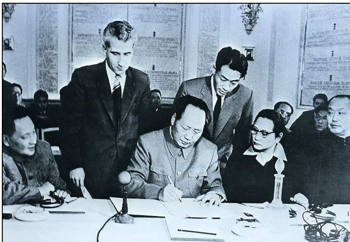
Teng Siao-pching, Mao Ce-tung a Sung Čching-ling během konference komunistických a dělnických stran. Moskva, listopad 1957 129

Ve svém projevu z února 1957 pojmenovaném „Správné zacházení s rozpory mezi lidmi“ 126 předseda znovu kladl důraz na svědomitou spolupráci se Sovětským svazem, neboť zkušenosti které tato země mohla Číně předat, byly obrovské. Pouze Sovětský svaz, socialistická země a spojenec, toto mohl poskytnout. Avšak ve stejnou dobu varoval před slepým kopírováním modelu, neboť absolutně všechny sovětské koncepce nemohly být aplikovány na čínské podmínky. 127 Pro Maa bylo důležité posilování vazeb s Moskvou, ale i dalšími komunistickými centry na bázi společné solidarity. 128