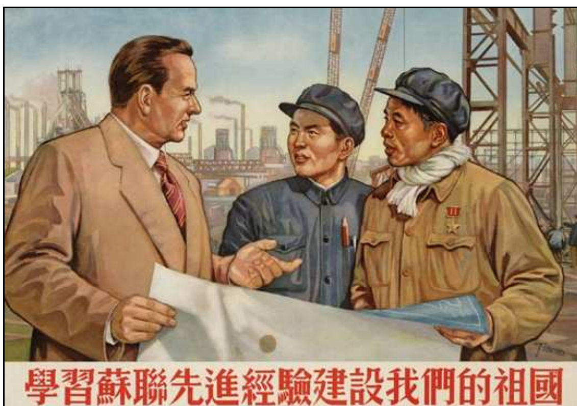
Čínský propagandistický plakát nabádající k naslouchání sovětských poradců při budování země 103

zvýšil počet sovětských expertů a stále více čínských studentů bylo posíláno na sovětské univerzity. Pokud bylo mezi léty 1950 až 1953 posláno Stalinem do Číny 1093 expertů, v období od 1954 do 1957 jich bylo téměř 5000. Poradci pomáhali ve vojenských, dopravních a vzdělávacích kruzích. Pro Čínu tato pomoc znamenala obrovský posun vpřed. Konečně mohla do výroby zapojit moderní technologie a využít nabyté zkušenosti. Jak již bylo naznačeno, tato sovětská hospodářská pomoc hrála klíčovou roli v průběhu modernizace a ve velkém se podílela na úspěchu prvního pětiletého plánu. 102