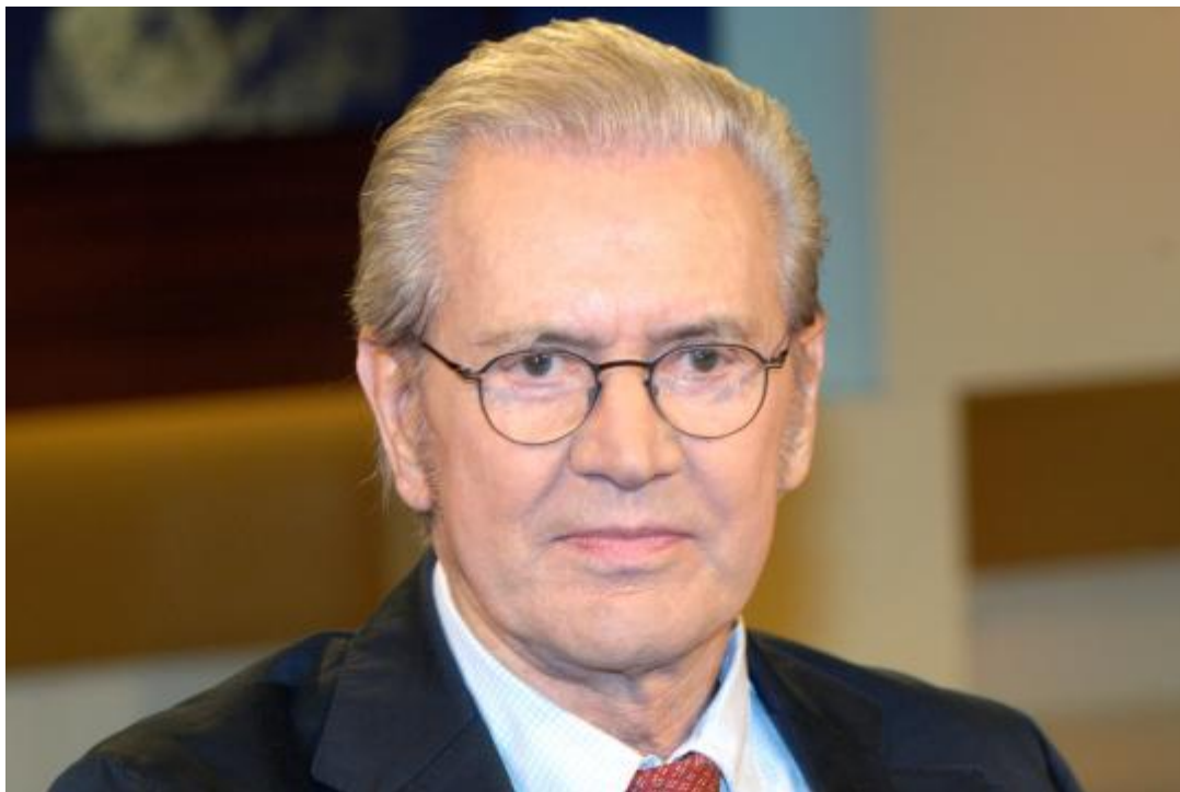
Příloha 1: Jürgen Todenhöfer