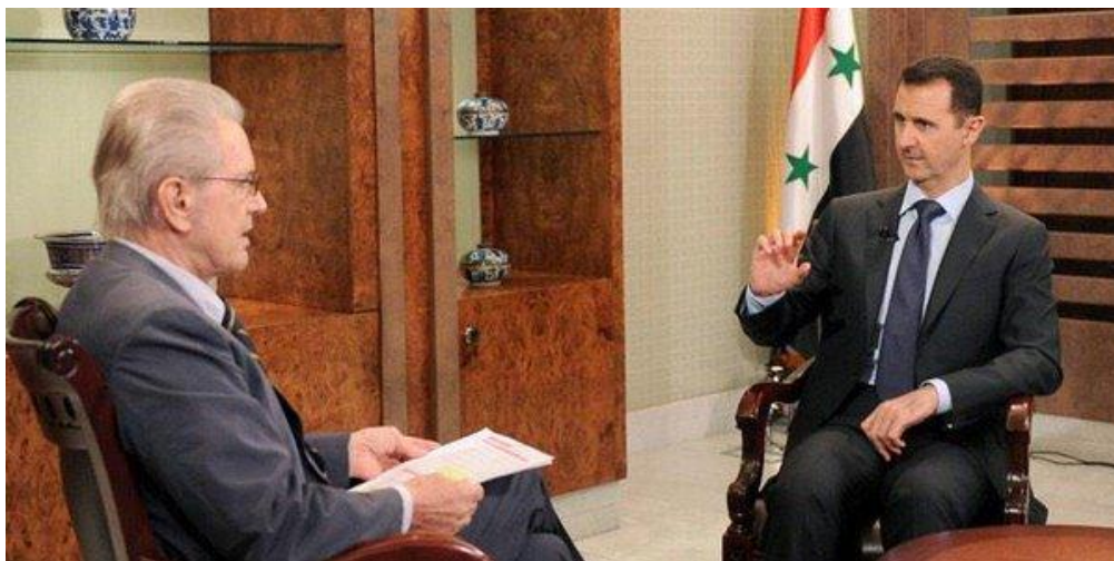
Příloha 3: Todenhöfer dle svých slov vždy zpovídá obě strany konfliktu, na fotce s prezidentem Bašárem Al-Assádem.