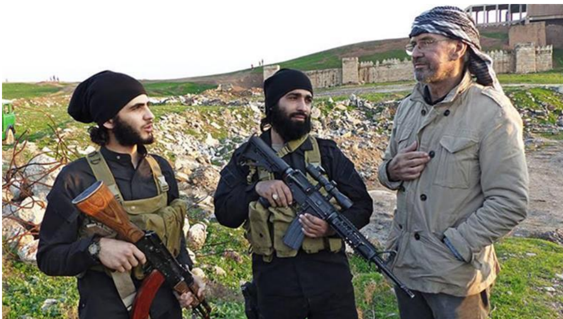
Příloha 2: Novinář získává informace přímo od bojovníků IS