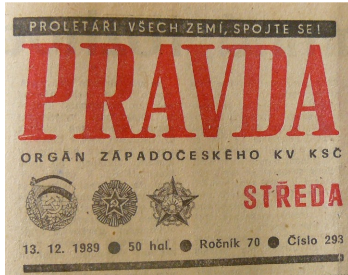
Příloha č. 1: Změny v hlavičce Pravdy na konci roku 1989 v souvislosti se změnami vydavatelů