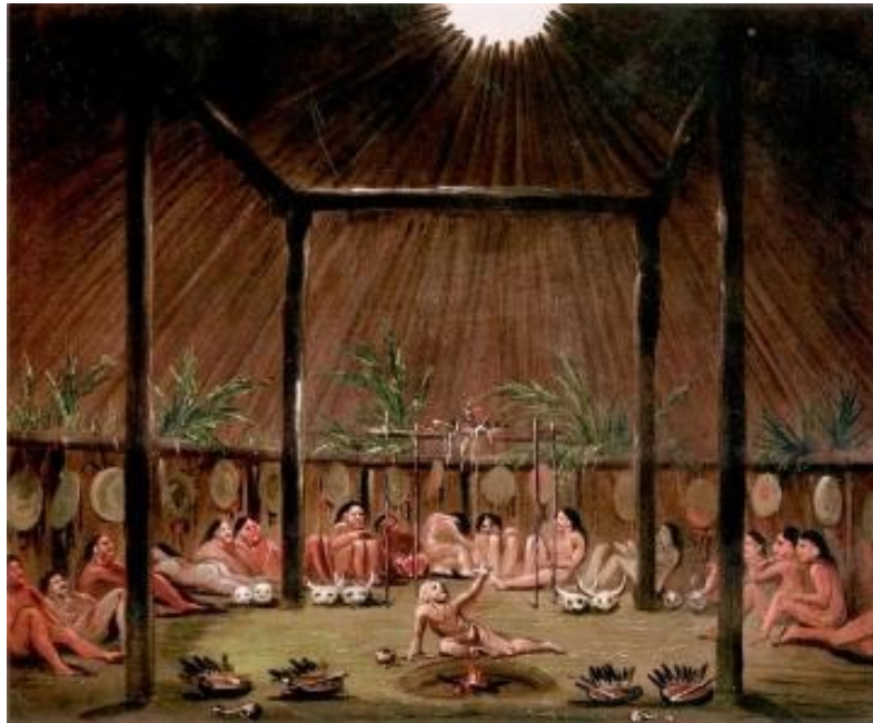
Obřad O kee pa. Autor: George Catlin