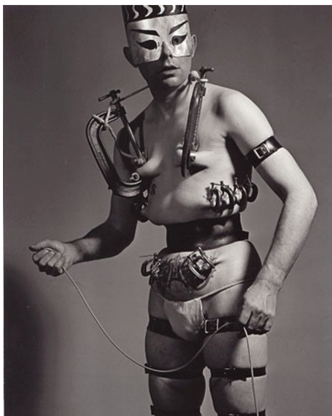
Fakir Musafar a jeho tělesné modifikace.