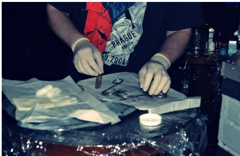
Příprava nástrojů pro zavěšování.