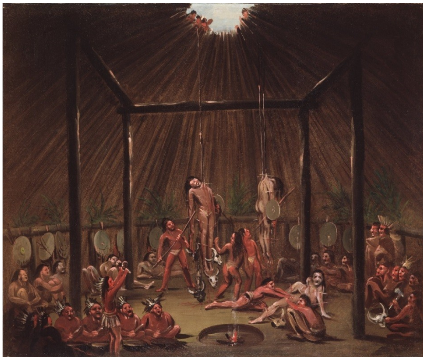
Zavěšování při obřadu. Autor: George Catlin