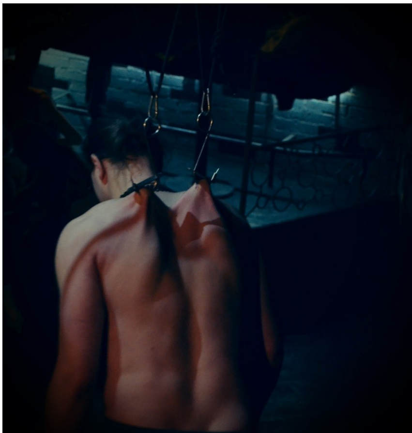
Body suspension.