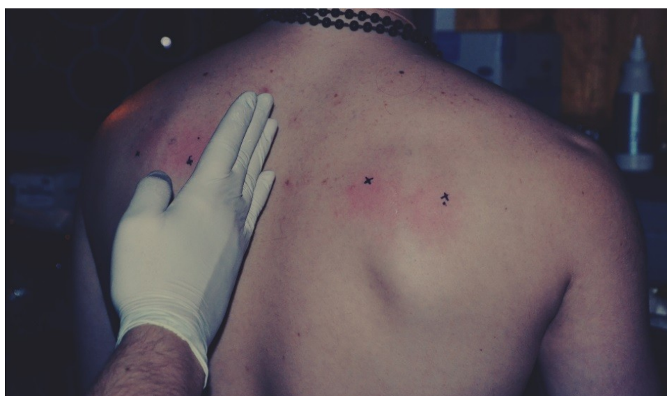
Příprava těla před zavěšením.