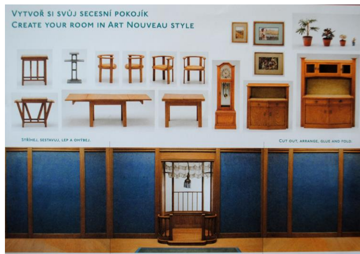
Obr. 2: PRACOVNÍ LIST