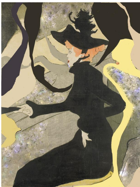
Obr. 5: ŽIVÝ OBRAZ