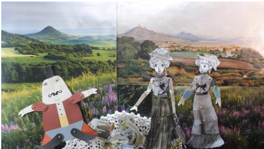
Obr. 3: ANIMOVANÝ FILM – PÍKNIK