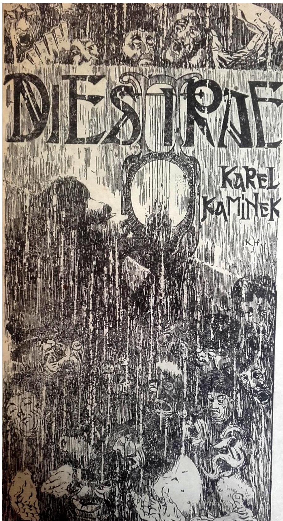
Příloha 2 – titulní stránka sbírky Dies irae zdroj: KAMÍNEK, K.: Dies Irae . Praha, 1896.