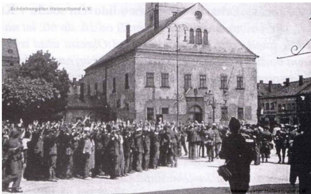
Obrázek 11: Shromáždění Němců na lanškrounském náměstí 272

na každou osobu vycházel prostor asi 2,75 m 2 , což naprosto neodpovídá dobovým fotografiím (viz obrázek 12). Navíc, vzhledem k povaze Hrabáčkovy výpovědi, nelze této informaci přikládat větší význam.