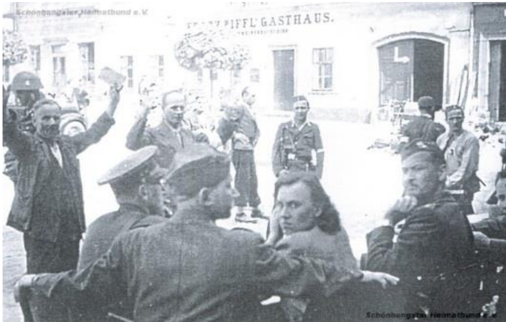
Obrázek 10: Dva Němci před stolem soudců 259

„Vinou násilných živlů, které se vmísily do řad partyzánů, docházelo k násilnostem a přehmatům.“ 260 Střelba zněla ve všech částech města. Němci, kteří se skrývali na půdách a střeších, ostřelovali chodce a české hlídky. Také občanská kázeň i vojenská disciplína se uvolňovala, což se projevovalo zejména zvyšujícím se počtem krádeží a násilností. 261