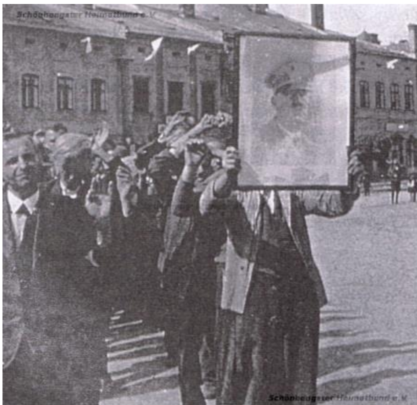
Obrázek 4: První Němec v zástupu musel nést obraz Hitlera 245

Wenig tvrdí, že muži a ženy ve věku od 20 let museli pochodovat ulicemi se zdviženýma rukama a obrazy Hitlera nad hlavou (viz obrázek 5). Ti, kteří omdlávali, byli bití, případně ubiti nebo zastřeleni. Davové šílenství vyvrcholilo s příchodem bývalých nacistických funkcionářů, kteří byli na příkaz Hrabáčka zajištěni. 244