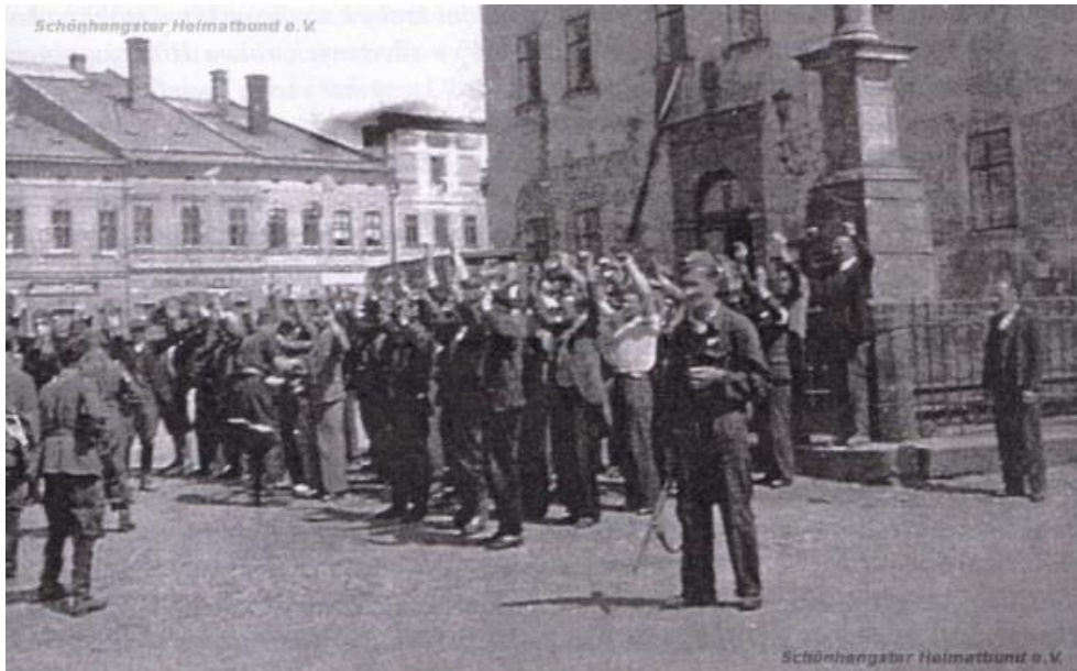
Obrázek 6: Němci držící ruce nad hlavou (před radnicí) 250