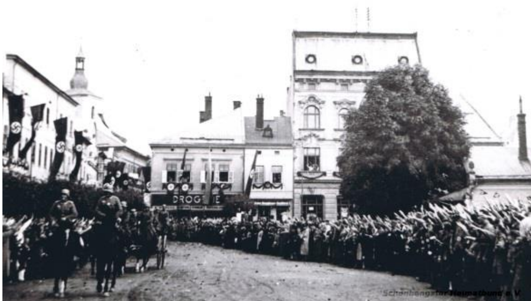
Obrázek 1: Osvobození Lanškrouna Wehrmachtem 10. 10. 1938 190