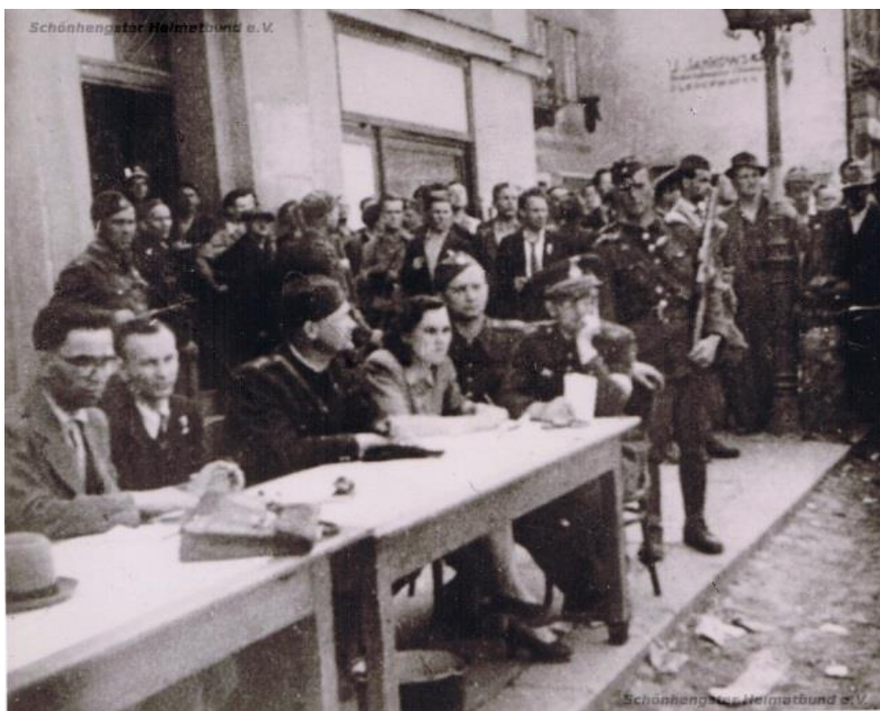
Obrázek 3: Stůl na náměstí před „obecním úřadem“ a za ním sedící soudci 228