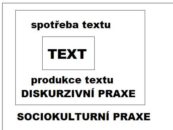
Obrázek 1: Trojdimenzionální model CDA