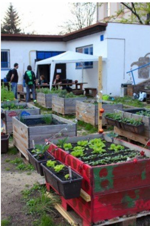
Obrázek 2 Záhony a zázemí zahrady Smetanka

Pozemek zahrady je velký, není zabetonovaný a je obklopený vysokými dřevěnými ploty, které odhlučňují silnici. V nejrušnější části zahrady, v rohu u křižovatky, se nachází malé hřiště se sítí. V protějším rohu je postavené dětské hřiště a kompost. V protilehlé části pozemku stojí zázemí zahrady se sociálním zařízením a kuchyní. Uživatelé zahrady pěstují rostliny nejen ve vlastních dřevěných truhlících, ale je zde také veliký společný záhon pro všechny. Mezi záhonky je uvolněné místo pro lavice se stoly.