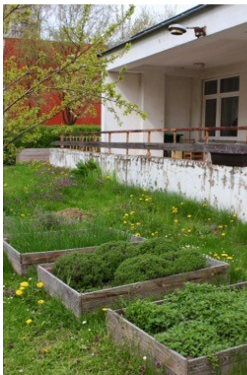
Obrázek 5 Záhony zahrady na pozemku Městského úřadu