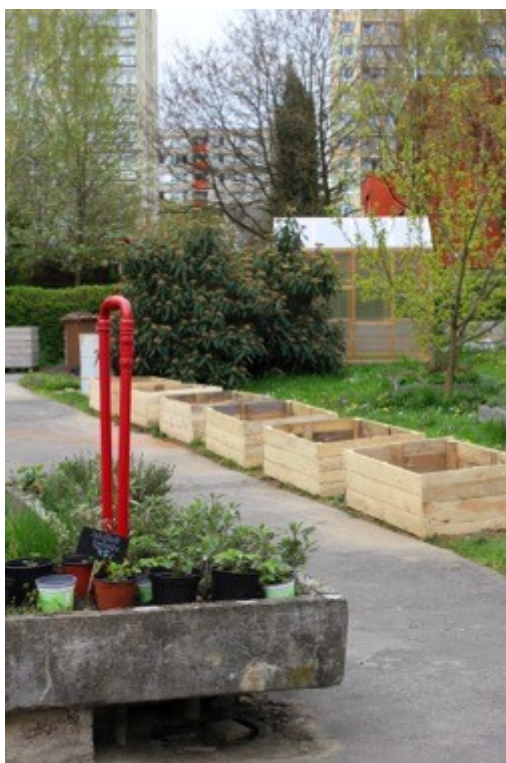
Obrázek 4 Zahrada v kontextu s jejím prostředím

Komunitní zahrada Vidimova se nachází na pozemku Městského úřadu Prahy 11 na Jižním Městě. Rozhovor jsem učinila s její koordinátorkou Kateřinou Procházkovou. Zahrada na první pohled v prostředí nevyniká, je poměrně malá, různorodě členěná a obklopena vysokými panelovými domy. Okolí zahrady je klidné, rostou zde vysoké stromy, není tu slyšet hluk dopravy a vzduch je čistý. Za vraty se příchodová cesta zvedá do kopce a navazuje na vyasfaltovaný prostředek pozemku. Po obvodu a na svahu je plocha zatravněná. Roste tu množství stromů a keřů. Na slunečných místech jsou prozatím prázdné truhlíky. Pro předpěstování sazenic slouží skleník a opodál stojí kompostovací toaleta. Nechybí ani zázemí pro uživatele zahrady. V rohu pozemku u plotu je kompost, který je dobře přístupný i z jeho vnější strany.