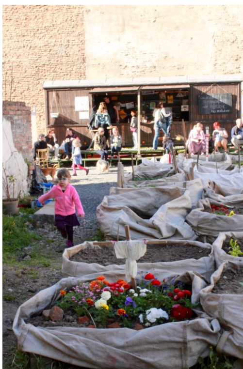
Obrázek 7 Kavárna a bar v maringotce