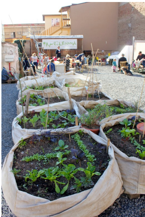
Obrázek 6 Osázené pytle na pěstování

Tato zahrada se nachází v pražské čtvrti Holešovice a využívá pozemek mezi činžovními domy, který je určený pro stavbu budovy. Zahrada je poměrně malá, ze dvou stran obklopená domy a ze zbylých stran plotem z vlnitého plechu. Pytle, ve kterých uživatelé zahrady pěstují svou úrodu, stojí na dřevěných paletách a podloží ze štěrku. Dominantou zahrady je stará dřevěná maringotka, která slouží jako bar a kavárna. K maringotce náleží také posezení složené z rozličných druhů židlí a stolů. U zdi jednoho z domů je nainstalovaný kohoutek s vodou. Vedle vchodu do zahrady stojí dvě mobilní toalety. Za plotem zahrady je slyšet hluk rušné ulice. Slunce na pozemek svítí převážně kolem poledne, protože ráno i večer paprsky zastíní okolní budovy. Rozhovor mi poskytl Filip Volavka, který je dobrovolníkem v Prazelenině.