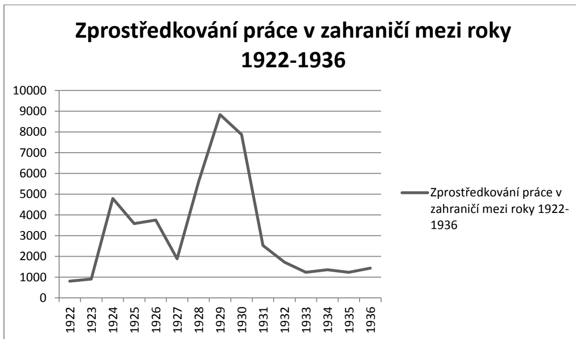
Obrázek 1 84

Na číselném přehledu zprostředkování práce v zahraničí mezi roky 1922-1936 jsou patrná nejvyšší čísla zejména v letech 1928, 1929 a 1930, což lze dát do souvislosti zejména s Velkou hospodářskou krizí. Celkem to bylo 47 525 osob mezi lety 1922 a 1936, které opustili republiku z důvodu práce v zahraničí. Národnostně nejvíce Češi, Rusíni a Němci.