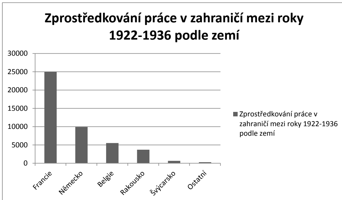
Obrázek 2 85

Na první pohled je vidět, že v roce 1937 největší počet umístění směřoval do Belgie.