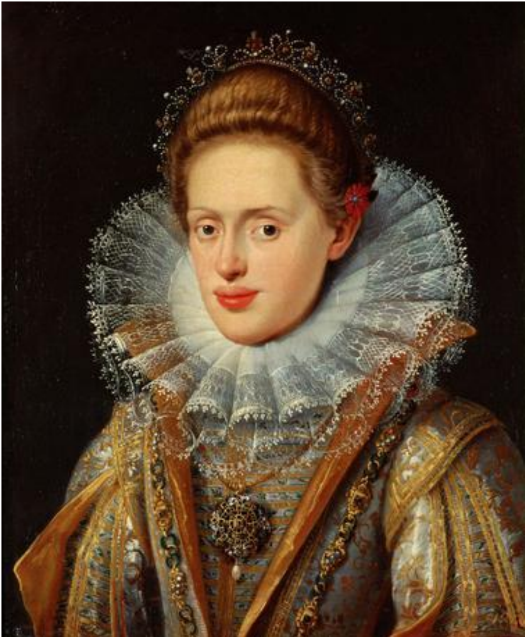
Frans Pourbus mladší, Arcikněžna Anna (1585–1618), manželka císaře Matyáše a dcera Ferdinanda II. Tyrolského, 1603, olej na plátně.