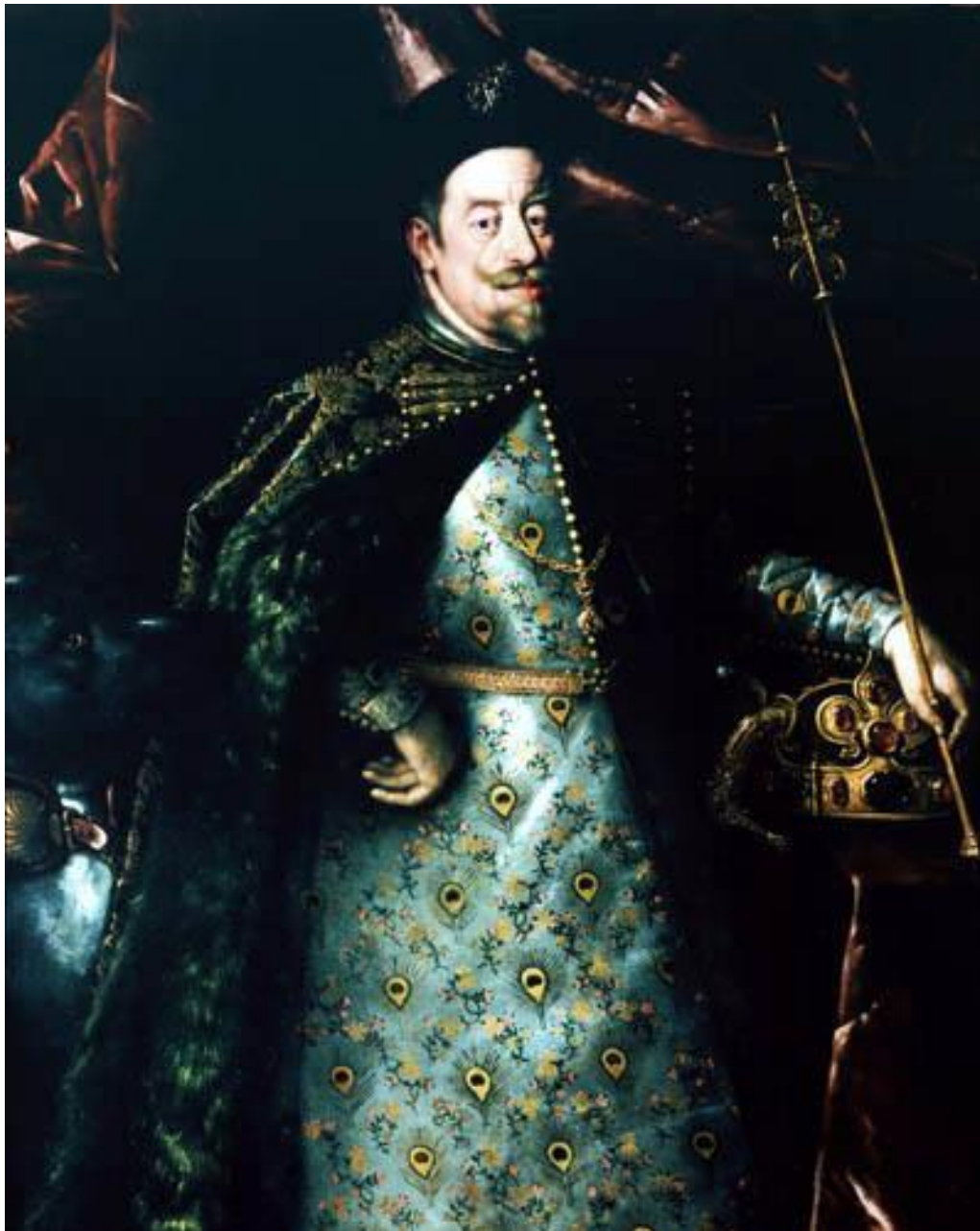
Hans von Aachen, Matyáš, císař Svaté říše římské, 1612, olej na plátně.