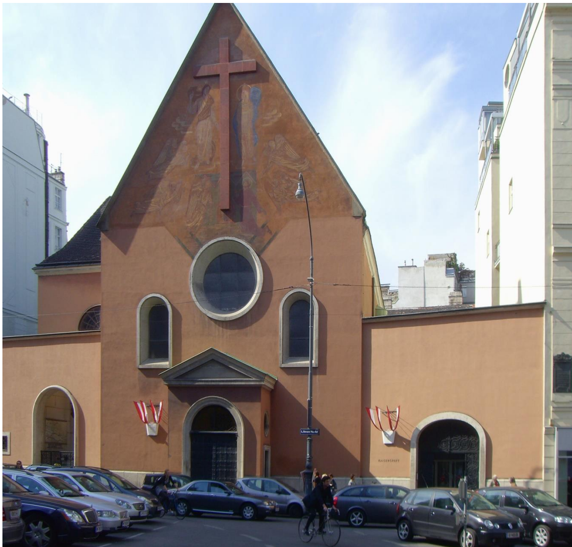
Kapucínská hrobka ve Vídni.