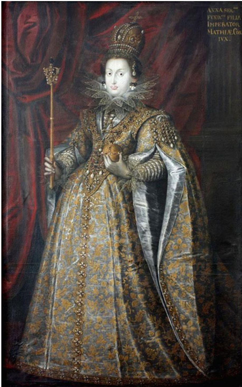
Portrét Anny Tyrolské (1585–1618), 17. století, olej na plátně (převzato z https://commons.wikimedia.org/ ; přistoupeno dne 25. 7. 2016).