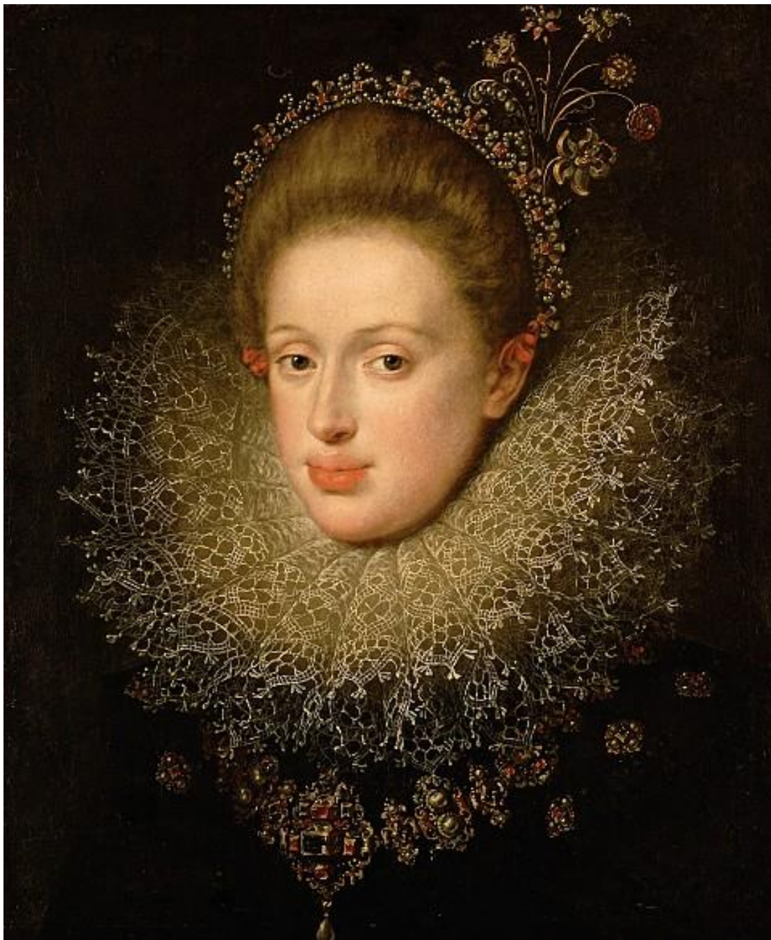
Hans von Aachen, Arcikněžna Anna Tyrolská (1585–1618), dcera Ferdinanda II. Tyrolského, manželka císaře Matyáše, 1604, olej na plátně.