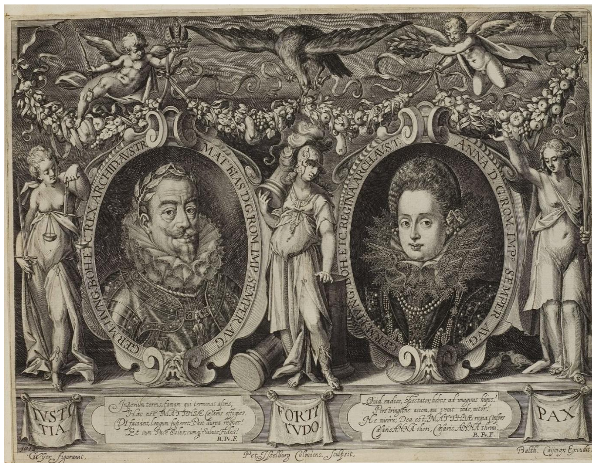
Peter Isselburg, Císař Matyáš a císařovna Anna , 1613, grafika (převzato z https://commons.wikimedia.org/ ; přistoupeno dne 25. 7. 2016).