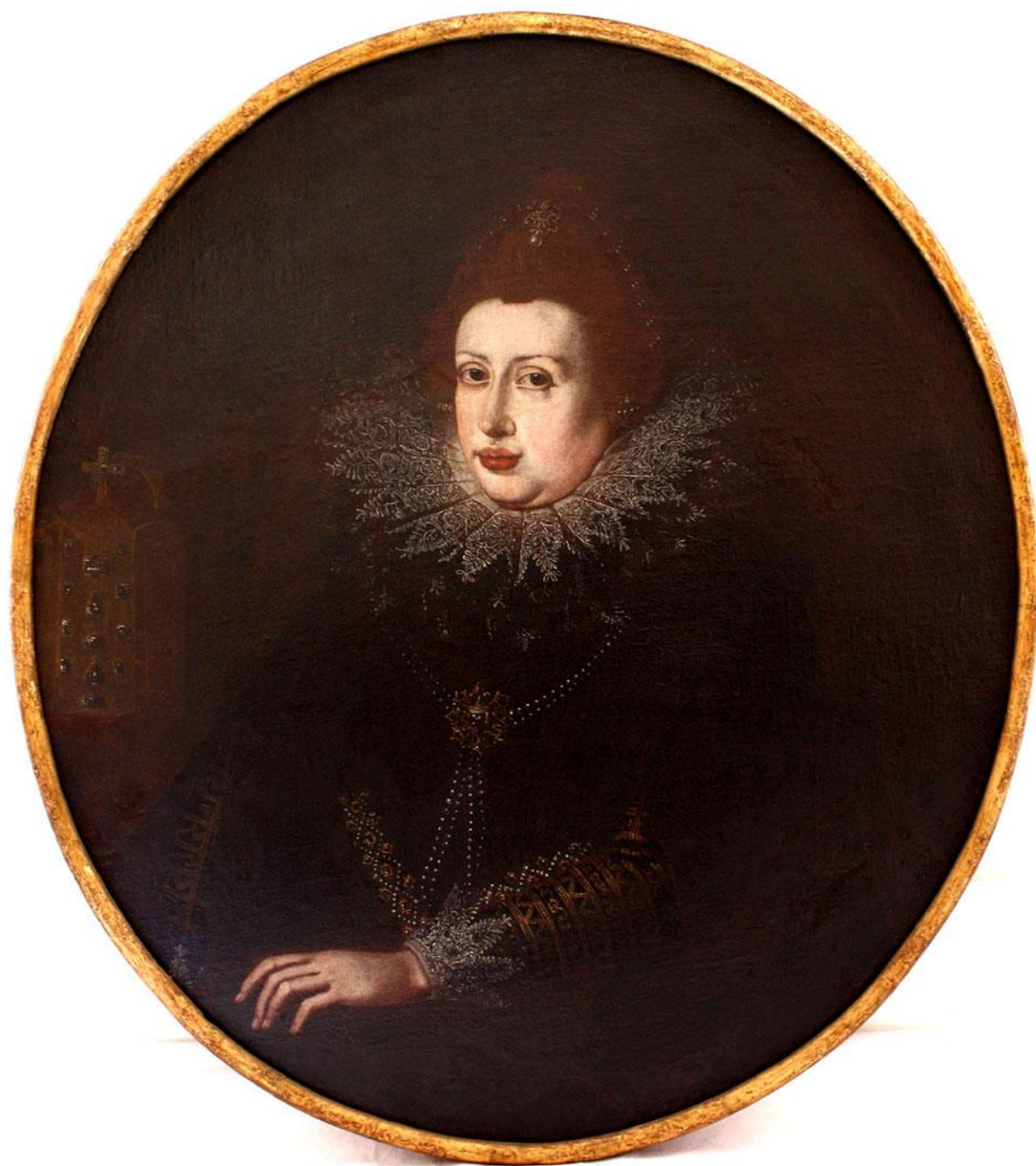
Portrét Anny Tyrolské (1585–1618) v pozdějším věku (převzato z https://commons.wikimedia.org/ ; přistoupeno dne 25. 7. 2016).