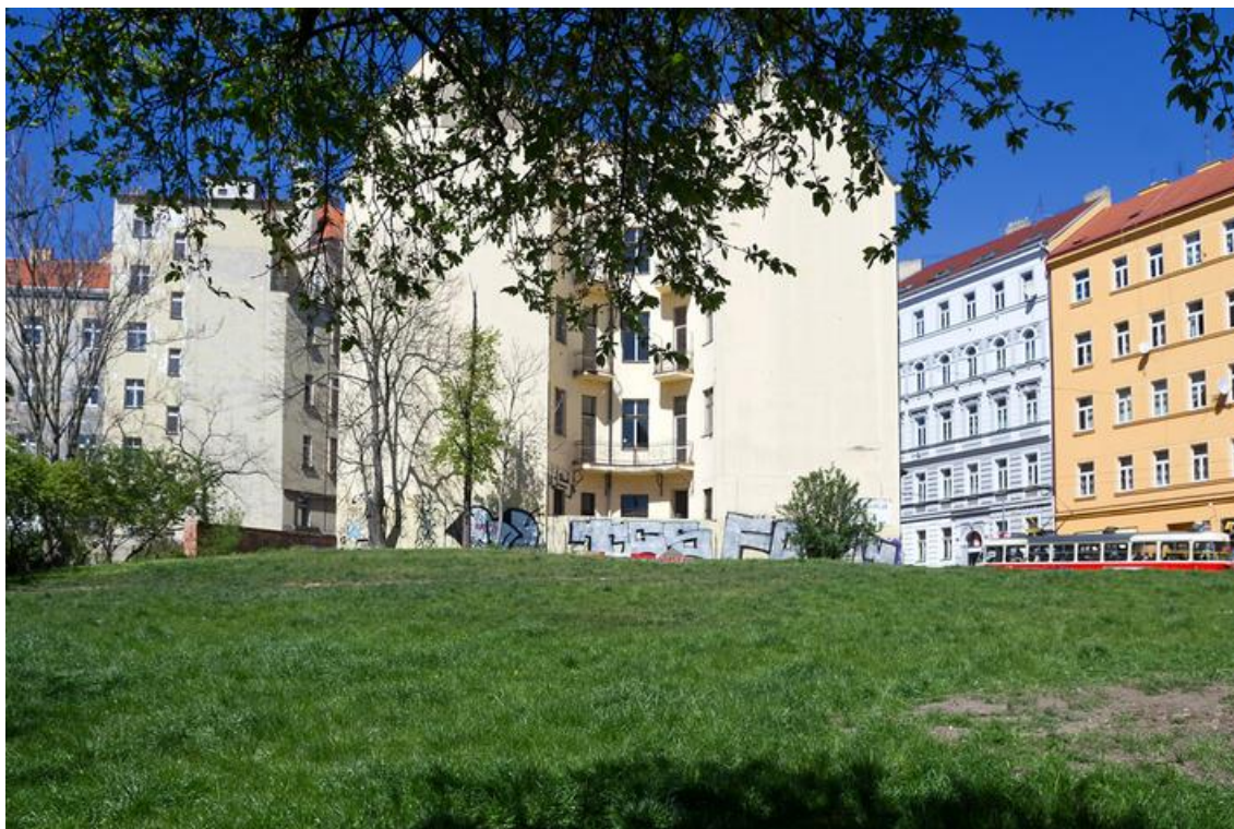
Obrázek 3: Vršovická proluka

Tržiček, které je na křižovatce ulic Krymská a Kodaňská.