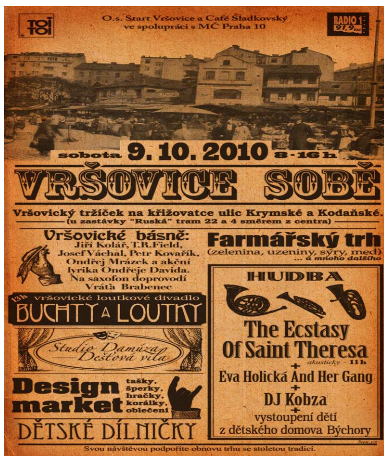
Obrázek 3-Plakát slavnosti Vršovice sobě