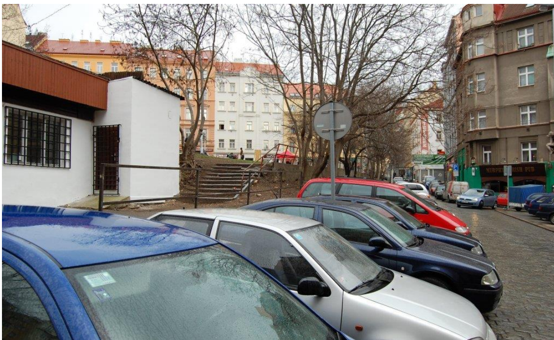
Obrázek 5: Tržiček dnes

Proluka je jedním z posledních zbytků nezastavěného prostranství, v jinak husté zástavbě nacházející se ve staré části Vršovic. V současné době plní Proluka funkci veřejného prostoru. Slouží jako místo setkávání vršovických obyvatel. Konají se tu sousedské akce, slavnosti, divadelní představení a funguje zde i Galerie pod širým nebem. V posledních letech se aktivně jedná o tom, jak s volným prostorem naložit. Již od roku 2010 probíhají jednání, při kterých stojí proti městu občanské sdružení START Vršovice, které reprezentuje zájmy místní občanské komunity. Ta stojí o to, podílet se na osudu místa, které po desetiletí dávalo jejich sousedství tvář a má pro ně tradiční hodnotu.