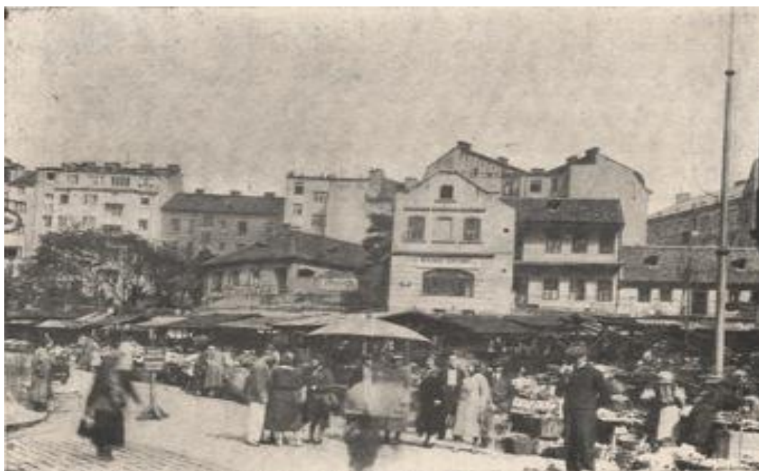
Obrázek 4: Vršovický Tržiček