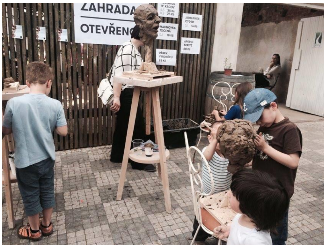
Obrázek 9 Sochání na Korsu

Situace je organizačně do budoucna poměrně nejistá. Martina mi vysvětlila, že kvůli organizování Korsu se nemohla téměř dva měsíce věnovat své vlastní práci. „Musíme mít lidi na dílčí úkoly, klidně ať se to sbíhá u mě, ale celý je to pro jednoho člověka už naprosto nezvládnutelný.“ Akce se každým rokem rozrůstá a objevují se nové provozní požadavky. Pro nezaplatěnou akci, která je samofinancovaná, je to skutečně velké sousto.