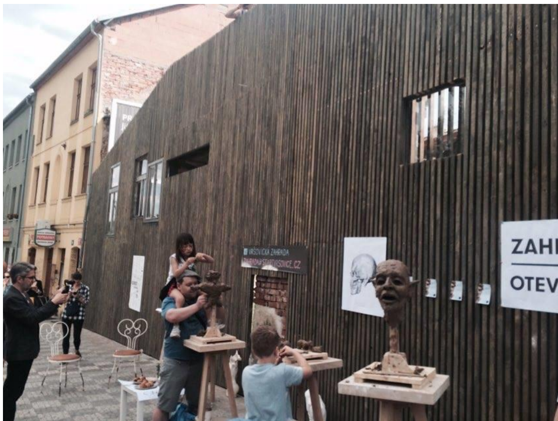
Obrázek 6: Plot Jana Fabiána

respektuje historii a celkovou podobu okolí. Zvenčí tedy plot připomíná starý dům bez střechy.