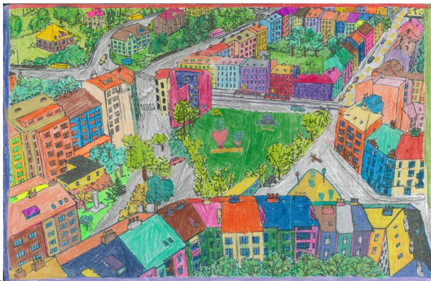
Obrázek 4: Návrh respondenta

Ihned po vydání této tiskové zprávy začali aktivní občané vytvářet návrhy. Přímou v Procluce a v okolních kavárnách a zařízeních byly k dispozici stojany, ve kterých byly letáčky, tužky, pastelky a schránka, kam se návrhy vhažovaly. V komunikačním kreativním centru Družina, které sídlí na Krymské ulici, potom proběhla výstava návrhů všech, kdo se ankety zúčastnili. Návrhy byly vpracovávány do omalovánky, které byly součástí anketního letáku.