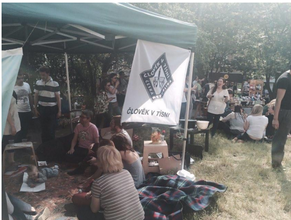
Obrázek 8 Člověk v tísní na Proluce