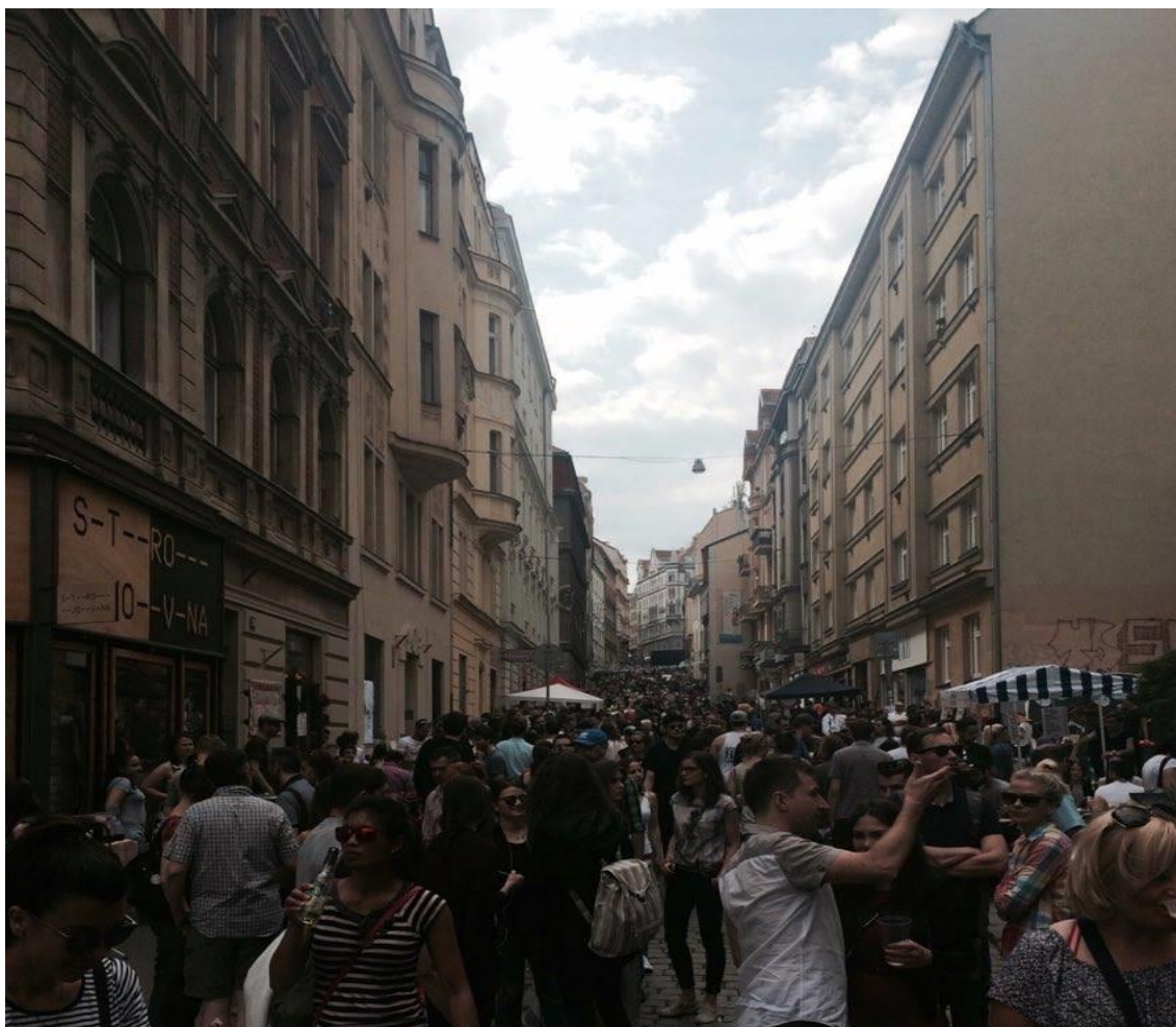
Obrázek 10 Krymská v den Korsa