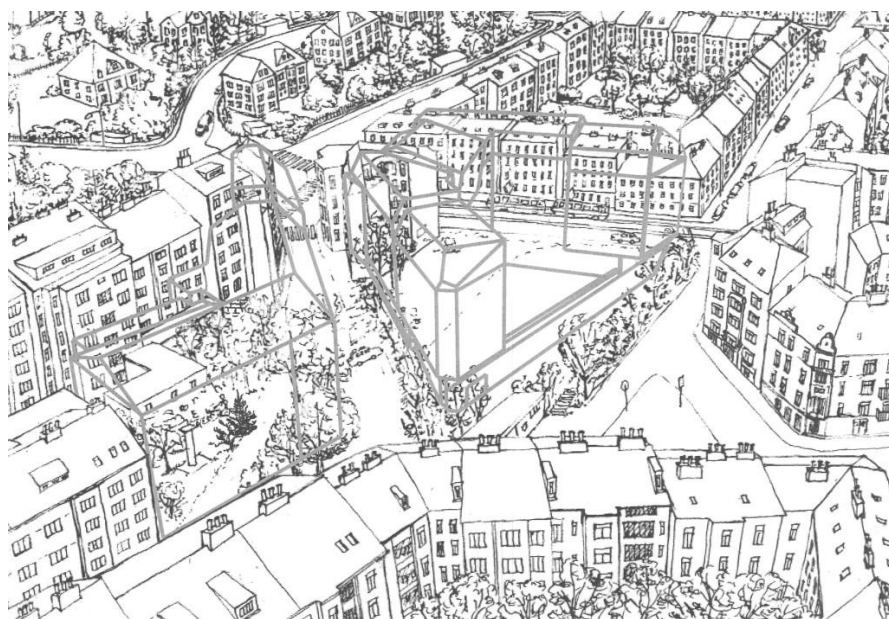
Obrázek 8: Návrh investora