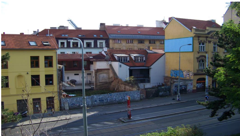
Obrázek 5: Proluka na Francouzské ulici

Na Francouzské ulici, přímo na tramvajové zastávce Krymská, zelo několik let prázdnou zbořeniště po dvou domcích.