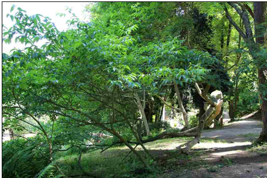
„Strom hrdina“ – Korkovník amurský, symbol BBZ