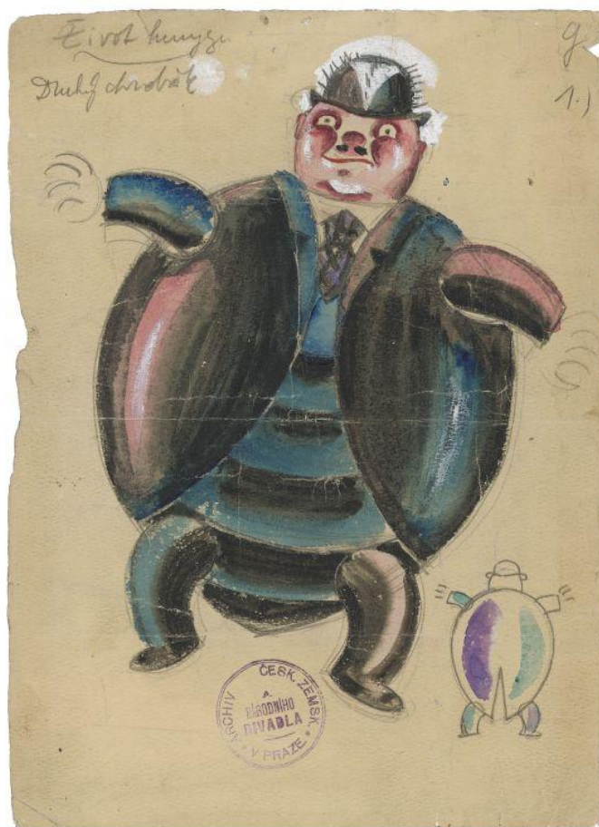
Obrázek 5 – Ze života hmyzu, Josef Čapek – skica kostýmu (Jiný chrobák), 1922