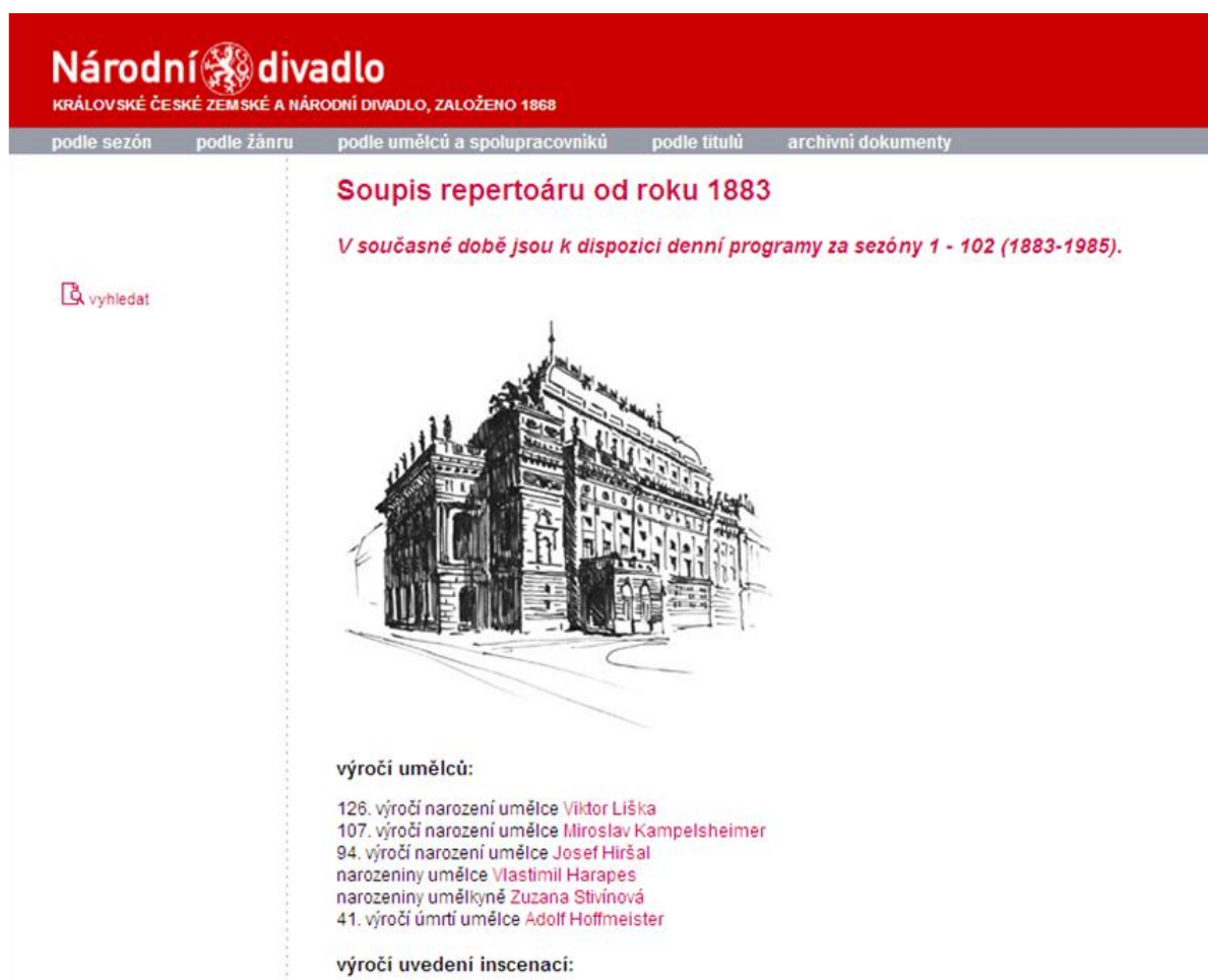
Obrázek 10 – Úvodní strana archivního webu

Úvodní stránka 75 potvrzuje obsah soupisu repertoáru od roku 1883 včetně denních programů za 102 sezon, tj. do roku 1985 (viz obr. 10).