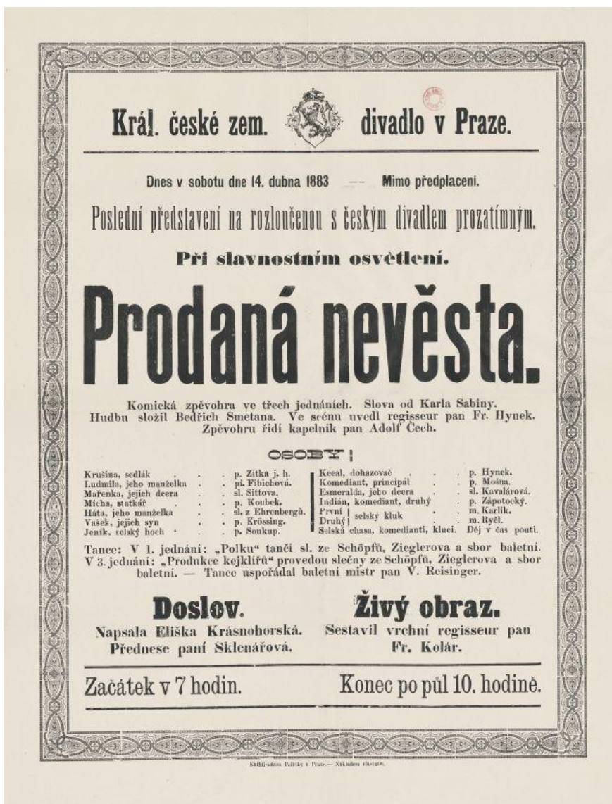
Obrázek 8 – Divadelní cedule z roku 1883, Prodáná nevěsta