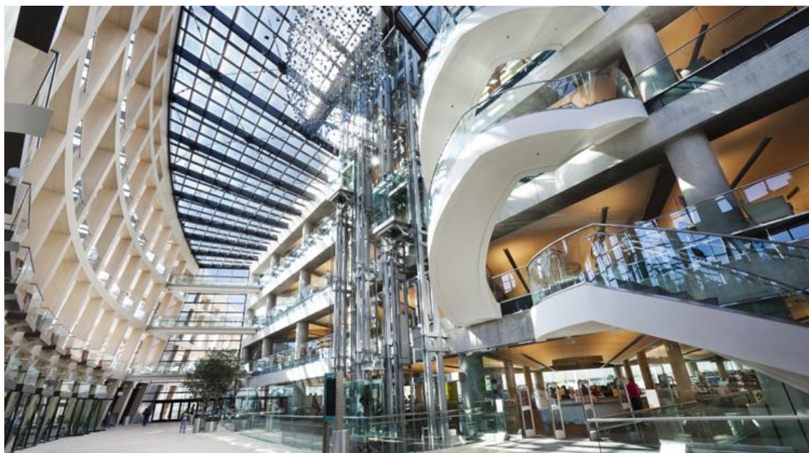
Příloha 5: Budova Veřejné knihovny v Salt Lake City a logo jedné z pořádaných akcí