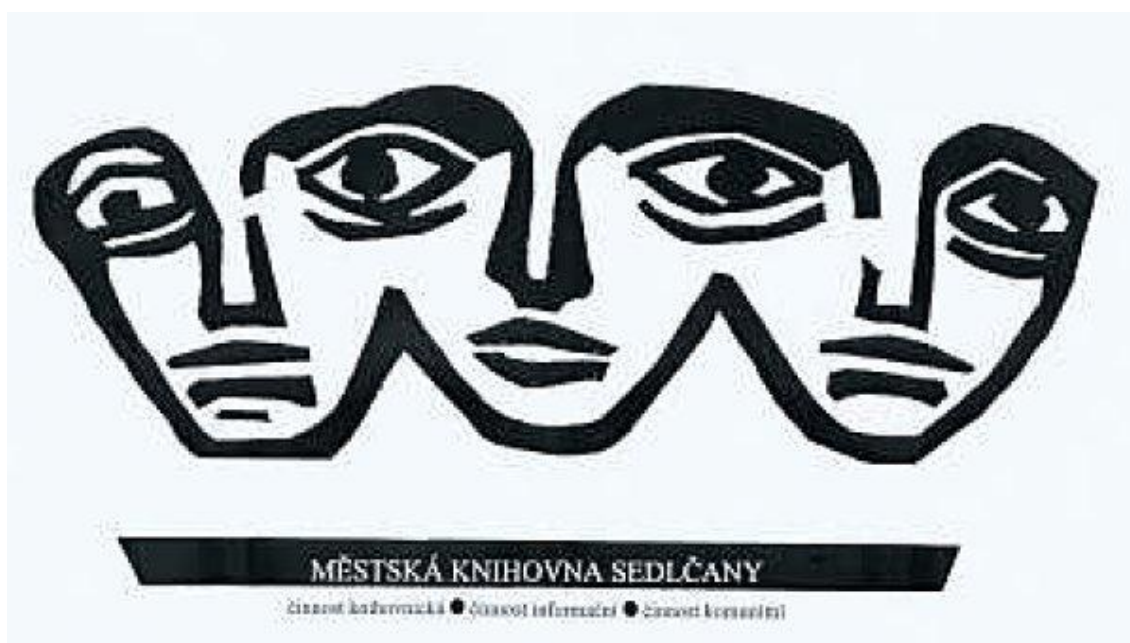
Příloha 3: Logo Městské knihovny v Sedlčanech