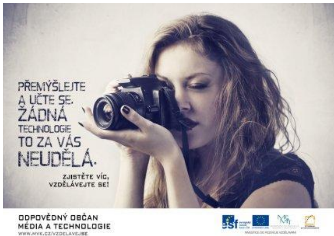
Příloha 4: Plakát kampaně projektu Komunitní knihovna ve Vsetíně jako centrum dalšího vzdělávání