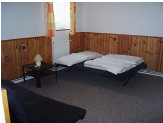
Karavany SDK Areál