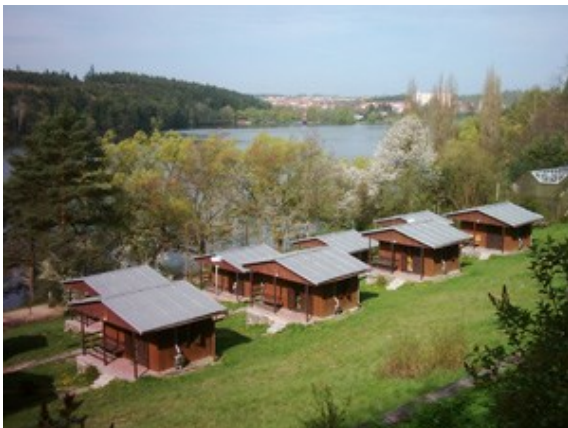
Internát SPŠ Jedovnice