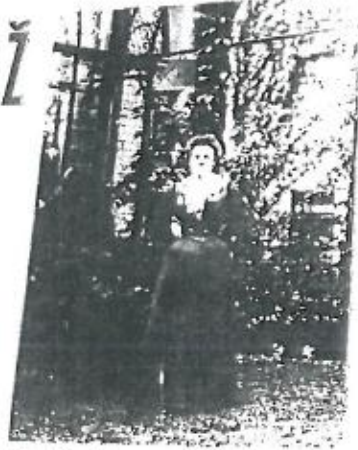
Snímek Kláry Zetkinové ve Švicarsku z roku 1897