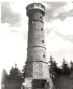
Obr. 6 – Rozhledna Svatobor