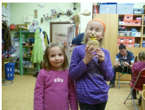
Obr. 18 – Velikonoční zajíci z pedigu