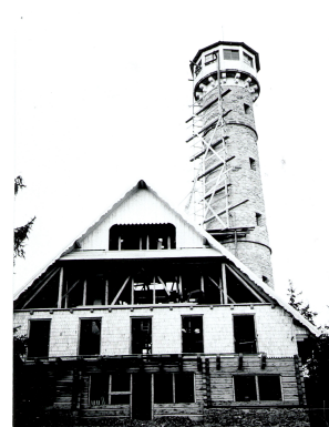
Obr. 5 – Rozhledna Svatobor