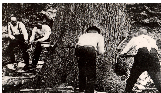
Obr. 11 – Práce v lese