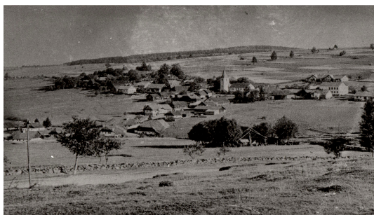
Obr. 10 – Zaniklá obec Zhůří