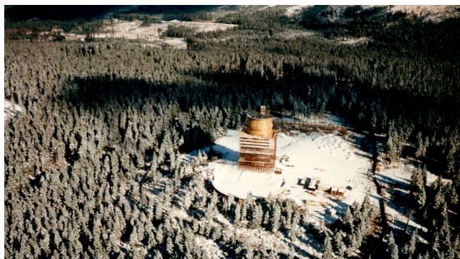
Obr. 7 – Rozhledna Poledník