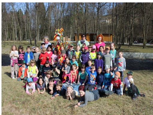
Obr. 19 – Loučení s Moranou