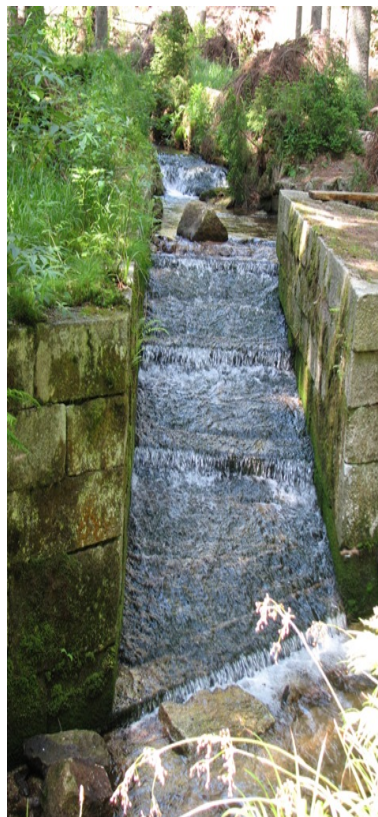
Obr. 14 – Schwarzenberský kanál