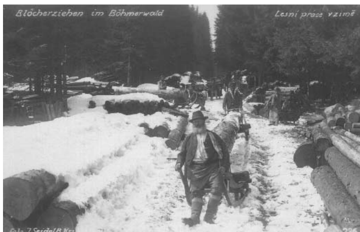
Obr. 2 – Svoz dřeva

kůrovcovou kalamitou. Bylo třeba dostat ze Šumavy v krátkém čase velké množství dřeva. To se povedlo rychle odplavovat právě zdejším plavebním kanálům. 38