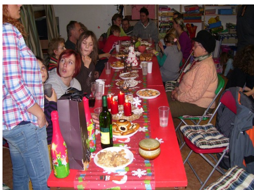
Obr. 17 – Vánoční posezení