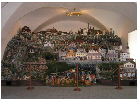
Obr. 13 – Mechanický betlém