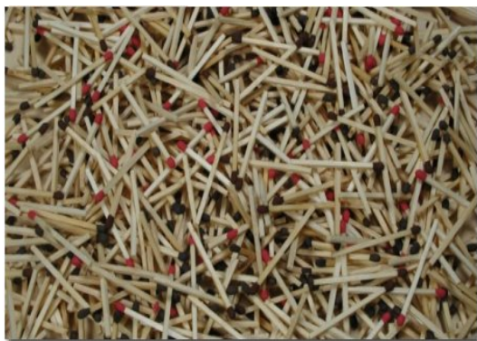
Obr. 12 – Sirky ze Sušice