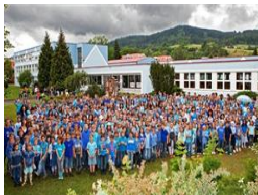
Obr. 20 – Základní škola Sušice, Lerchova ulice