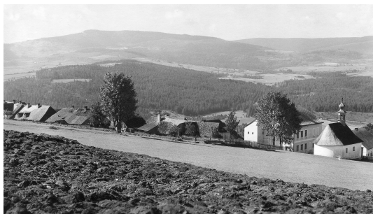
Obr. 8 – Zaniklá obec Stodůlky