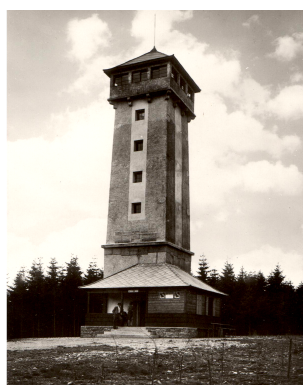
Obr. 4 – Rozhledna Javorník