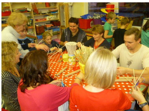
Obr. 15 – Pletení košíků