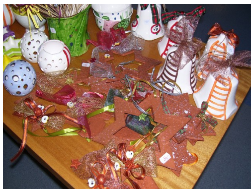
Obr. 16 – Vánoční jarmark