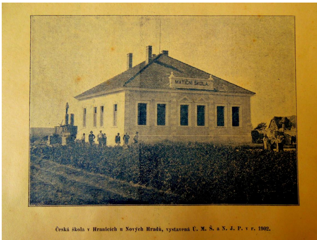
Obr. č. 1, škola v Hranicích u Nových hradů