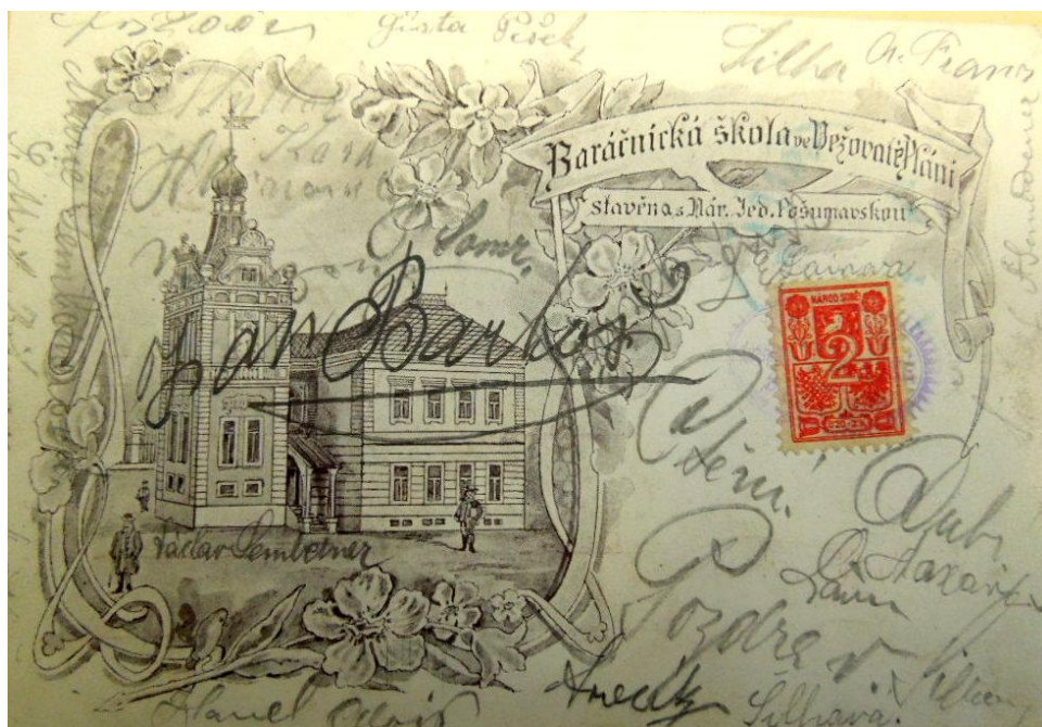
Obr. č. 2, škola v Pláni Věžovaté, zdroj: NA, fond: ÚMŠ, kart. č. 413.