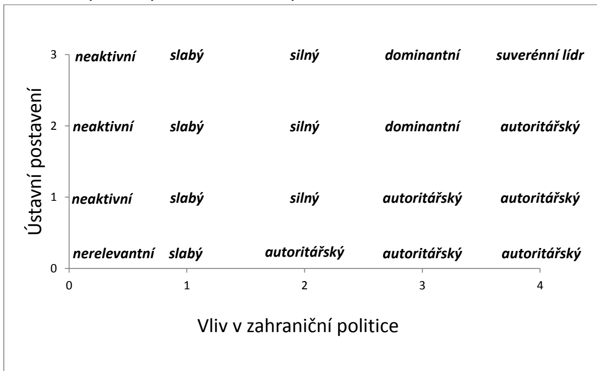
Graf 1: Možná postavení prezidenta v zahraniční politice

Na základě tohoto modelu bude také možné sledovat, jak se měnilo postavení finského prezidenta v čase, respektive do jaké kategorie jednotliví prezidenti svým jednáním spadali. V čase bude také možné pozorovat korelaci mezi ústavním postavením prezidenta a jeho reálným působením v zahraniční politice, ačkoliv tento výzkum není primárním cílem této práce. Kromě toho nabízí práce také možnost srovnání vývoje pravomocí v zahraniční politice s vývojem celkového postavení prezidenta. Ten patřil podle ústavní definice k silným aktérům a Finsko tak platilo za nejdéle fungující 5 a také nejstarší poloprezidentský systém. 6