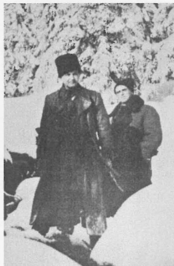
B. Laušman s R. Slánským na Slovensku v zimě 1944-1945