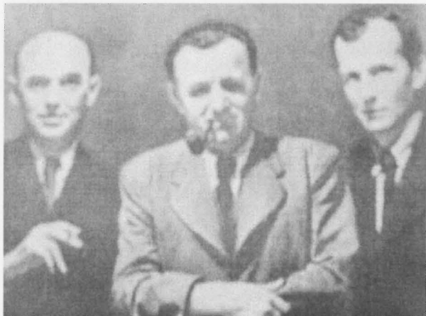
Václav Kopecký, Klement Gottwald a Jan Šverma v roce 1941