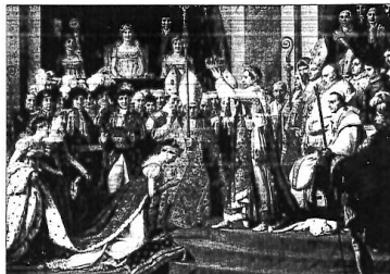
Koronovace Napoleona císařem

Napoleon Bonaparte slavil v čele francouzské armády úspěchy ve válkách proti evropským státům. Jeho moc rostla. V roce 1804 se nechal korunovat císařem Francie jako Napoleon I.