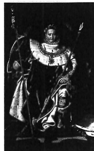
Napoleon na svém císařském trůně

IX Kterí osvícenští panovníci z rodu Habsburků zaváděli v 18. století v Čechách a na Moravě (podobně jako Napoleon) reformy, které prospívaly zemi?