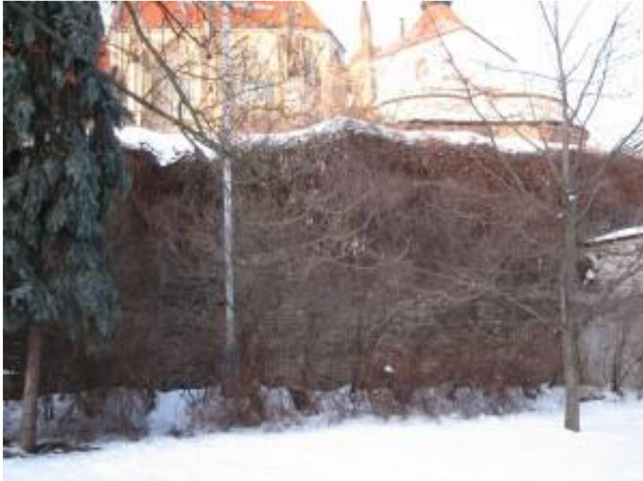
Obrázek 4 Hradby pod chrámem