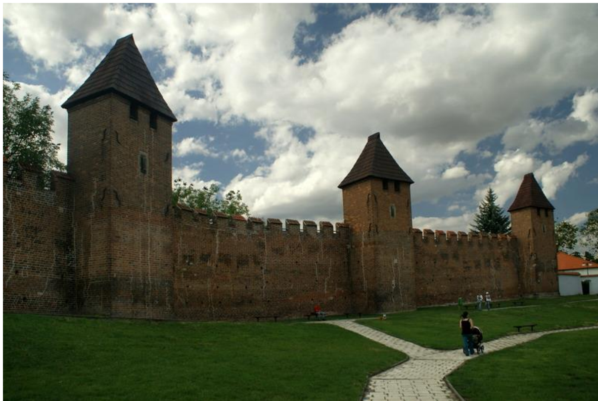
Obrázek 6 Nymburk cihlová hradba

Nymburk je od Kolína vzdálen podobně jako Čáslav, jen se nalézá níže po proudu řeky Labe. V této souvislosti je třeba zmínit listinu, kterou Jan Lucemburský přikázal Nymburku dokončit městské opevnění. Královská listina z roku 1335, v níž panovník ukládá Nymburským, aby během dvou let postavili a zcela dokončili „... ex toto perficere ac complete .“ městskou zeď od brány mostu přes Labe ke klášteru dominikánů „... a porta pontis per Albeam usque ad claustrum fratrum Predicatorum ...“ 40 . Brána uváděná v listině je ztotožňována s fortou, situovanou jižně od městského kostela, která byla patrně průjezdní věží podobnou ostatním městským branám.