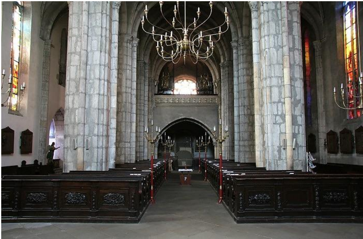
Obrázek 8 Interiér chrámu

Chrám byl vysvěcen 18. 10. 1378, jenže ještě v téže roce umírá jeho patron Karel IV., což je jedna z možných příčin, proč byla stavba přerušena a Parlěrovy plány na přestavbu celého chrámu nebyly již nikdy realizovány. Dvě věže na západní straně chrámu byly vystaveny již v 1. pol. 14. století, ale až od r. 1442 v jižní věži visel monumentální zvon Vůžan, zdobený zlatem a stříbrem. Na severní věži byly umístěny hodiny a další menší zvony, obě věže byly spojeny. Zvláštností věží je to, že ve spodní části jsou stavěny do čtyřhranu a teprve ve výšce chrámové klenby přecházejí do osmihranu. Zvoněním však věže velmi trpěly, začaly se objevovat rozsáhlé trhliny ve zdech, proto r. 1504 staví mistr Bartoš při chrámu novou mohutnou zvonici. Čtyřboká mohutná věž z roku 1504, uvnitř z lámaného kamene, zevně z tesaného, čtvercového půdorysu (rozměry 9 x 9 m), na jižní straně do ní vstupuje prostý vchod o několik stupňů výše než okolní terén, s kamenným obložení a s výplněmi v horních koutech. Zdi jsou v přízemí 2 m široké, v každém patře se pak o 10 cm zeslabují. V prvním a druhém patře jsou na jižní a severní straně nevelká obdélná okénka, ve třetím patře pak široká, lomeným obloukem zakončená okna. 46