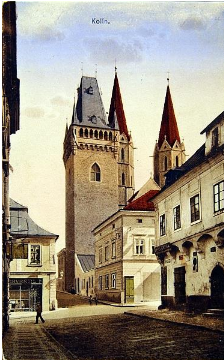
Obrázek 9 Zvonice mistra Bartoše