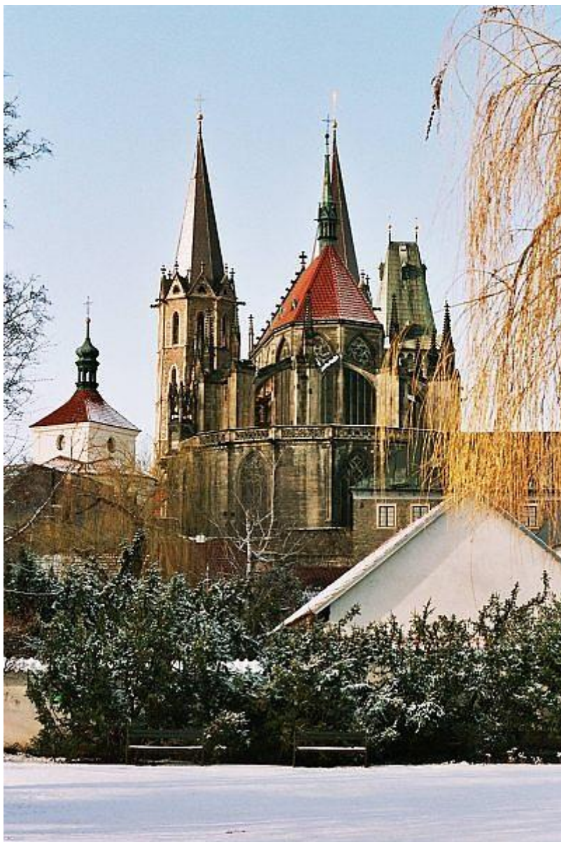
Obrázek 7 Pohled na chor Petra Parléře

Stavba stojí na skalnatém návrší, v nejvyšším bodě středověkého města, v jihovýchodním ohybu městského opevnění. Dokladem dřívějšího osídlení této lokality již od střední doby hradištní jsou nálezy keramiky. Chrám byl vystavěn na starší románské sakrální stavbě, na jejíž dispozici byl vystavěn raně gotický presbytář, jehož původní podoba se nezachovala. Z tohoto období se však zachovalo raně gotické síňové trojlodí, které bylo nejspíš budováno ve dvou etapách. První začala těsně po roce 1260 a realizuje ji stavební huť s hesensko-westfálskými vlivy. V této době bylo vystavěno obvodové zdivo s úzkými okny a štíhlými svazkovými příporami, ukončenými kalichovými hlavicemi s rostlinným dekorem. Z