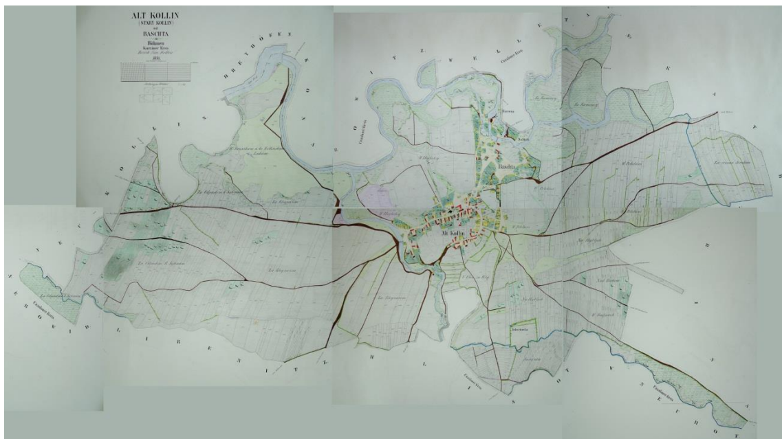
Obrázek 3 Říční situace Starý Kolín

Obec Kolín (myšleno Starý Kolín) se nacházela v blízkosti hned několika vodních toků. Přímo ve vsi protékal potok Klejnar (Klejnarka), nedaleko od obce byla Černá Strouha a v neposlední řadě pochopitelně řeka Labe. Z tohoto důvodu se obec Starý Kolín nacházela na území, které bylo často zaplavováno, a pro rozšíření do podoby města se jevila zcela nevhodnou.