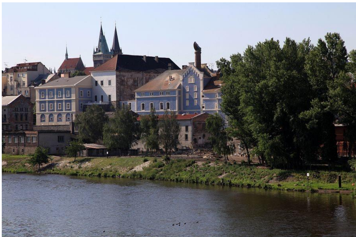
Obrázek 10 Kolínská hrad