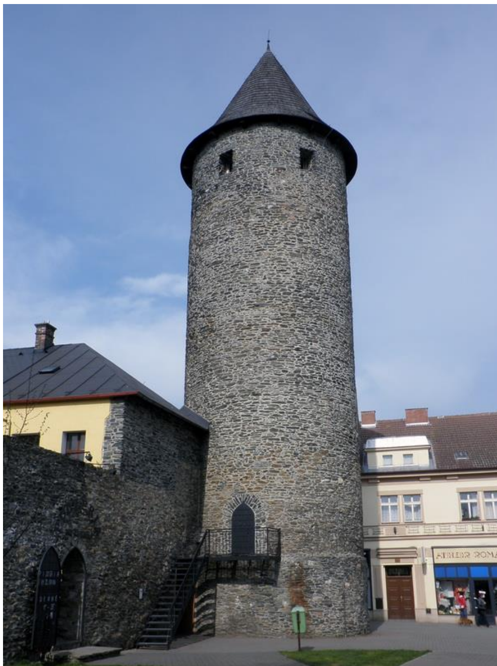
Obrázek 5 Otakarova věž

Cenným zjištěním je v Čáslavi to, že parkánová zeď byla vystavěna současně s hlavní hradbou. Vyplývá to z naprosto stejné materiálové skladby obou zdí i techniky jejich výstavby. K relativní chronologii přispívají zde i polygonální husitské parkánové bašty, které jsou do původní hradby vloženy, což dokládá i jejich zvýšení o nadezdívku se štěrbinovými střílnami.