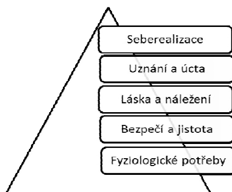
Obr. č. 1 Pyramida potřeb (Nakonečný, 1998)