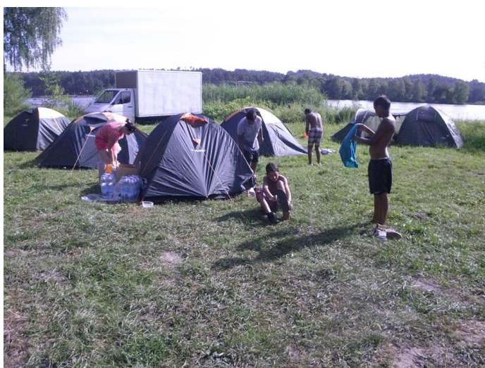
Stanování – Branžež