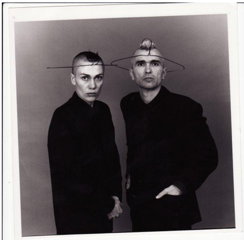
S Kristou Ceres v Torontu na začátku 90. let