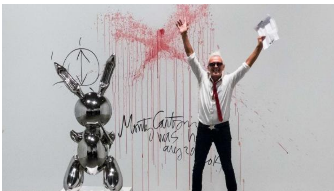
Krvavé X za jednou z nejznámějších soch Jeffa Koonse ( Rabbit , 1986) ve Whitney Museum v New Yorku 21. srpna 2014