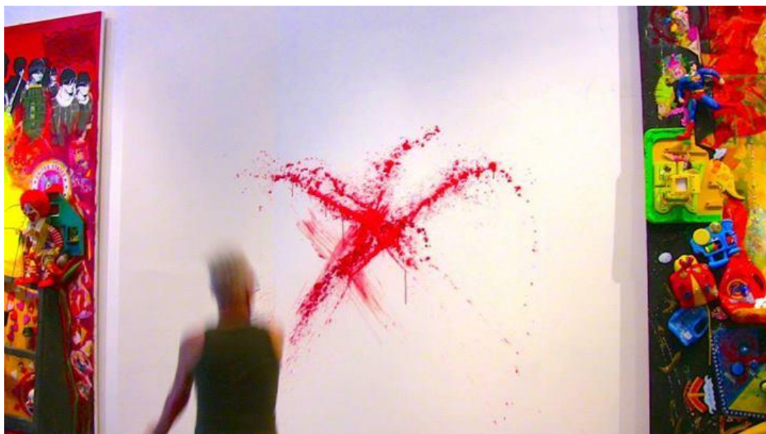
Fotografie z prvního krvavého X na vyžádání na pozvání na výstavu 100%Crap Exhibition v New Yorku 3. května 2014