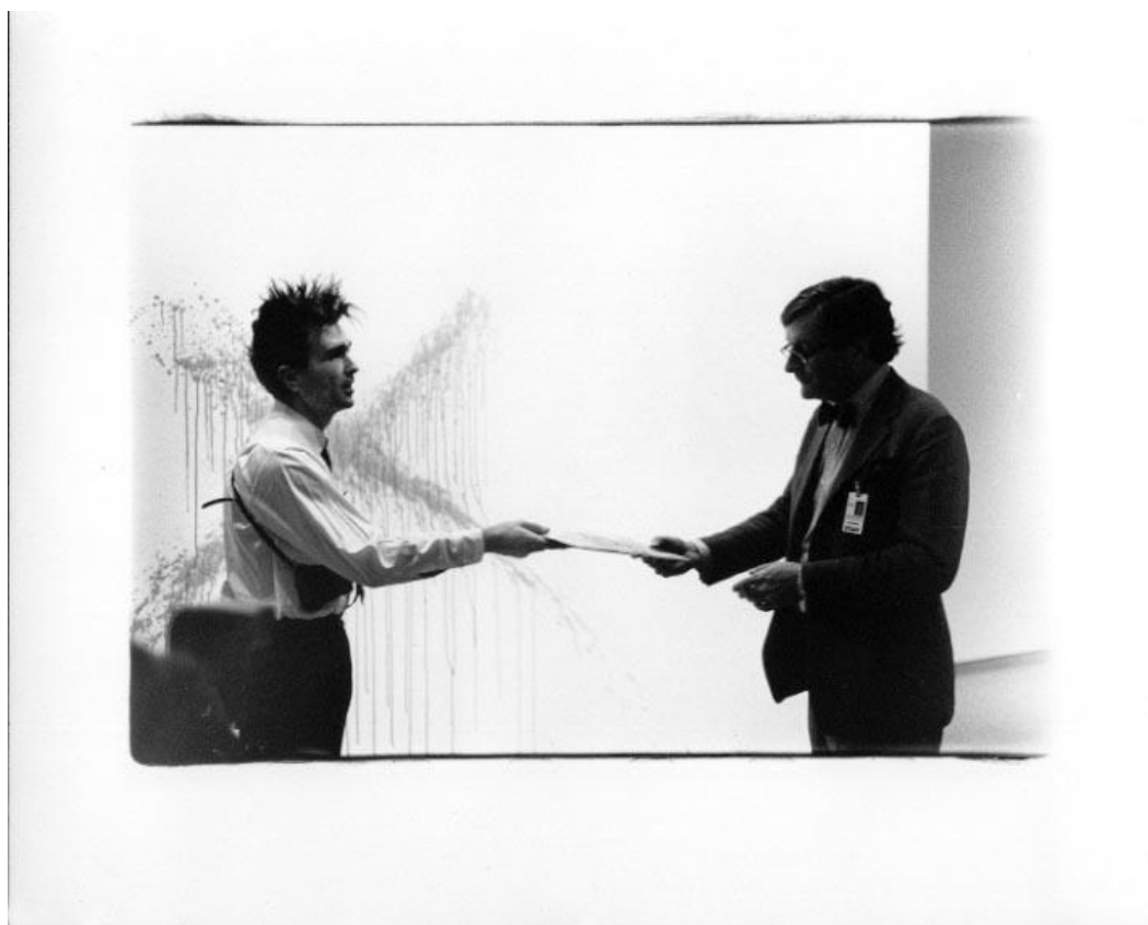
Předávání darovací listiny v Art Gallery v Ontariu v roce 1989