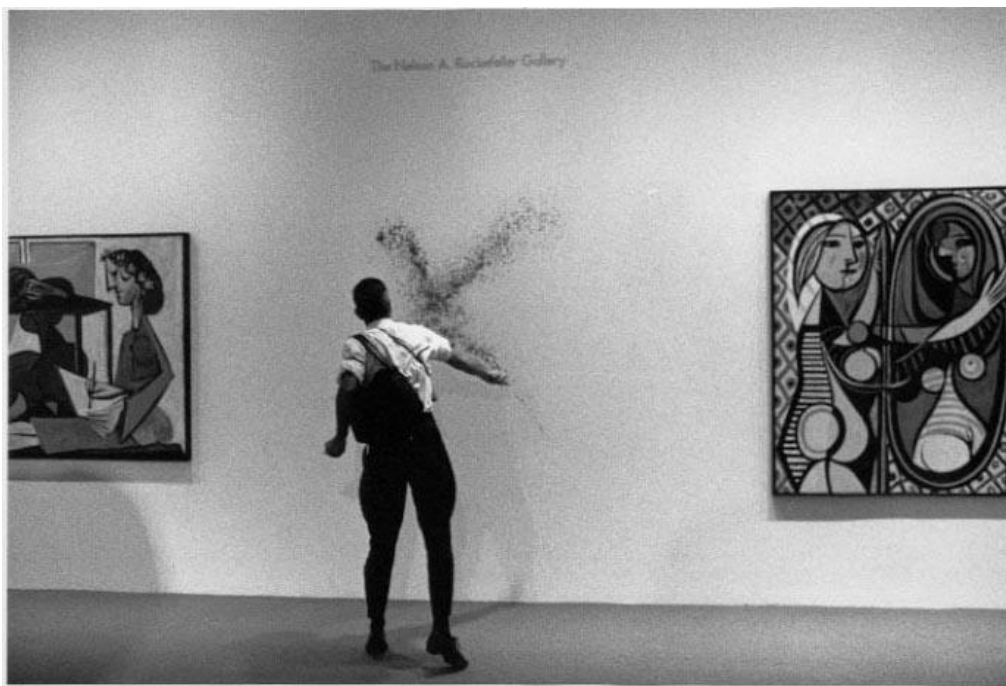
Krvavý dar v Museum of Modern Art v New Yorku v roce 1988