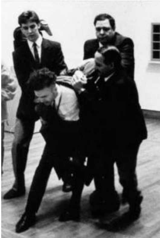
Zadržení po vykonání krvavého daru 31. ledna 1991 v National Gallery v Canadě na výstavě Marcela Duchampa