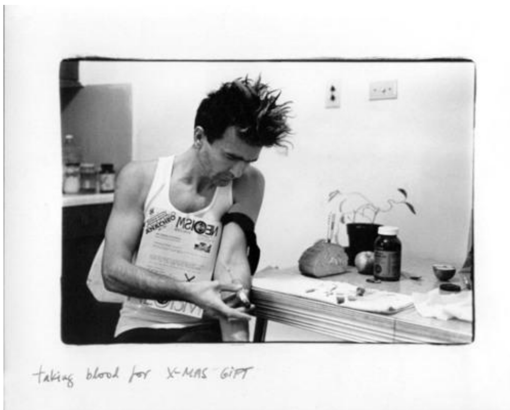
Odebírání krve pro vánoční darování krve, tzv. X-mas Gift v Art Gallery v Ontariu, prosinec 1989