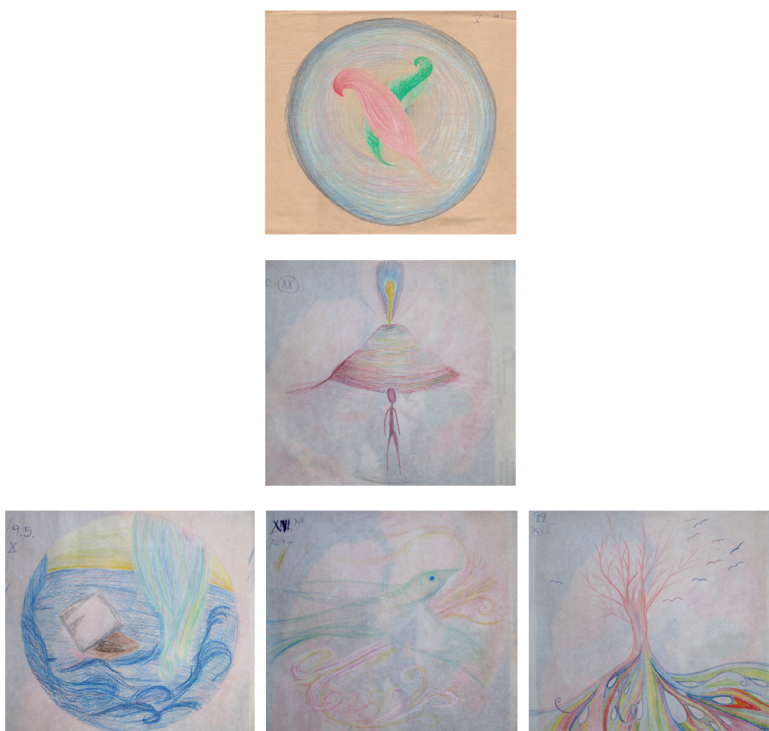
Obr. 3 – Výběr pěti nejvýznamnějších mandal