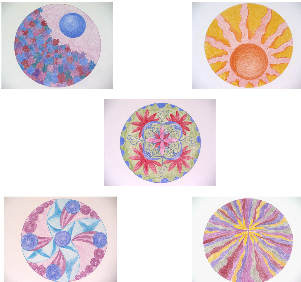
Obr. 1 – Výběr pěti nejvýznamnějších mandal

Výběr pěti mandal se stal vodítkem pro hledání a nalezení vývoje. 3. a 4. mandala připomínají začátek spolupráce, třetí mandalu Julie považuje za zlomovou a čtvrtou za nejenergičtější. 10. obraz se ve výběru objevil z mého hlediska poměrně nečekaně, jelikož se autorka původně nedokázala ztotožnit s emoční erupcí, která tvorbě předcházela i ji provázela. Nyní říká, že k ní změnila přístup a že jí sice nepovažuje za ideál krásy, ale není už v ní prý zloba, pouze velká energie, která lze využít. Dokonce i „puzzlíky“ přestala vnímat primárně negativně, rozpor mezi rodinou a jejím životem v kontextu osamostatňování přestal být tak palčivým. 15. mandala je dle výpovědi ztělesněním pohybu a rotace, zatímco uprostřed