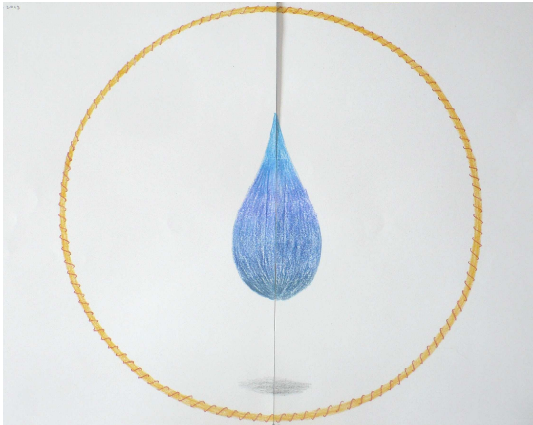
5. mandala – Štěpán

Druhý obraz, na němž ukážu posloupnost objevování významu ze ztvárnění, pochází od Štěpána.