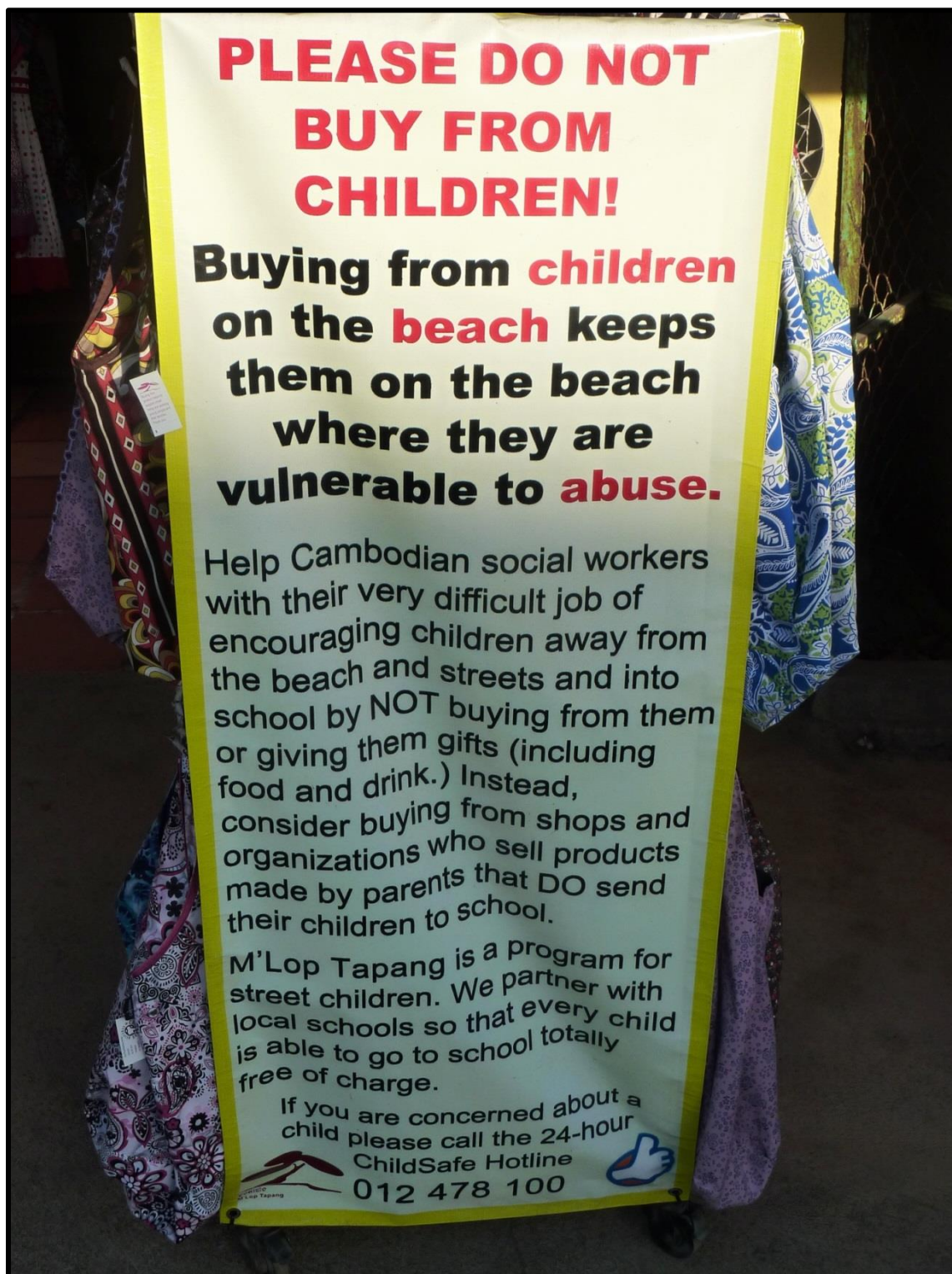
Příloha 12: Ukázka činnosti kambodžské NNO zaměřené na vzdělávání a dětskou práci v provincii Preah Sihanouk