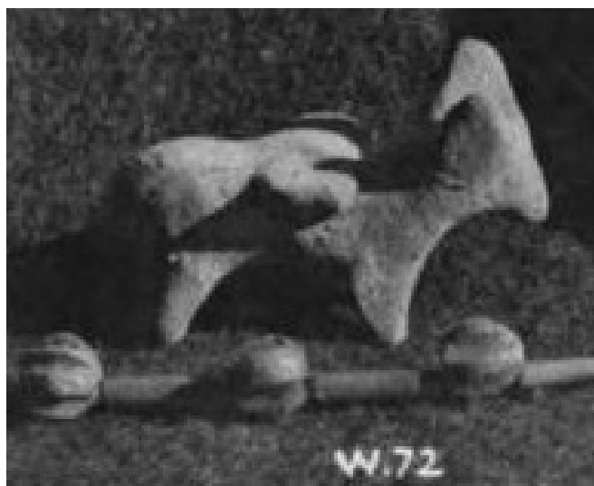
Obr. 2.23 Hliněný oslík s nákladem z Diospolis Parva (Petrie 1901, pl. XXVI)