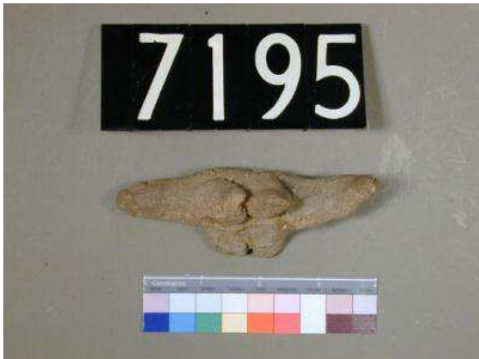
Obr. 2.4 UC 7195 ( http://petriecat.museums.ucl.ac.uk )