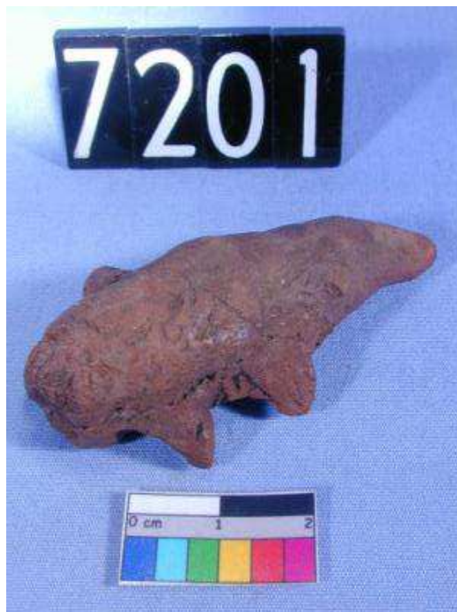
Obr. 2.10 UC 7201 ( http://petriecat.museums.ucl.ac.uk )