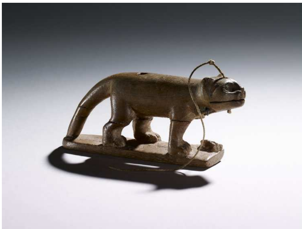
Obr. 2.24 EA 15671 ( http://www.britishmuseum.org )