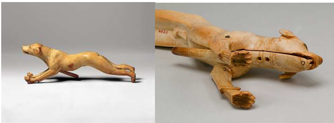
Obr. 2.27 MM 40.2.1