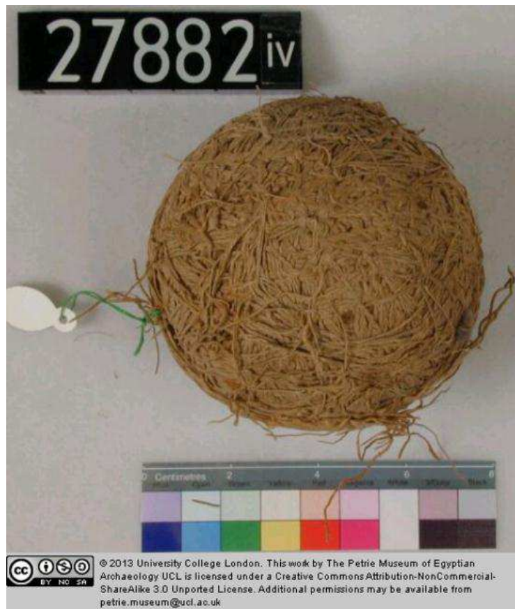
Obr. 1.4 UC 27882iv ( http://petriecat.museums.ucl.ac.uk )