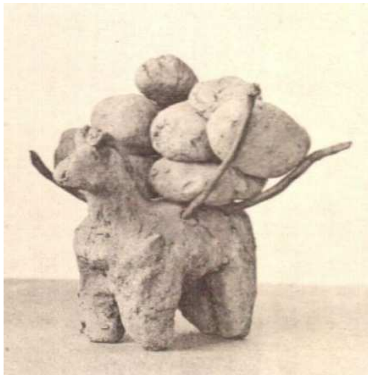
Obr. 2.22 Hliněný oslík s nákladem z Deir el-Bahri (Carnarvon – Carter 1912, pl. XXIII.1)