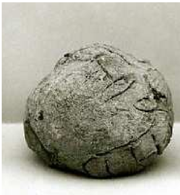
Obr. 1.10 MM 20.2.50