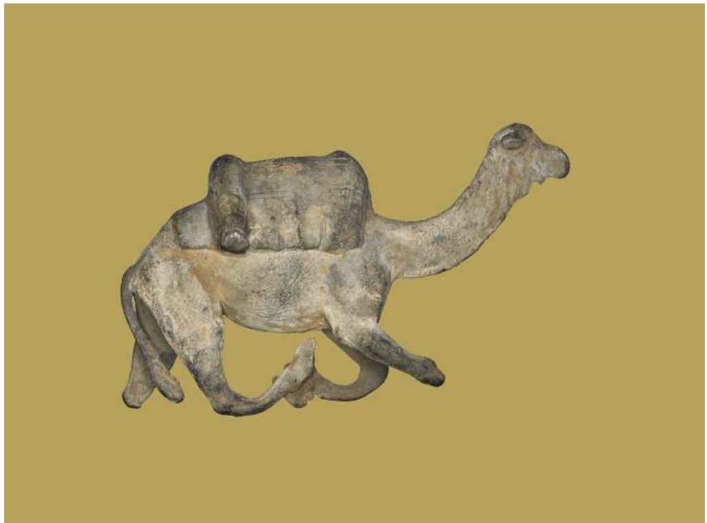
Obr. 7.11 EA 1964,0107.32 ( http://www.britishmuseum.org )