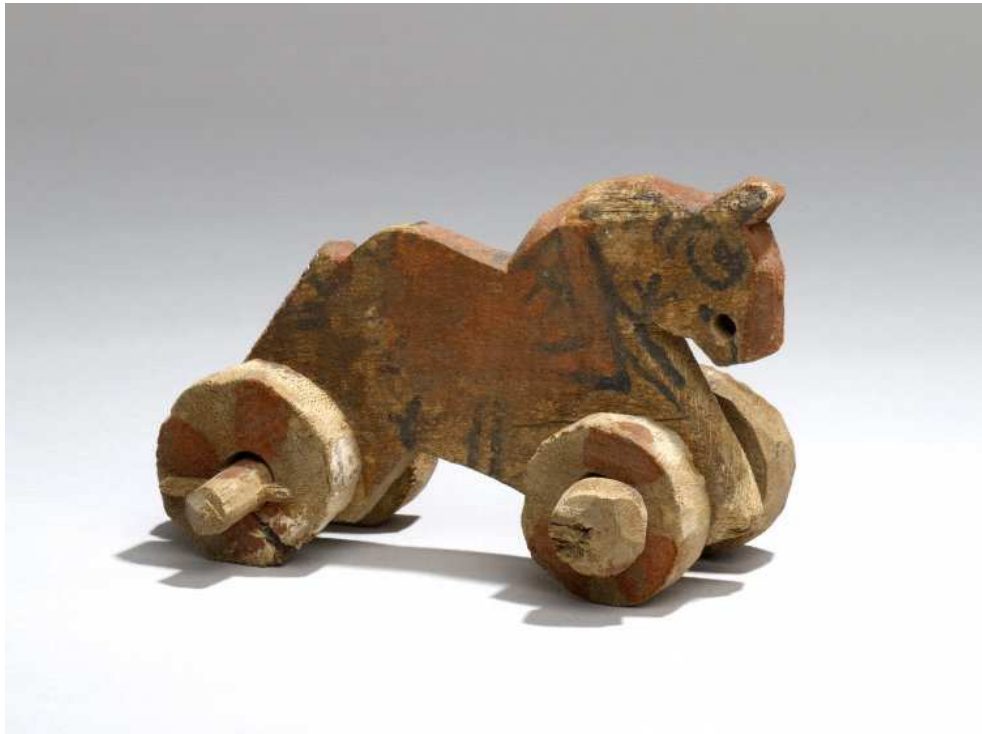
Obr. 7.4 EA 26687