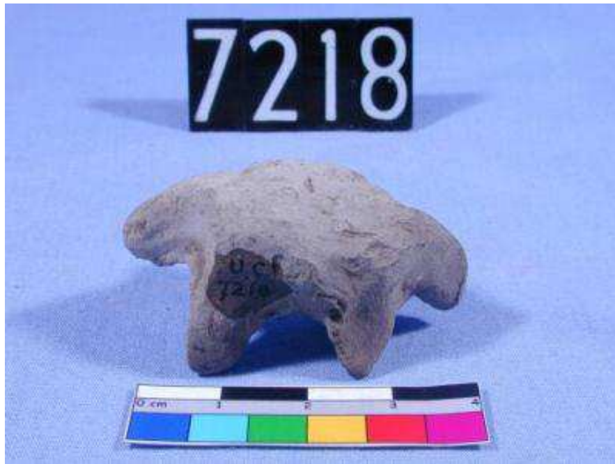
Obr. 2.17 UC 7218 ( http://petriecat.museums.ucl.ac.uk )