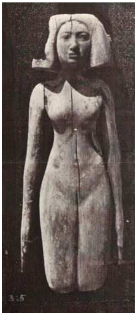
Obr. 3.1 Figurka z hrobu č. 58 v Hawáře (Petrie 1912, pl. XXX)