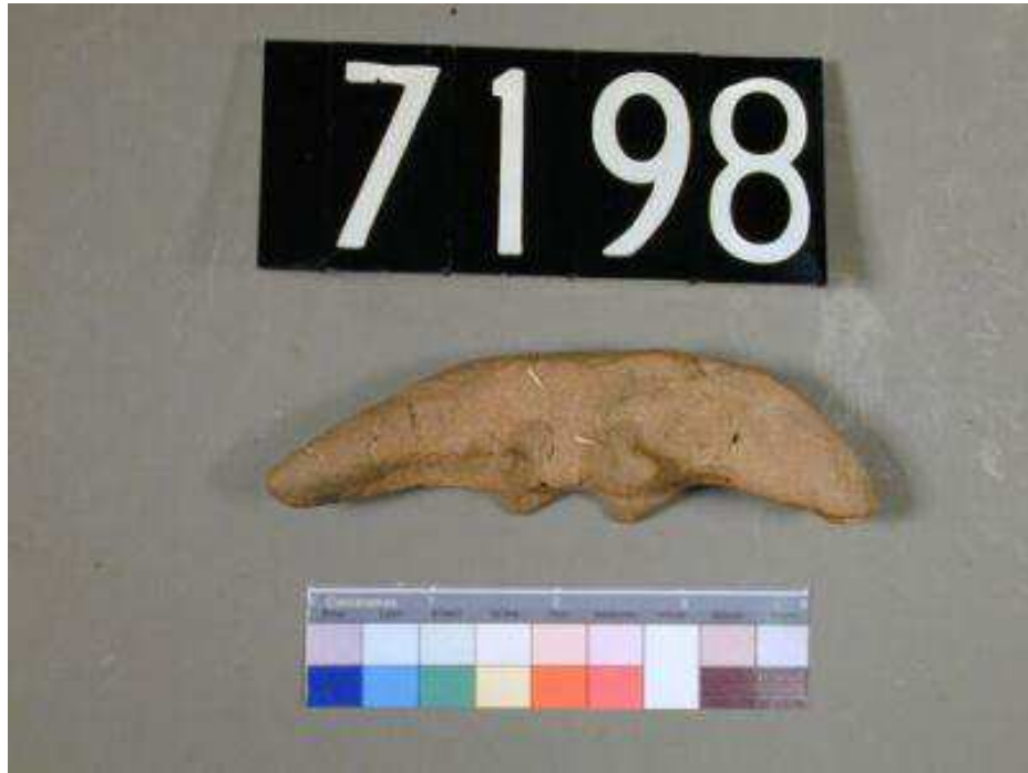
Obr. 2.7 UC 7198 ( http://petriecat.museums.ucl.ac.uk )