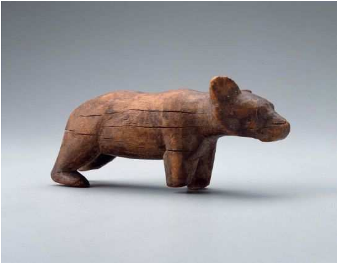
Obr. 2.21 MFA 72.4167 ( www.mfa.org )