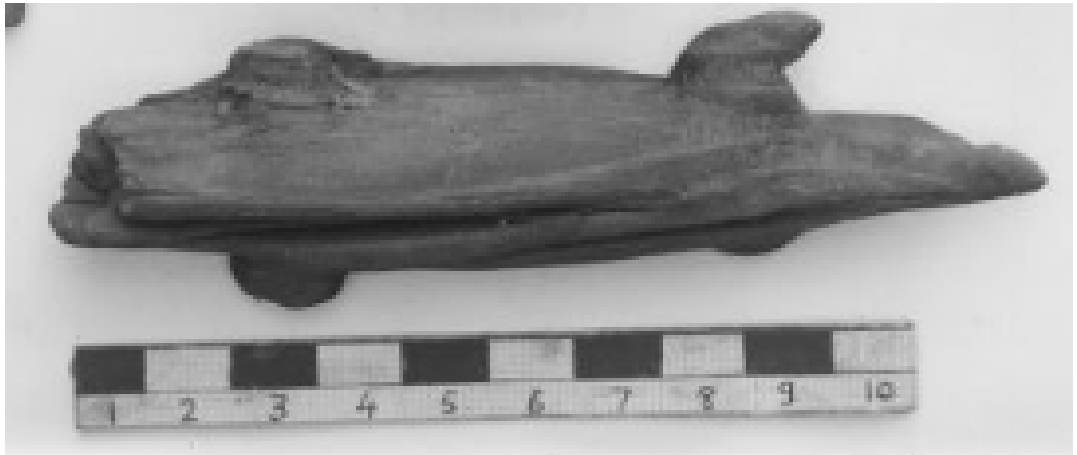
Obr. 2.19 MFA 27.1774 ( www.mfa.org )