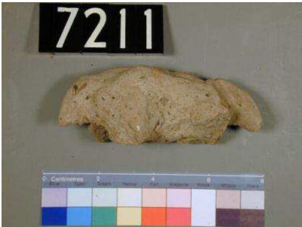
Obr. 2.16 UC 7211 ( http://petriecat.museums.ucl.ac.uk )