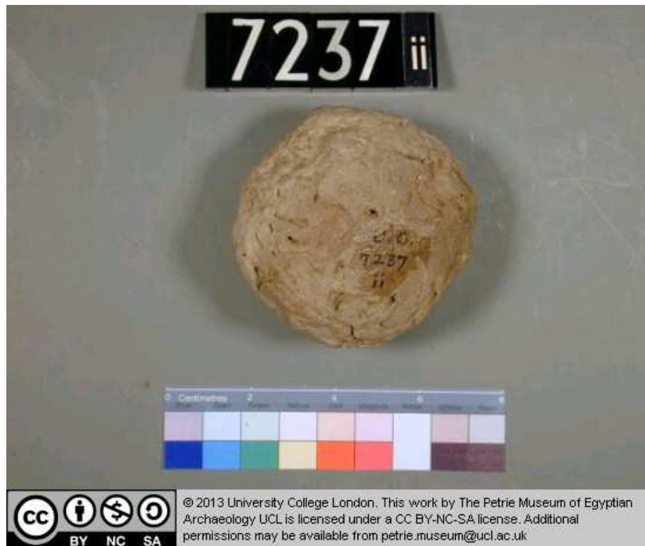
Obr. 1.7 UC 7237ii ( http://petriecat.museums.ucl.ac.uk )