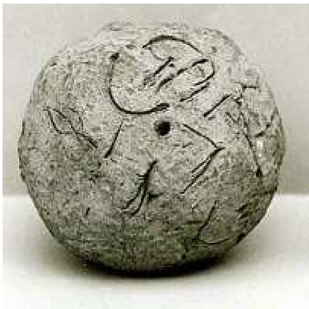
Obr. 1.9 MM 20.2.49 ( www.metmuseum.org )