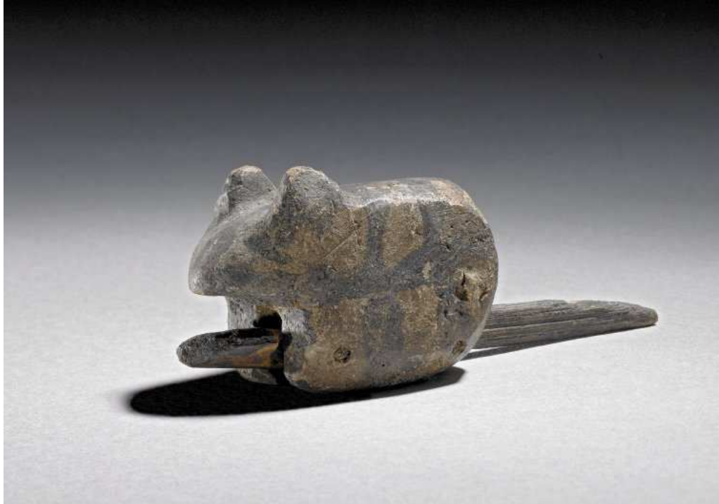
Obr. 2.25 EA 65512