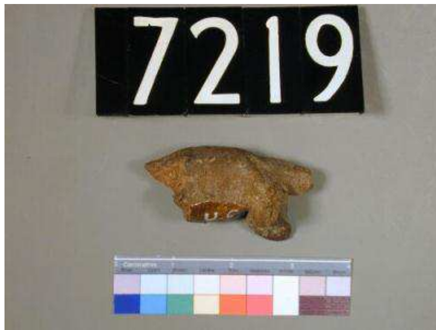
Obr. 2.18 UC 7219 ( http://petriecat.museums.ucl.ac.uk )