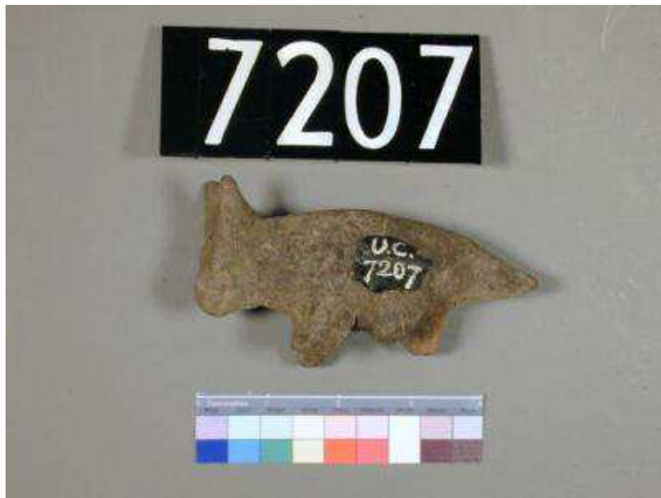
Obr. 2.14 UC 7207 ( http://petriecat.museums.ucl.ac.uk )