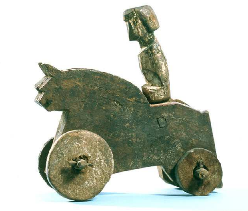
Obr. 7.7 E27134 ( http://www.louvre.fr/en/oeuvre-notices/toy )