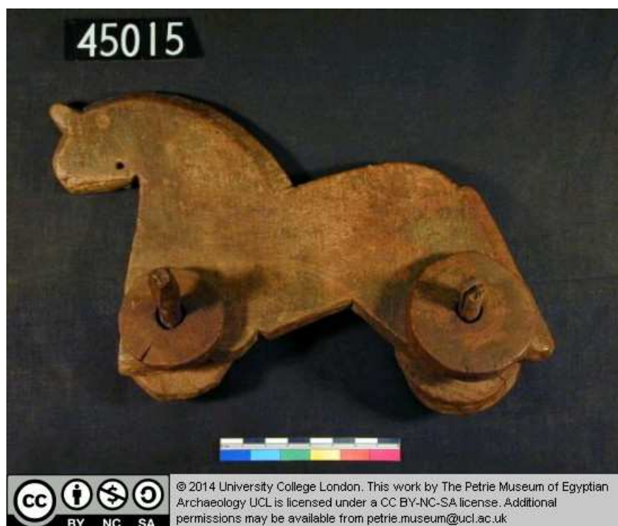
Obr. 7.1 UC 54015 ( http://petriecat.museums.ucl.ac.uk )