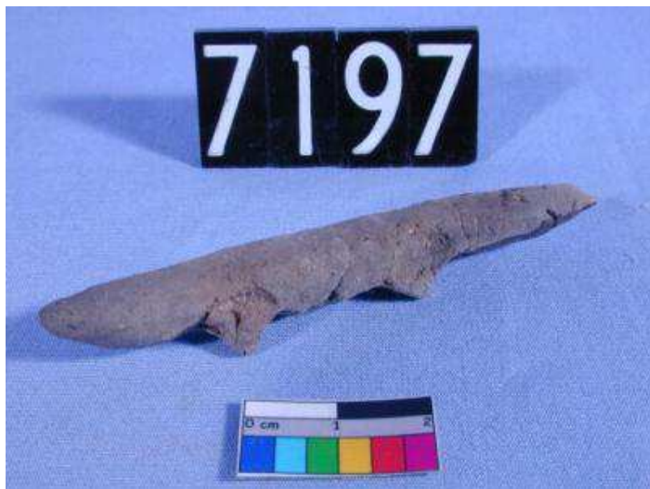
Obr. 2.6 UC 7197