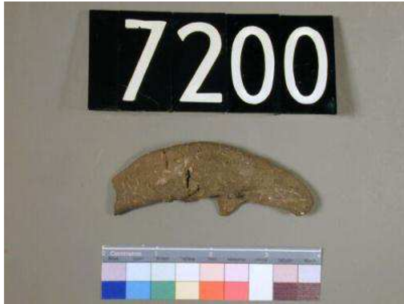
Obr. 2.9 UC 7200