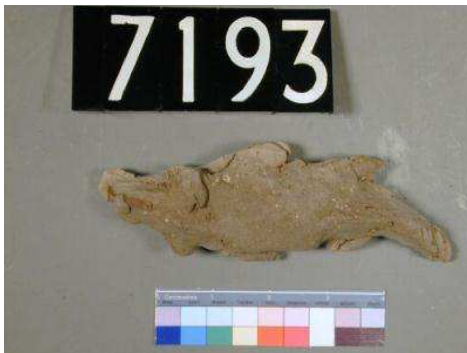
Obr. 2.2 UC 7193