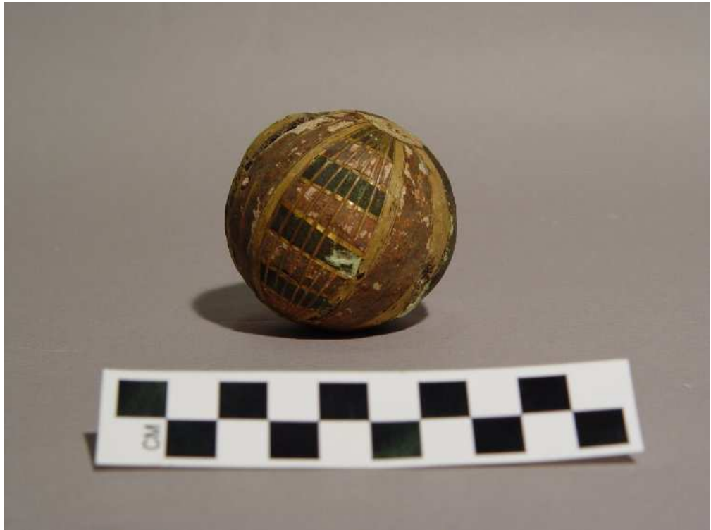
Obr. 7.10 EA 46711 ( http://www.britishmuseum.org )