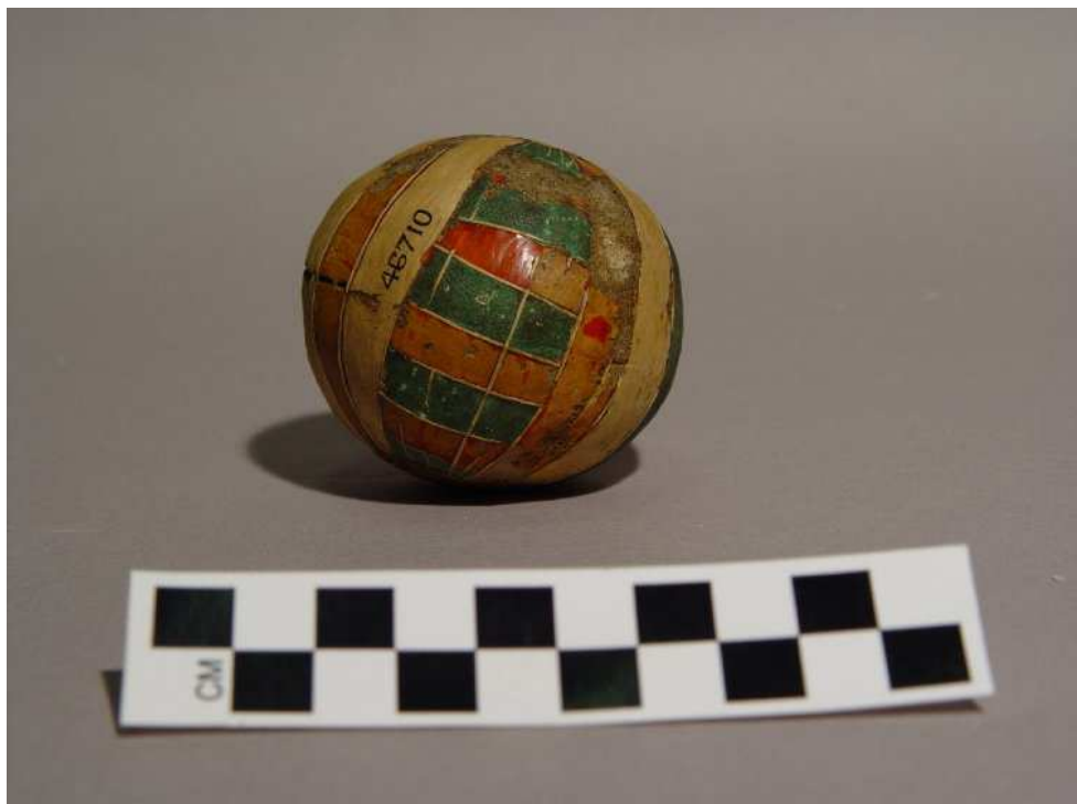
Obr. 7.9 EA 46710 ( http://www.britishmuseum.org )