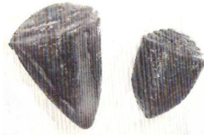
Obr. 4.3 Káči z Fajjúmu (Janssen – Janssen 1990, 45, fig. 19)