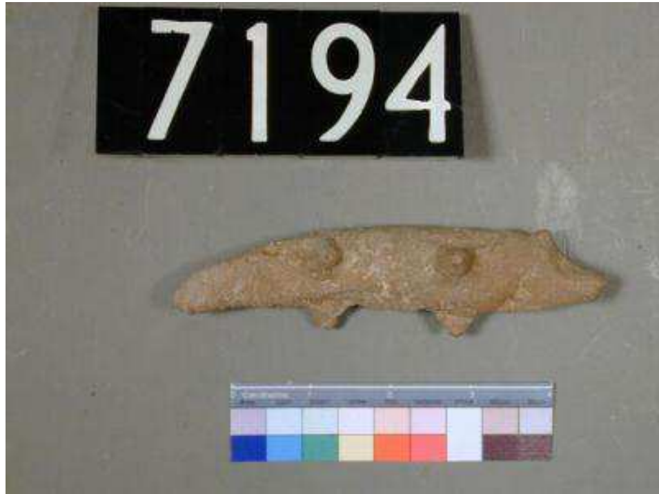
Obr. 2.3 UC 7194 ( http://petriecat.museums.ucl.ac.uk )