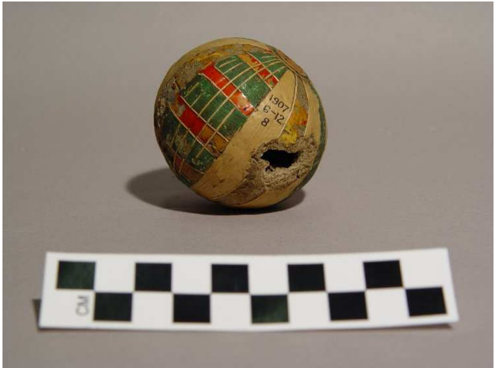
Obr. 7.8 EA 46709 ( http://www.britishmuseum.org )