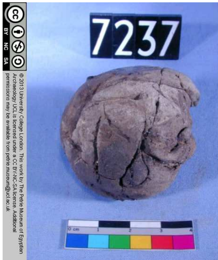
Obr. 1.6 UC 7237 ( http://petriecat.museums.ucl.ac.uk )