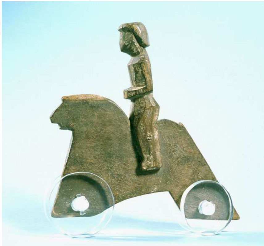
Obr. 7.6 AF 1185 ( http://www.louvre.fr/en/oeuvre-notices/toy )