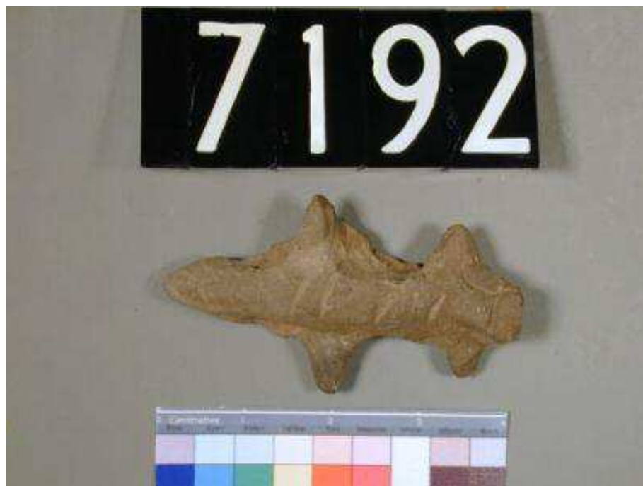
Obr. 2.1 UC 7192 ( http://petriecat.museums.ucl.ac.uk )