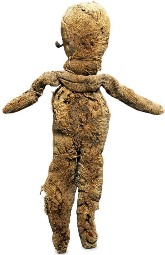
Obr. 7.12 EA 1905,1021.13