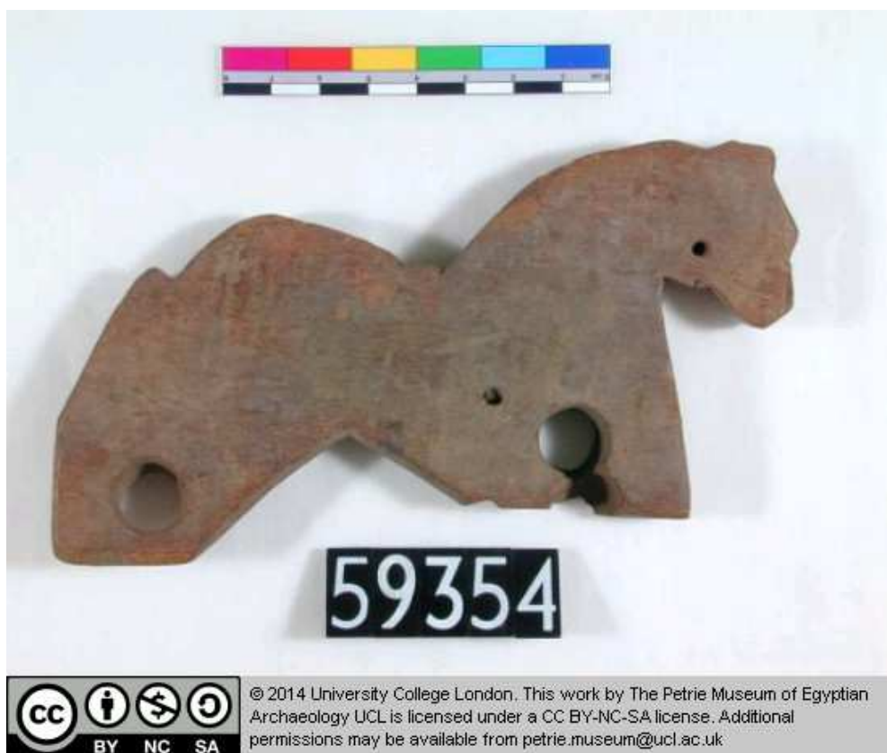
Obr. 7.3 UC 59354 ( http://petriecat.museums.ucl.ac.uk )