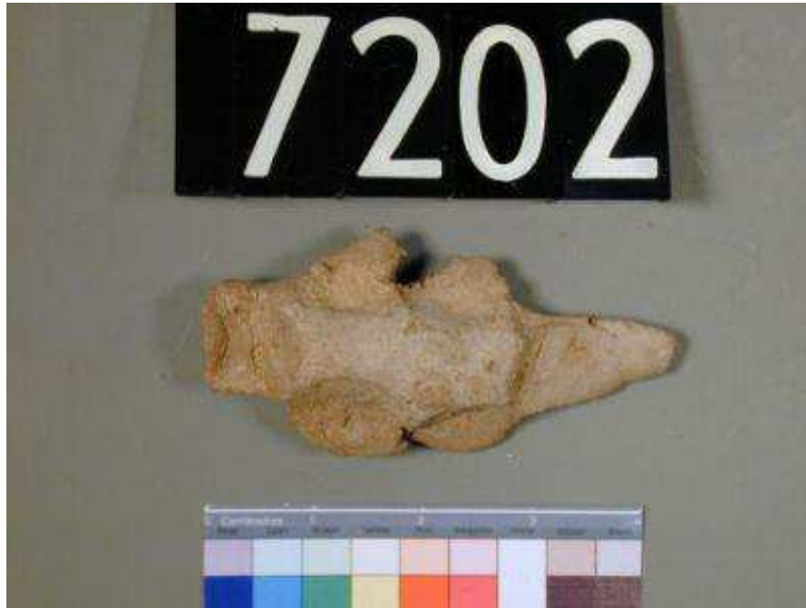
Obr. 2.11 UC 7202 ( http://petriecat.museums.ucl.ac.uk )