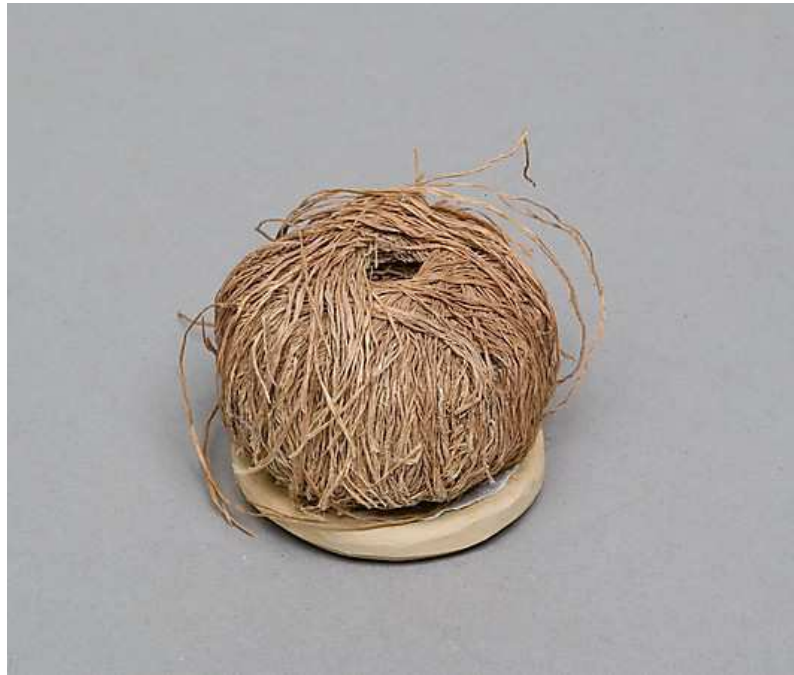
Obr. 1.5 MM 15.3.1122 ( www.metmuseum.org )