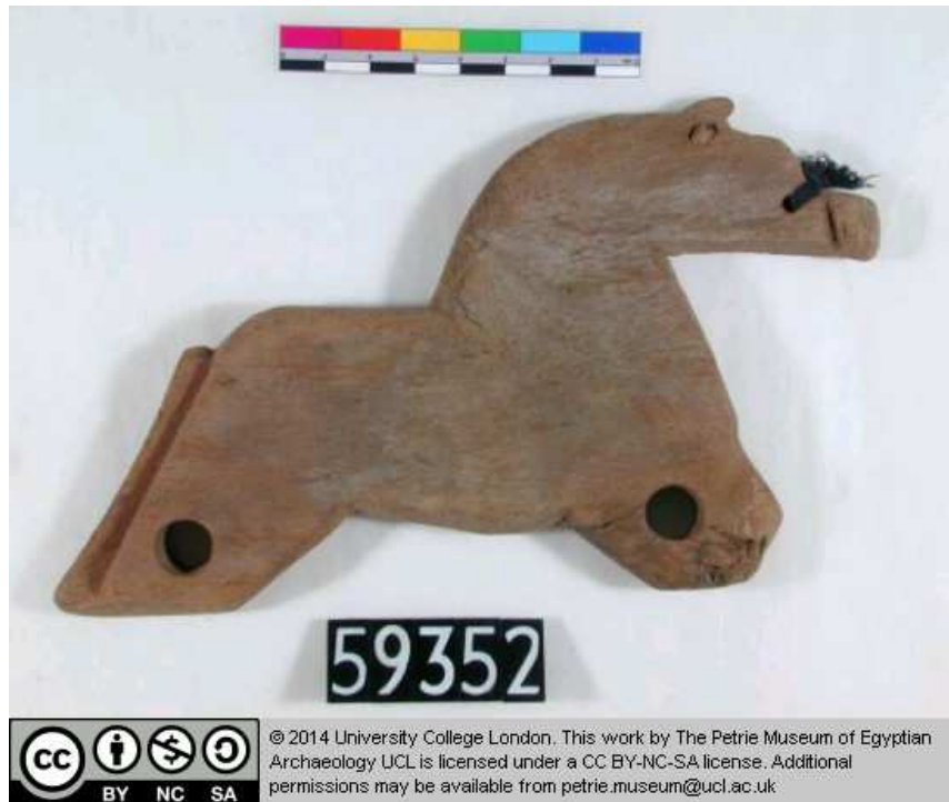
Obr. 7.2 UC 59352 ( http://petriecat.museums.ucl.ac.uk )