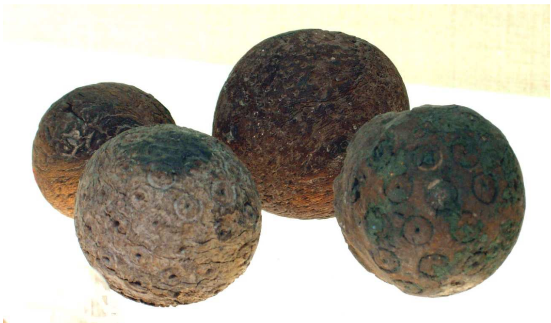
Obr. 1.8 MM 22.1.703 ( www.metmuseum.org )