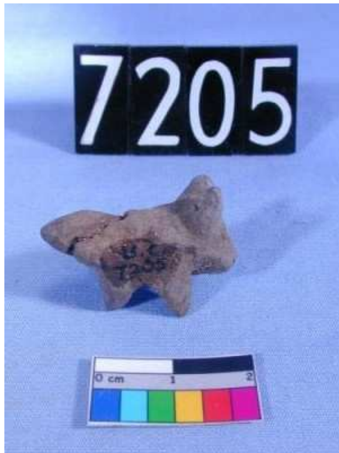
Obr. 2.12 UC 7205 ( http://petriecat.museums.ucl.ac.uk )