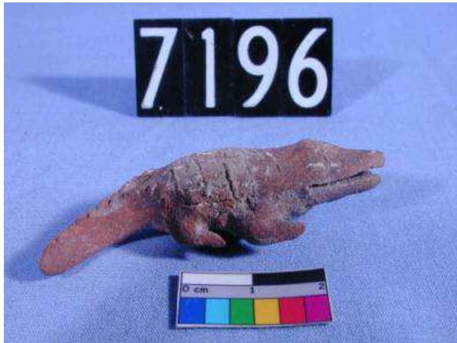
Obr. 2.5 UC 7196 ( http://petriecat.museums.ucl.ac.uk )