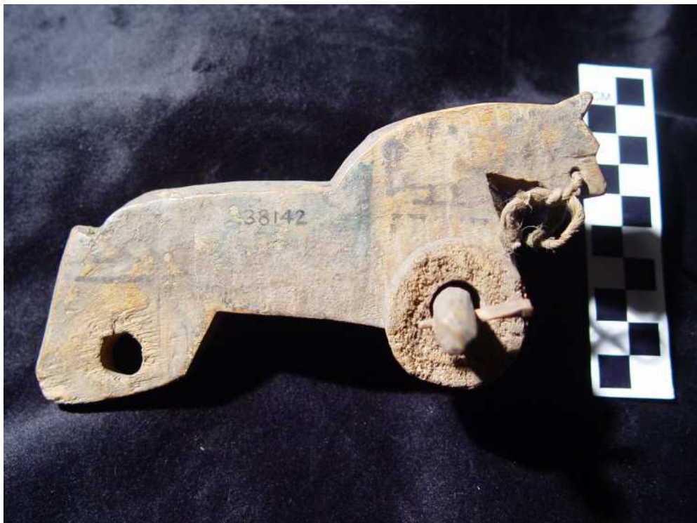
Obr. 7.5 EA 38142 ( http://www.britishmuseum.org )