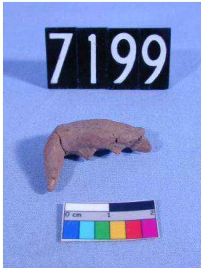
Obr. 2.8 UC 7199 ( http://petriecat.museums.ucl.ac.uk )