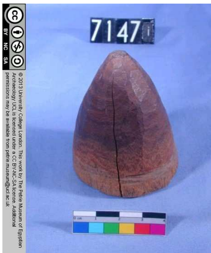
Obr. 4.1 UC 7147i ( http://petriecat.museums.ucl.ac.uk )