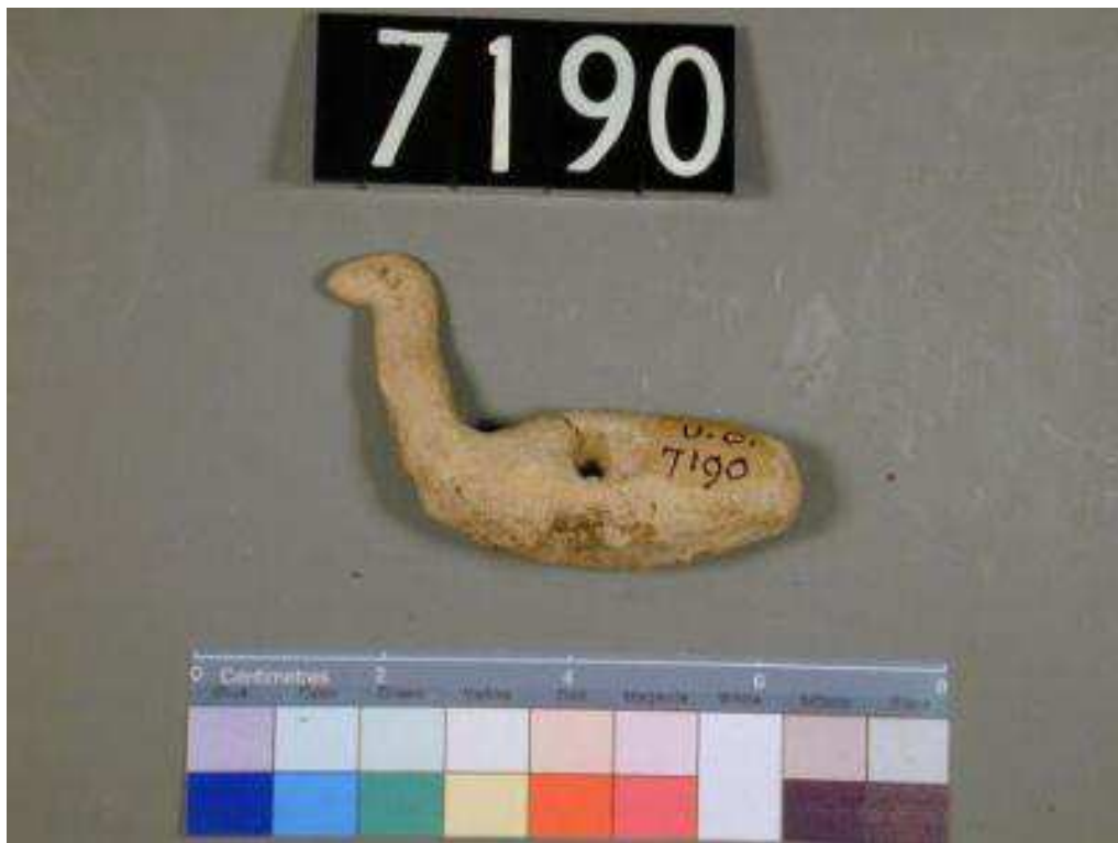
Obr. 2.20 UC 7190 ( http://petriecat.museums.ucl.ac.uk )