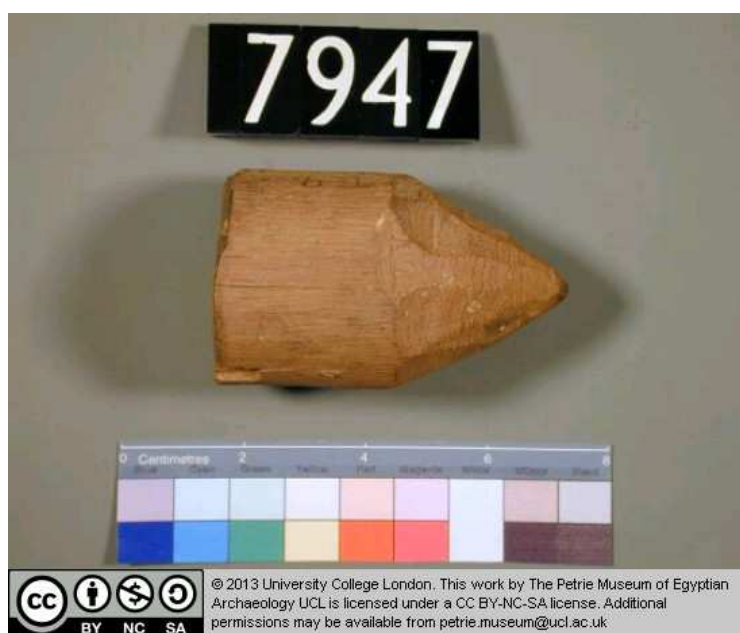
Obr. 4.2 UC 7947 ( http://petriecat.museums.ucl.ac.uk )