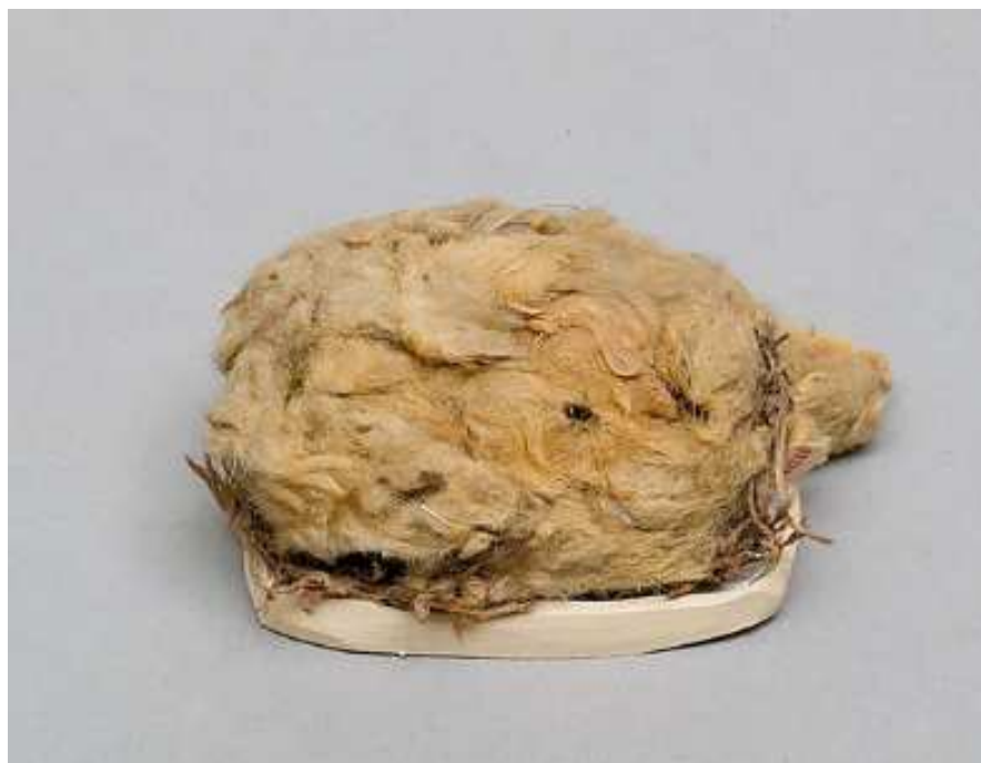
Obr. 1.2 MM 22.1.1206 ( www.metmuseum.org )