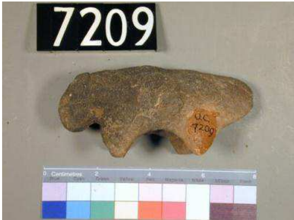
Obr. 2.15 UC 7209 ( http://petriecat.museums.ucl.ac.uk )