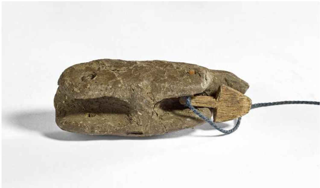
Obr. 2.26 EA 38540