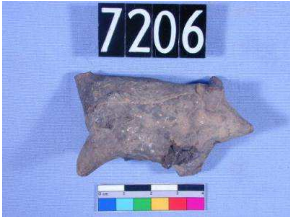
Obr. 2.13 UC 7206 ( http://petriecat.museums.ucl.ac.uk )