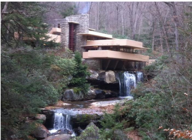
Frank Lloyd Wright: Fallingwater, 1939, Pennsylvania.