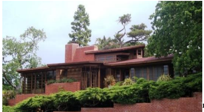
Frank Lloyd Wright: Hanna House, 1936, California.