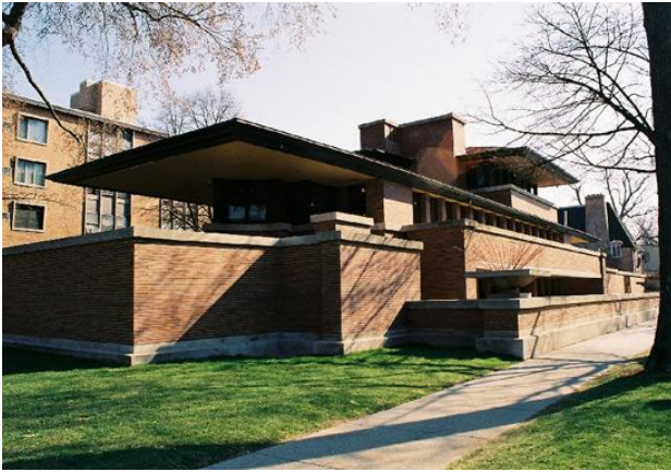
Frank Lloyd Wright: Robie House, 1910, Chicago.