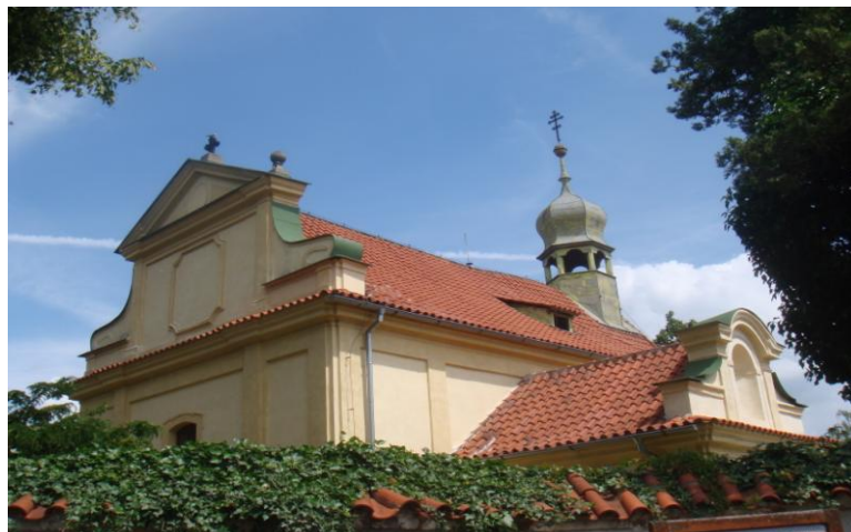
Pohled na kostel Nanebevzetí Panny Marie