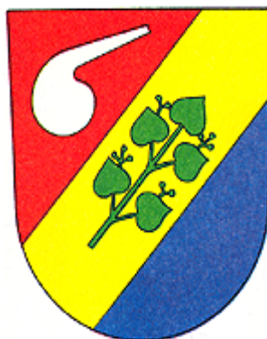
Erb města 347