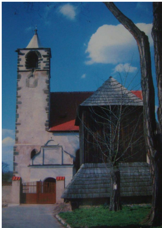
Kostel sv. Jakuba Většího v Libiši