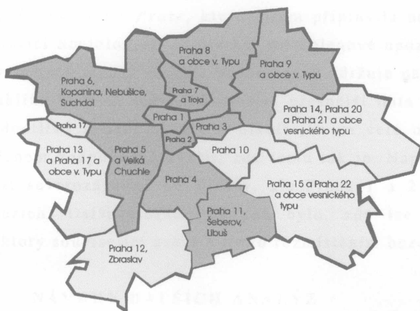
Mapa č.2 – Množství bezdomovců při sebesčítání

Barevné odlišení znamená následující rozpětí počtu bezdomovců na danou část Prahy: