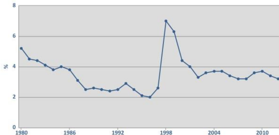
Graf 1. Nezamestnanosť v %.