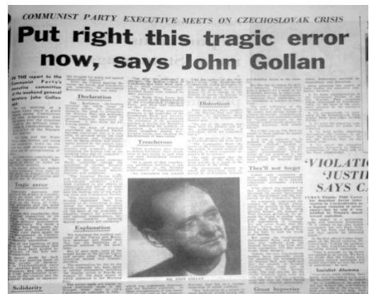
Zdroj: Morning Star, 26. 8. 1968