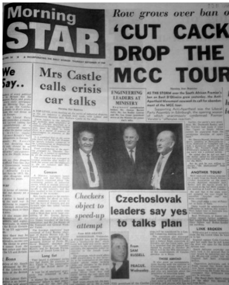
Zdroj: Morning Star, 19. 9. 1968