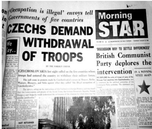
Zdroj: Morning Star, 22. 8. 1968