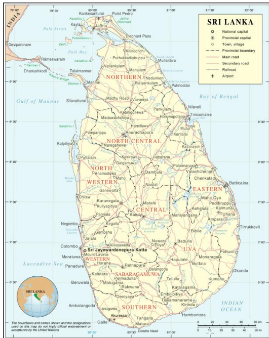
Obrázek 1: Mapa Srí Lanky