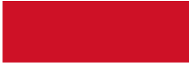
Obrázek 6: Vlajka Indonésie