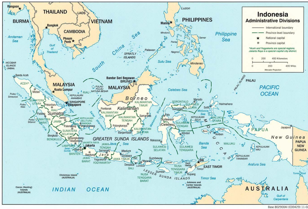
Obrázek 4: Mapa Indonésie