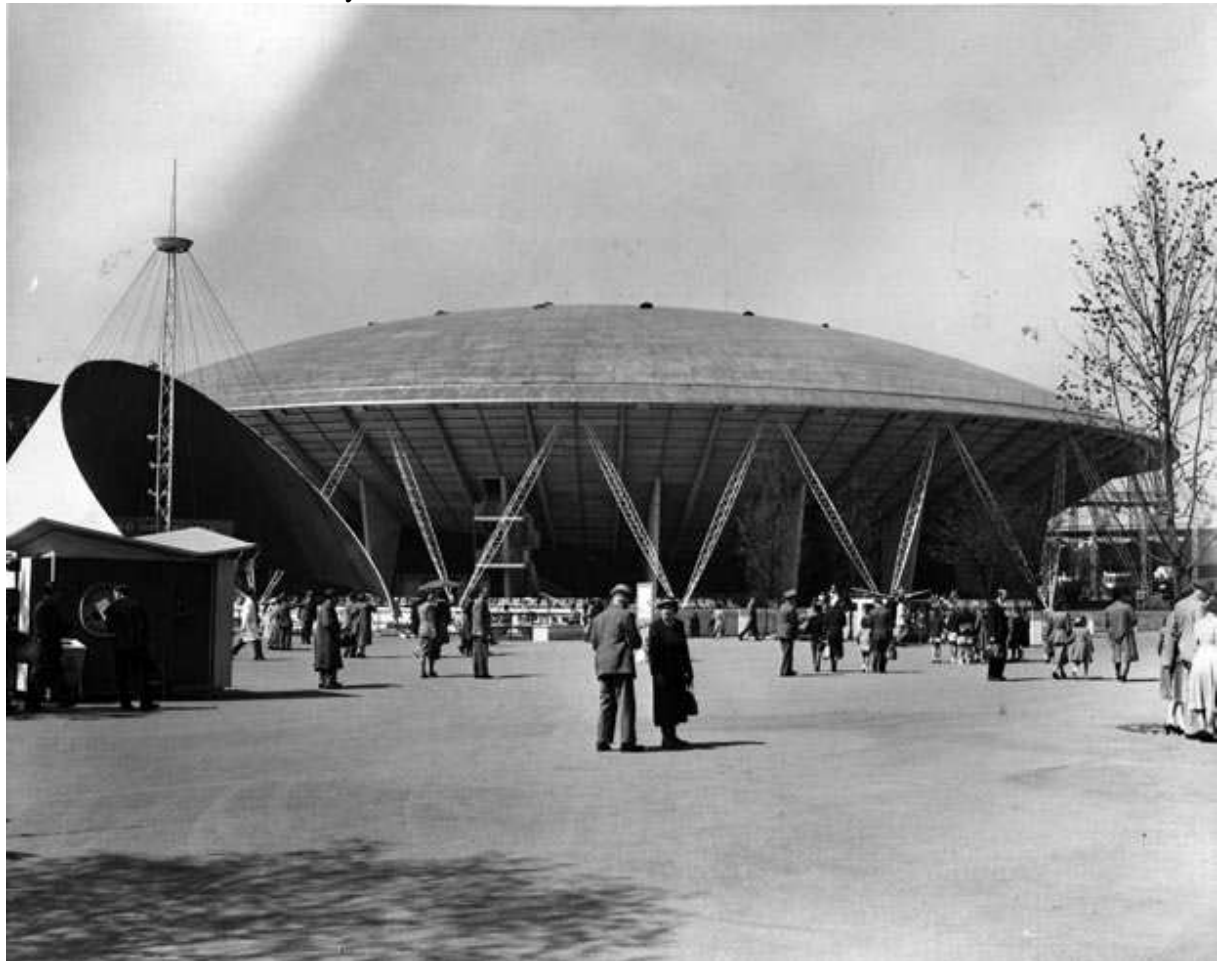
Příloha 5: Dome of Discovery