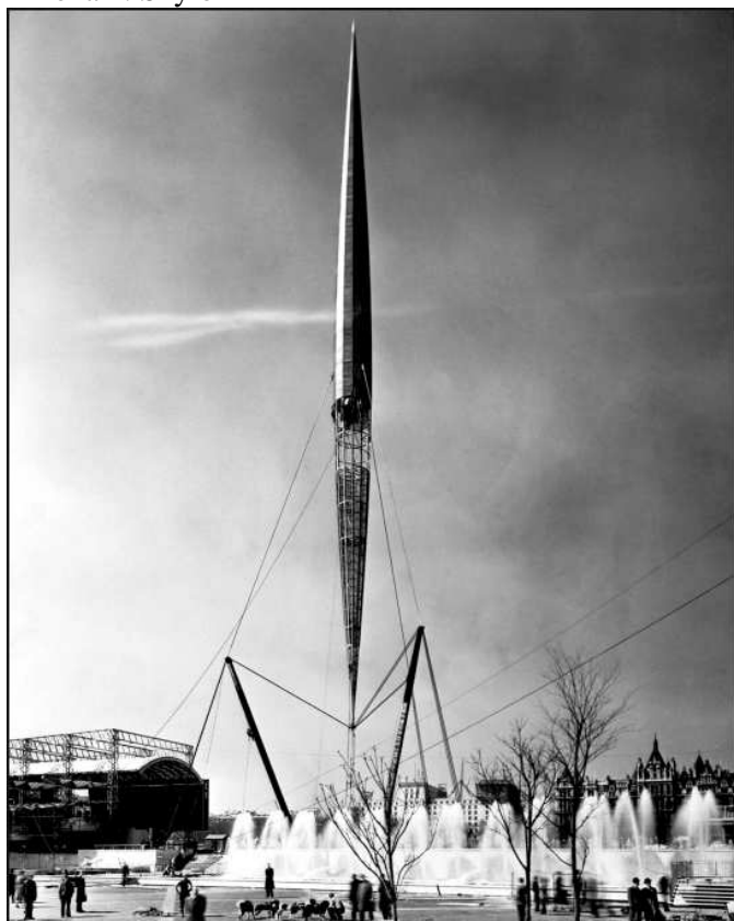
Příloha 4: Skylon