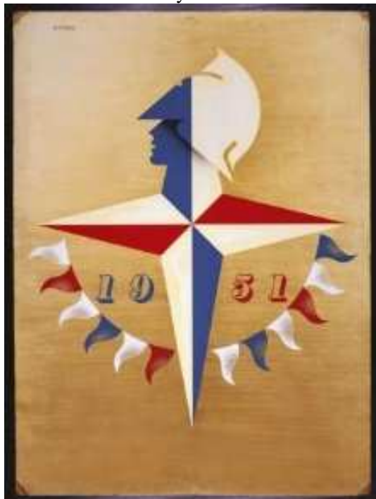
Příloha 3: Festivalový znak od Abrama Gamese