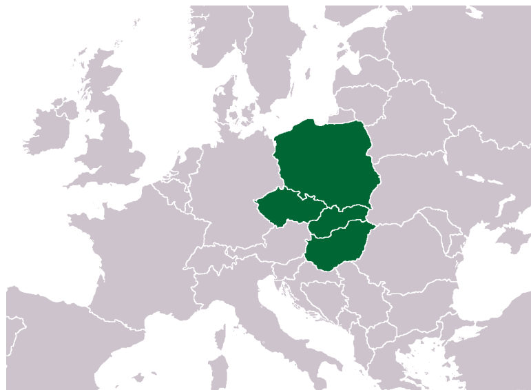
Obr. 5. Státy Visegrádské čtyřky