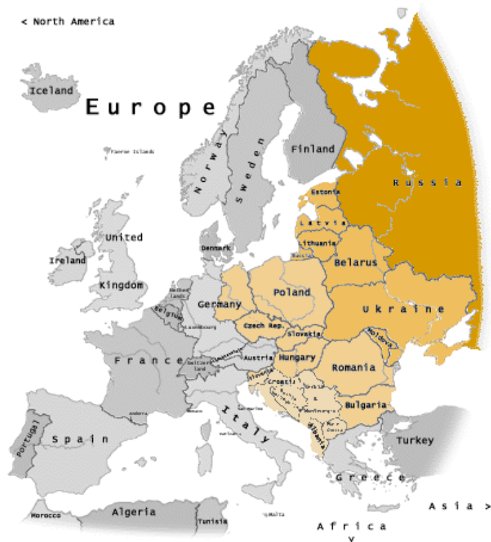
Obr. 7. Střední Evropa v době studené války