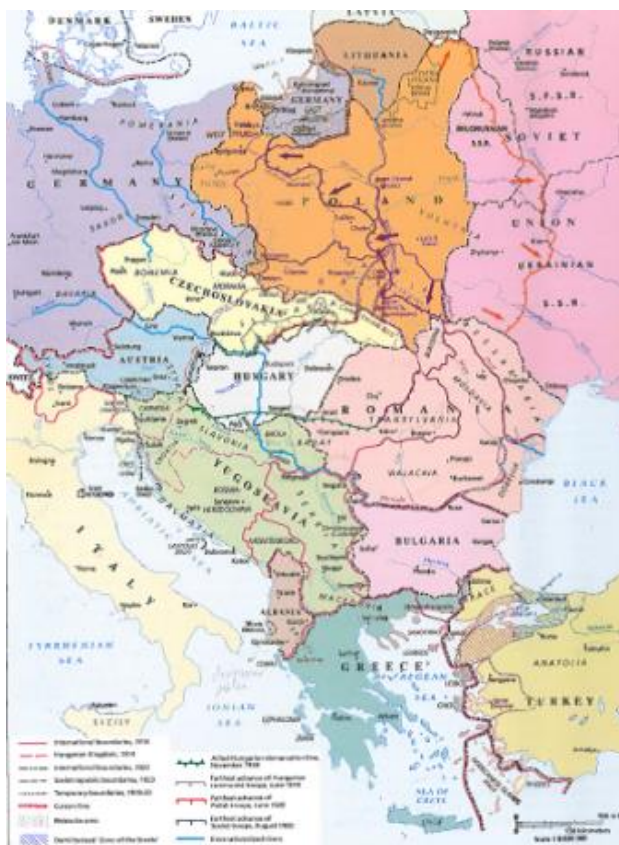
Obr. 10. Střední Evropa v letech 1918-1923 (převzato z Historical Atlas, s. 126)