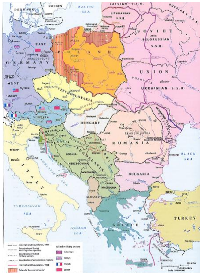
Obr. 12. Střední Evropa po druhé světové válce (převzato z Historical Atlas, str. 186)

Československo se vrátilo do svých původních „předmnichovských“ hranic s jednou výjimkou a tou byla oblast Zakarpatské Rusi, která byla po vzájemné dohodě Československa a Sovětského svazu přiřčleněna k sovětské Ukrajině. 161