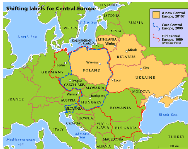
Obr. 6. Proměny hranic střední Evropy podle časopisu The Economist

zůstalo pouze Polsko, přibylo by naopak Bělorusko, Litva a Ukrajina. 27 Jinými slovy řečeno by tak došlo k posunu střední Evropy více na východ.