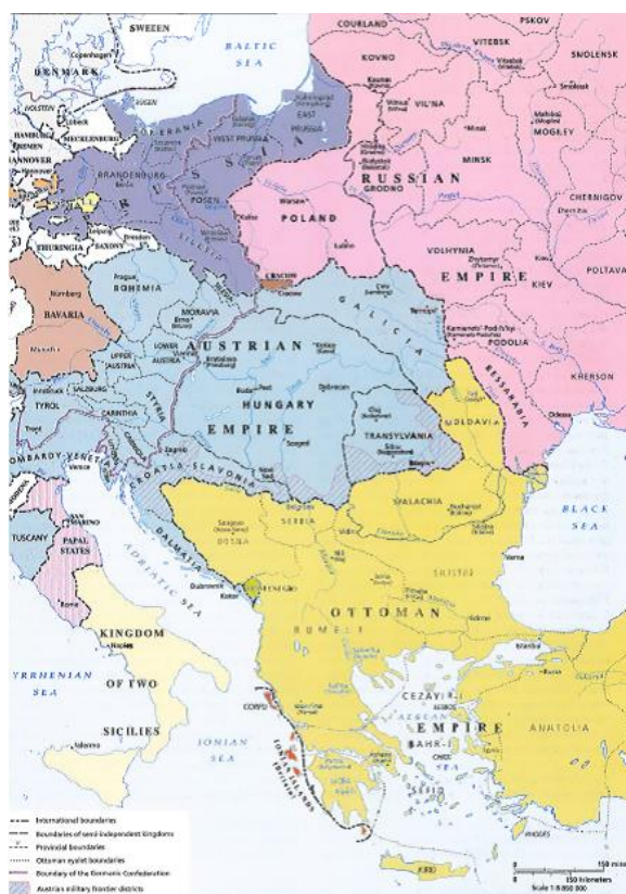
Obr. 8. Střední Evropa v roce 1815 (převzato z Historical Atlas, s. 77)

Z výše uvedeného je tak patrné, že střední Evropa v tomto období a v podstatě až do konce první světové války (tedy do roku 1918) byla součástí tří velkých impérií: habsburského, ruského a pruského (německého). Jak se později ukáže, po první světové válce a rozpadu Habsburské monarchie sice dochází k zániku jedné této říše, nicméně střední Evropa zůstane předmětem geopolitického zájmu zbylých dvou mocností (německé a ruské) v podstatě až do konce vestfálského systému. Můžeme tedy skutečně tvrdit, že středoevropský region leží (nejen geograficky, ale také geopoliticky) mezi Německem a Ruskem.