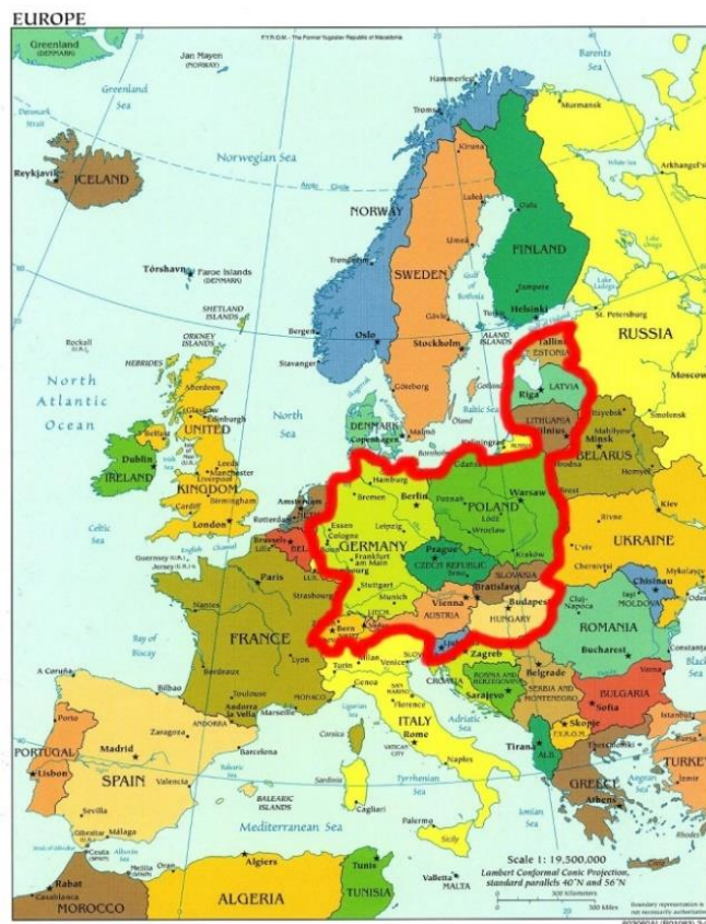
Obr. 1. Mapa střední Evropy dle MZV

Jak vyplývá z přiložené mapy (Obr. 1. 13 ), střední Evropa se tak částí své východní hranice dotýká až ruských hranic a pokrývá značnou zeměpisnou rozlohu evropského kontinentu.