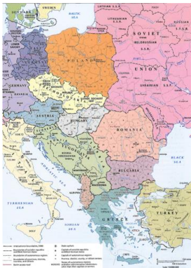
Obr. 13. Střední Evropa v roce 1980 – v době studené války a před koncem vestfálského systému