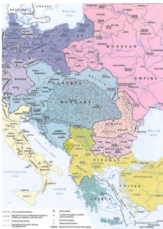
Obr. 9. Střední Evropa v roce 1910 (převzato z Historical Atlas, s. 119)

Na konci prvního desetiletí 20. století pak dochází ke změně dosavadního fungování mezinárodního systému, evropského koncertu velmocí, který byl zaveden po Vídeňském kongresu v roce 1815, a téměř sto let se jeho prostřednictvím dařilo v Evropě udržovat mír. Velmoci se vrhly do bipolárního zápasu dvou mocenských bloků (podobný model se objevil také během studené války o půl století později). 115