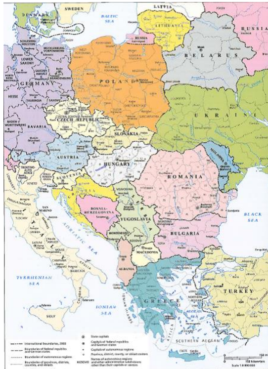
Obr. 14. Střední Evropa po roce 1989 – v postvestfálském systému (převzato z Historical Atlas, str. 222)