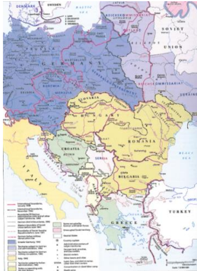
Obr. 11. Střední Evropa v době druhé světové války do roku 1942

tzv. „větší Německo“; a území vojensky okupované Německem.(viz přiložená mapa). Z toho vyplývá, že v podstatě celá střední Evropa byla ovládána Německem. 152