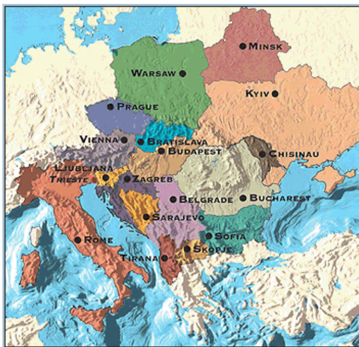
Obr. 3. Státy náležící do Středoevropské iniciativy

došlo ke vzniku tzv. Pentagonály. V současnosti je SEI tvořena celkem 18 zeměmi: Albánie, Bělorusko, Bosna a Hercegovina, Bulharsko, Černá Hora, Česká republika, Chorvatsko, Itálie, Maďarsko, Makedonie, Moldávie, Polsko, Rakousko, Rumunsko, Slovensko, Slovinsko, Srbsko, Ukrajina. 17