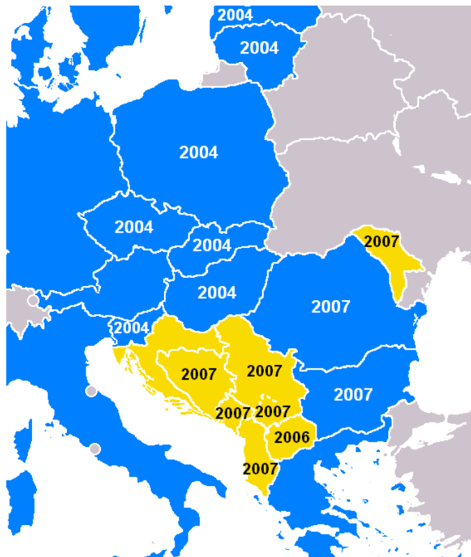
Obr. 4. Středoevropská zóna volného obchodu

evropské státy Albánie, Bosna a Hercegovina, Černá Hora, Chorvatsko, Moldavsko, Srbsko a UNMIK pro teritorium Kosova. 20