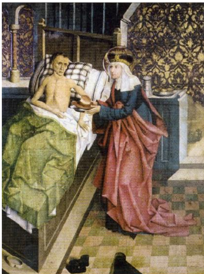
Obrázek. č. 6. Paní Zdislava